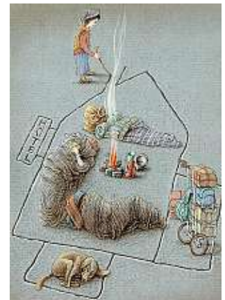
– Foyer dans le cœur –

Hausse de la pauvreté et des inégalités en Russie.