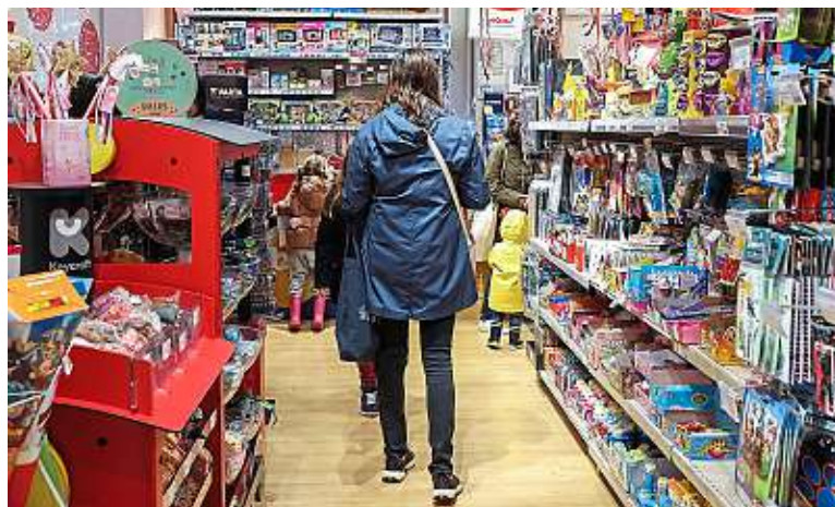
Le neuf a encore largement la cote pour les courses de Noël.

C'est ce qui ressort d'une enquête exclusive OpinionWay* pour 20 Minutes, réalisée auprès de sa communauté #MoiJeune (lire l'encadré). Les deux tiers (69 %) des jeunes de 18 à 30 ans sondés n'ont jamais offert de cadeau de seconde main à Noël, même si 78 % d'entre eux se disent « prêts à le faire ». L'intention est là, pas encore les actes. « Il y a sans doute un tabou encore un peu prégnant à Noël, mais je crois que la tendance va se démocratiser au fur et à mesure »,