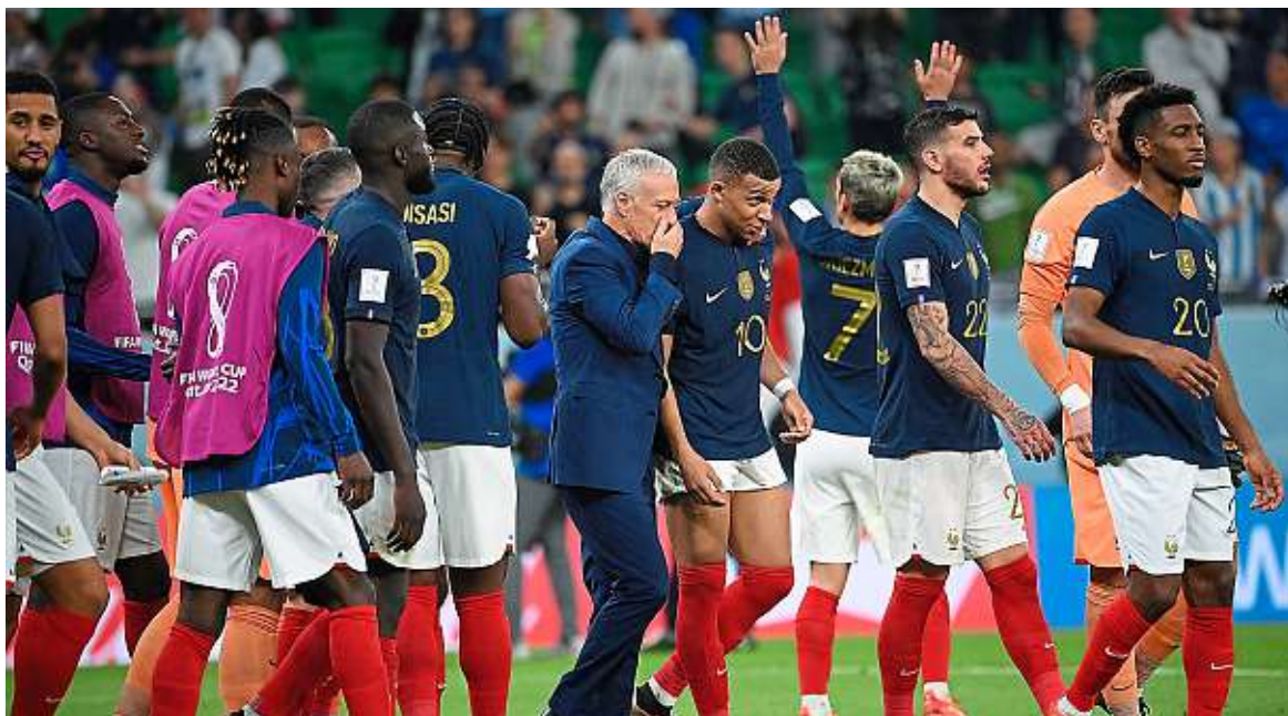
En Angleterre et au Maroc, on prononce le nom des joueurs de l'équipe de France pour faire peur aux enfants qui ne veulent pas manger leur soupe.