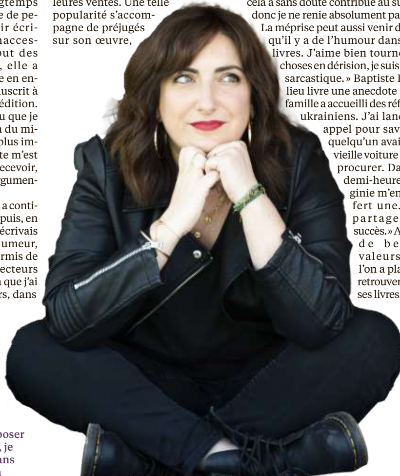
Virginie Grimaldi a l'habitude de briller aux classements des meilleures ventes. Leextra

ère, où les auteurs et les éditeurs n'auraient plus la liberté d'avant, concède l'écrivaine. Je trouve ça très dangereux. Cela m'était insupportable de cautionner quelque chose que j'ai toujours réprouvé. J'étais en position de m'opposer à ça. C'était facile pour moi, je savais que je retrouverais sans problème une autre maison d'édition. »