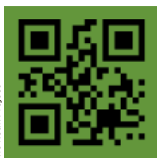
The Noun Project