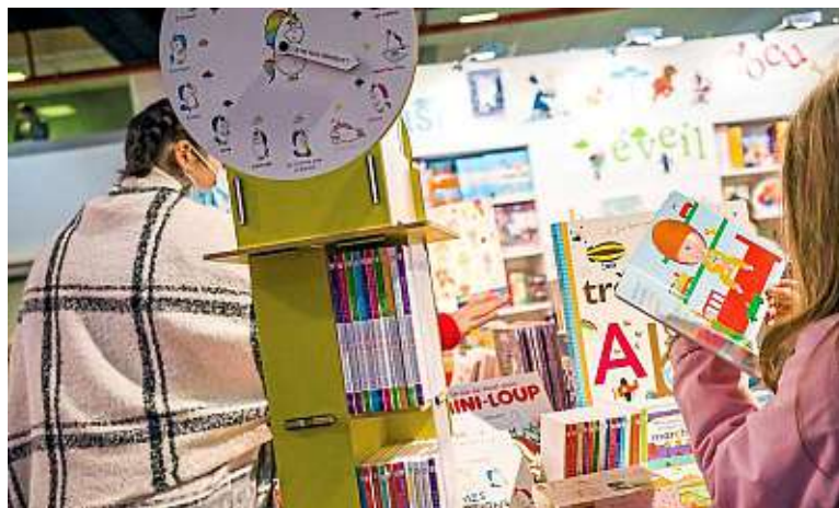
Le Salon du livre et de la presse jeunesse s'ouvre ce mercredi à Montreuil.

« JEFFERSON FAIT DE SON MIEUX », DE JEAN-CLAUDE MOURLEVAT (ÉD. GALLIMARD JEUNESSE). Après un excellent premier tome, l'auteur redonne vie à Jefferson, le hérisson, qui va tenter de sauver Simone, la solitaire et timide lapine rencontrée dans l'opus précédent. « Les aventures de ce hérisson courageux sont d'accessibles polars, originaux et très drôles, véhiculant des observations pertinentes sur des sujets graves tels que la cruauté animale, l'embrigadement des plus vulnérables ou le deuil »,