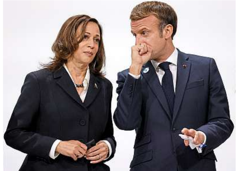
Emmanuel Macron doit rencontrer Kamala Harris, chargée des questions spatiales.

C'est en tout cas l'histoire qu'Emmanuel Macron veut raconter lors de cette visite : celle d'une excellente relation avec les États-Unis. Sauf que la relance du programme spatial américain taille des croupières à la France et à l'Europe