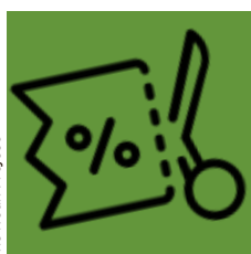
The Noun Project

33 milliards de tickets de caisse sont édités, chaque année, en France. Autant de production de déchets, non recyclables qui plus est.