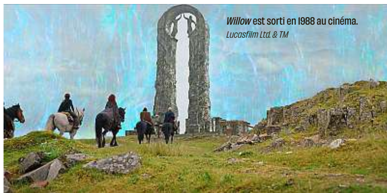
Willow est sorti en 1988 au cinéma. Lucasfilm Ltd. & TM

Vidéo Ce film est le coup de cœur de notre journaliste