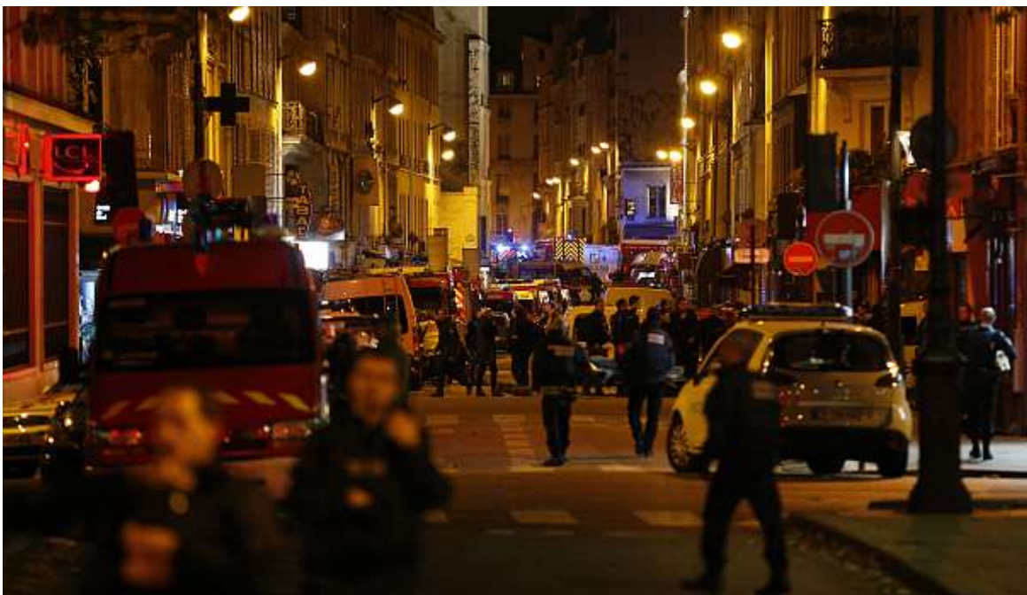
Des dizaines de policiers et de pompiers devant le Bataclan, dans le 11 e arrondissement de Paris, dans la nuit du 13 au 14 novembre 2015.