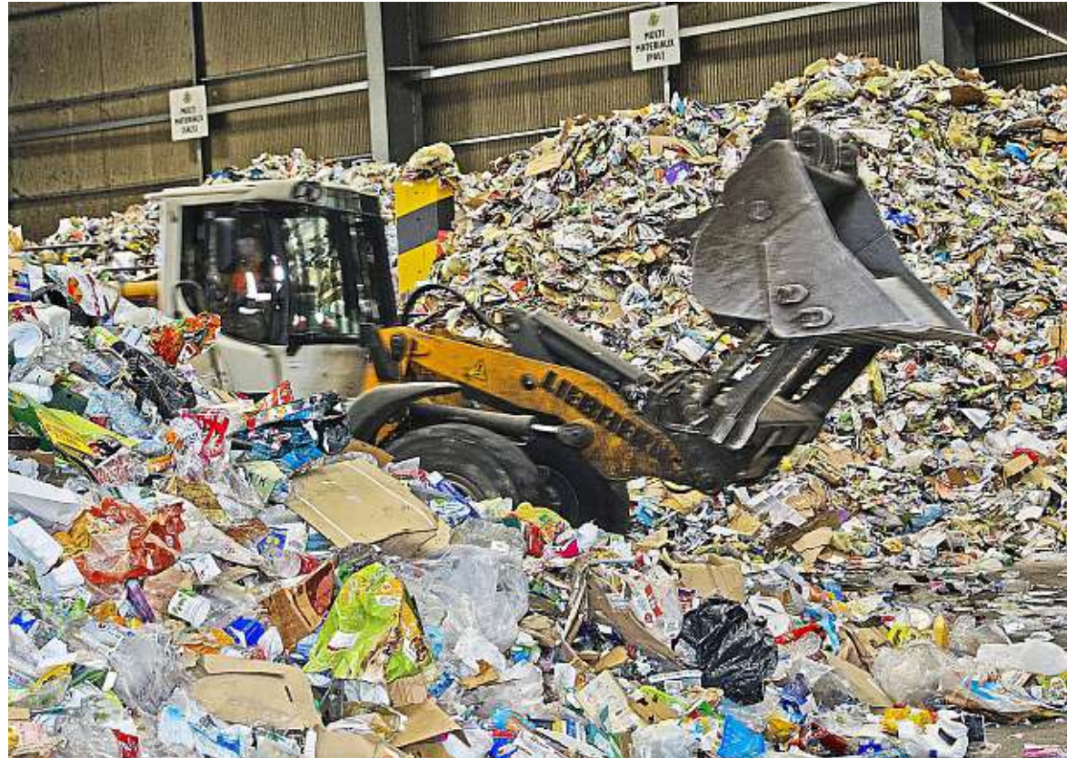
L'autrice estime que ces mécanismes, comme la filière REP emballages ménagers, permettent aux entreprises d'éviter des règles plus dures.

Oui, il est devenu une pierre angulaire de toutes les politiques environnementales. Certes, aux côtés d'autres grands principes du droit de l'environnement comme la précaution, la prévention, l'information du public... Mais celui du