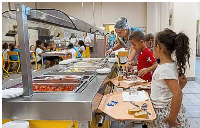
Le coût des repas a augmenté de 5 à 10 % en cette rentrée scolaire, selon l'AMF.

Dans le privé, la hausse est encore plus marquée, de nombreuses collectivités territoriales ne participant pas aux frais de restauration scolaire pour les élèves de ces établissements. « J'ai donc aménagé mon emploi du temps pour faire des allers-retours tous les jours afin de les emmener déjeuner à la maison, qui est à 12 km de leur collège », indique Anne-Sophie, mère de trois collégiens. Suleya, maman de deux garçons, a décidé, de son côté, de limiter les jours de cantine : « Je paie déjà 240 € par mois pour leur scolarisation, auxquels j'ajoute 192 €, juste pour deux jours de cantine par semaine. » Des familles dont les enfants sont scolarisés dans le public ont, elles aussi, décidé de ne