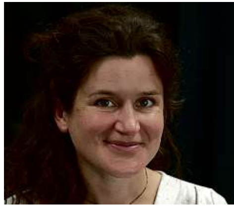
E. Scadsky / Sipa