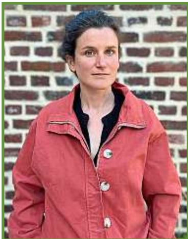
Flore Berlingen est l'ex-présidente de l'ONG Zero Waste. F. Berlingen

Globalement, ce principe repose sur trop de présupposés. Le premier est qu'on puisse donner un prix à ce qui est inestimable : la valeur d'un site naturel, d'une espèce protégée. Le pollueur-payeur pose la question du « comment on va prendre en charge ? » et « pour quel prix ? », sans poser celle du « pourquoi ? ». C'est celle-ci qu'il faut replacer au centre du débat. Autrement dit : quelles sont les pollutions que l'on consent à laisser dans une société car elles répondent à des besoins qu'on estime fondamentaux ?