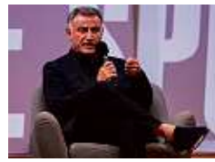
S. Durat / Sipa