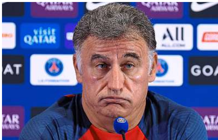
Sa communication franche et décontractée ne lui suffit pas à éviter les polémiques.