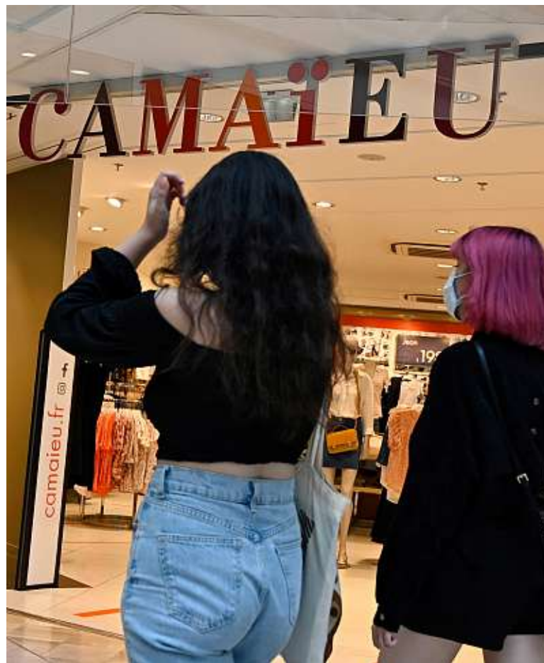
Les jeunes ont tourné le dos au moyen de gamme, au profit, notamment, de l'occasion.