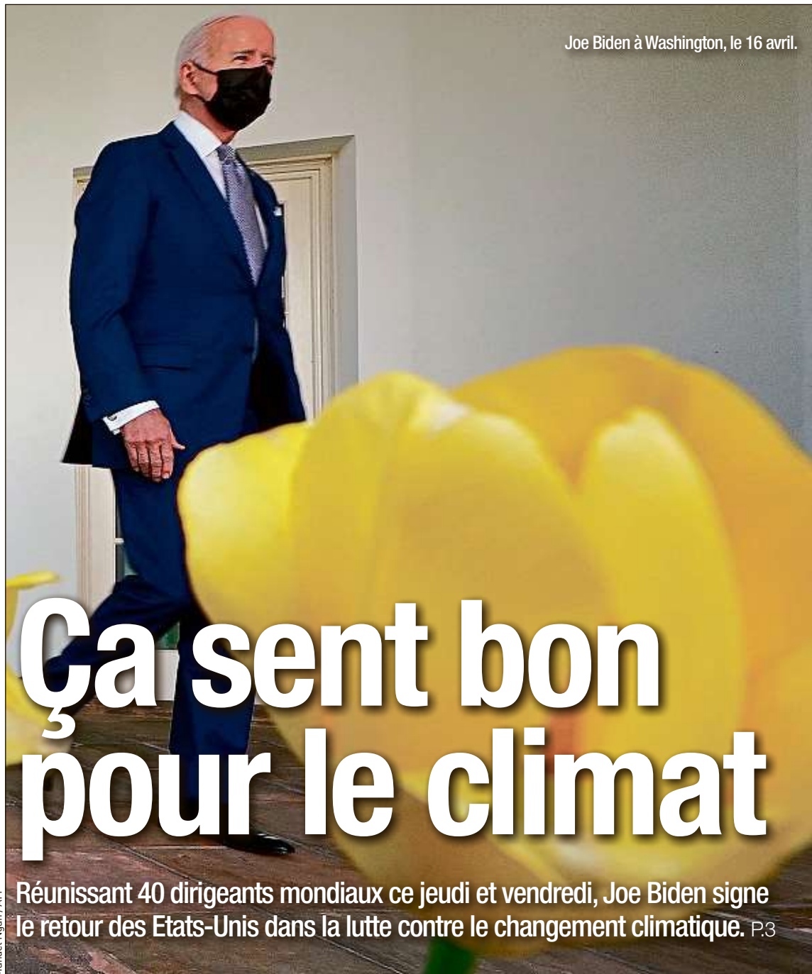
Joe Biden à Washington, le 16 avril.

Le football sort-il vainqueur du fiasco de la Superligue ? P.12