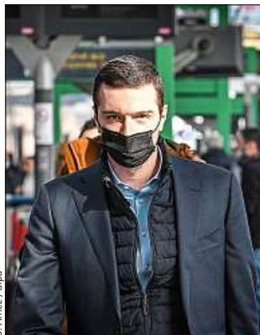
Jordan Bardella (RN) a fait de la sécurité sa «priorité».