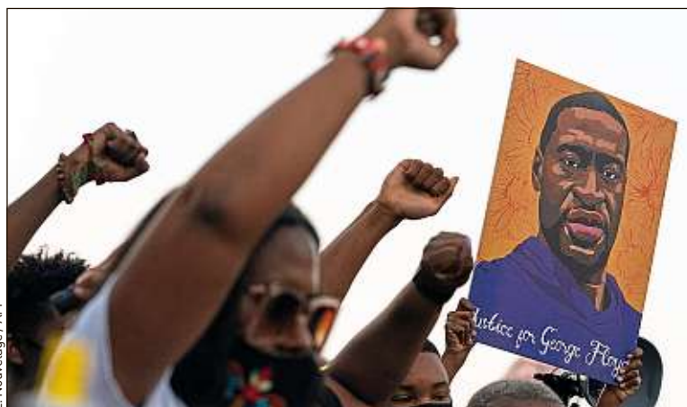
La foule (ici à Atlanta) a laissé éclater sa joie à l'issue du verdict, mardi.