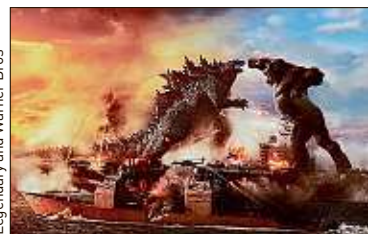
Legendary and Warner Bros

La condamnation du policier « ne règle pas le problème » P.4