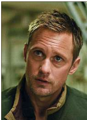
Warner Bros France

Instagram (Facebook) permet, depuis mercredi, à ses utilisateurs de filtrer les messages reçus sur la plateforme pour les expurger des expressions injurieuses. Un nouveau pas pour le réseau social, qui veut donner des gages dans la lutte contre le harcèlement en ligne.