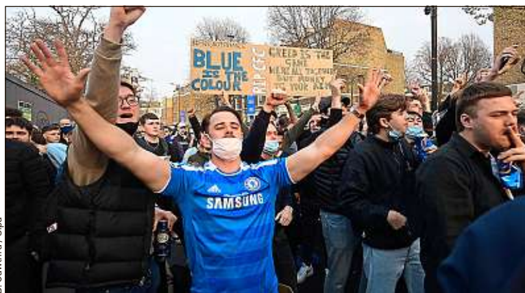
Les supporters de Chelsea se sont mobilisés devant Stamford Bridge.

« C'est l'argent qui a triomphé » Car Aleksander Ceferin, le président de l'UEFA, a beau être monté à la tribune mardi, avec des trémolos dans la voix, pour dénoncer « l'égoïsme », ainsi que l'argent qui « est devenu plus important que la gloire », on a du mal à réprimer un rictus. Car, il y a 72 heures à peine, l'UEFA et la Fifa étaient encore les grands méchants loups aux yeux des fans du continent. Ils ne devraient d'ailleurs pas tarder à le redevenir une fois cette Superligue enterrée. « Tout le monde pense qu'on vient de remporter une victoire sur le football de l'argent, alors qu'en vérité, c'est lui qui a