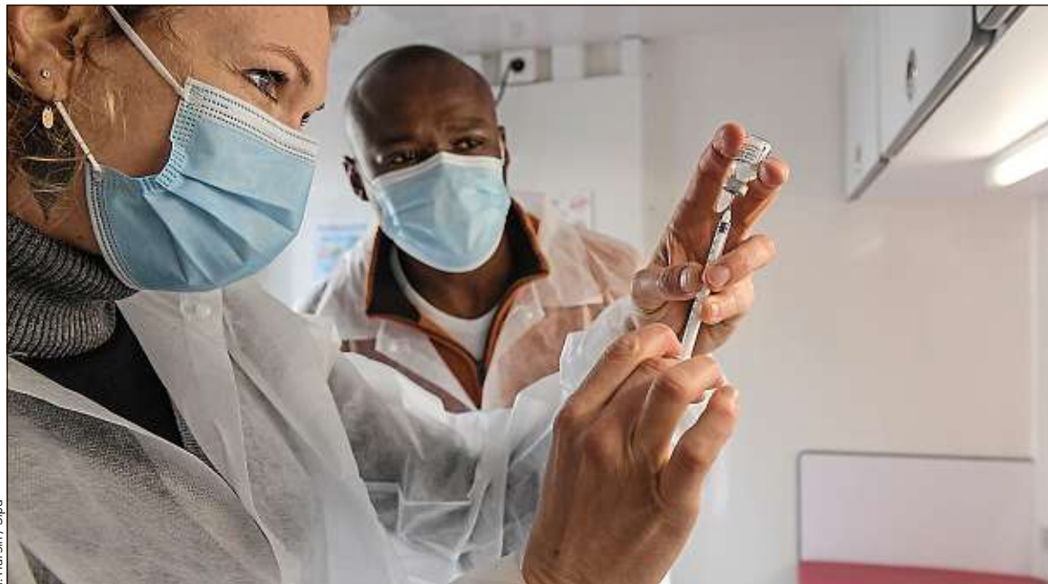
Aujourd'hui, tout le monde ou presque veut se faire vacciner avec du Pfizer ou du Moderna, aux prouesses implacables.

La clé d'un quotidien sans Covid-19, les autorités sanitaires le martèlent, c'est la vaccination, dont l'ouverture généralisée aux plus de 18 ans est prévue cet été. Mais avec quels vaccins et pour quelle efficacité ? Les risques de thrombose associés aux vaccins AstraZeneca et Janssen ont refroidi une partie des populations éligibles à la vaccination, qui aujourd'hui boudent ces sérums. Dans cette tempête virale, le « vaisseau ARN messenger » lui, ne tangué pas. Et, maintenant, tout le monde ou presque veut se faire vacciner avec du Pfizer ou du Moderna, aux prouesses implacables.