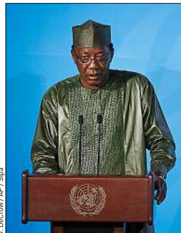
Le président du Tchad est mort des suites de blessures reçues au combat.

Tchad La France « perd un ami courageux », a regretté l'Elysée. Le président du Tchad, Idriss Déby Itno (photo), 68 ans, est décédé lundi soir des suites de blessures reçues alors qu'il commandait son armée dans des combats contre des rebelles durant le week-end, a indiqué la présidence du pays. Partenaire-clé des Occidentaux contre les djihadistes au Sahel, où