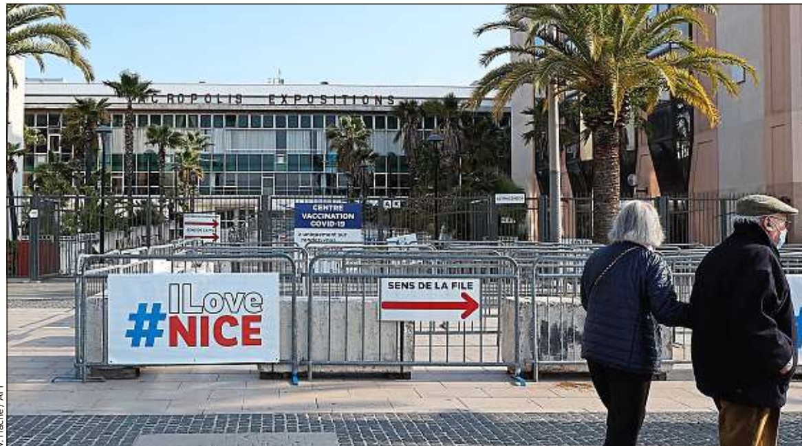
Samedi, le centre de vaccination de Nice a dû fermer, faute de volontaires pour recevoir une dose.

Une vaccination ouverte à tous serait d'autant plus défavorable aux personnes fragiles que ces dernières