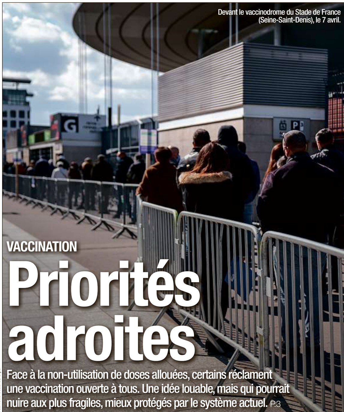
Devant le vaccinodrome du Stade de France (Seine-Saint-Denis), le 7 avril.

Paris prêt à endosser le maillot de sauveur du foot européen? P.12