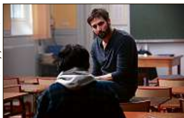
C. Schouboe / Banijay Studios/FTV

Axolot, baroudeur de la curiosité, part pour un tour de France P.11