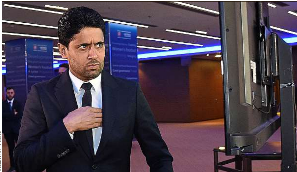
Le président du PSG, Nasser Al-Khelaïfi, est en train de prendre du galon au sein des institutions européennes.