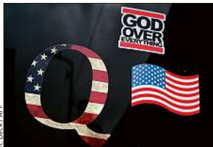
R. Beck / AFP