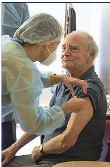
Selon le ministère de la Santé, 100 % des résidents ont reçu une dose.