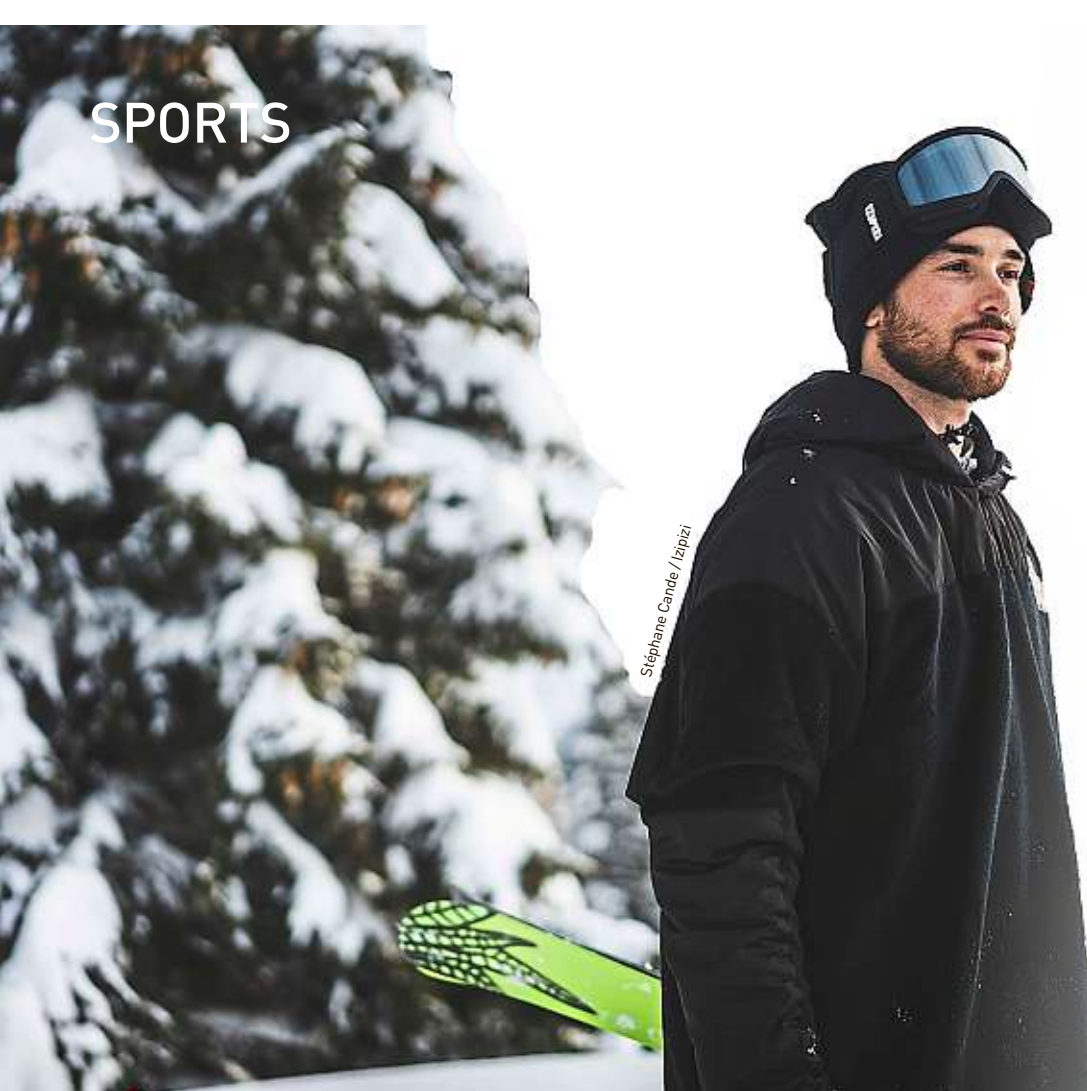
Stéphane Candé / Izipizi