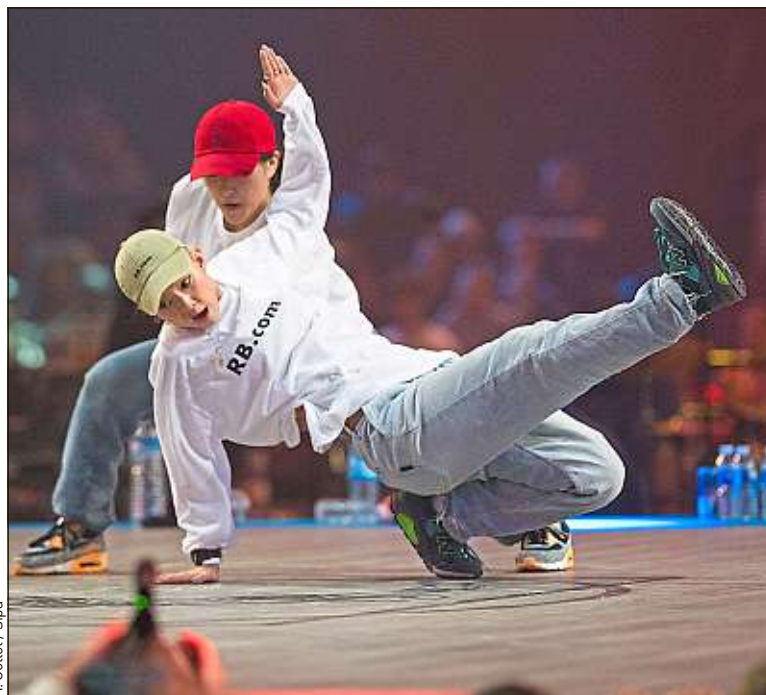
H. Collot / Sipa