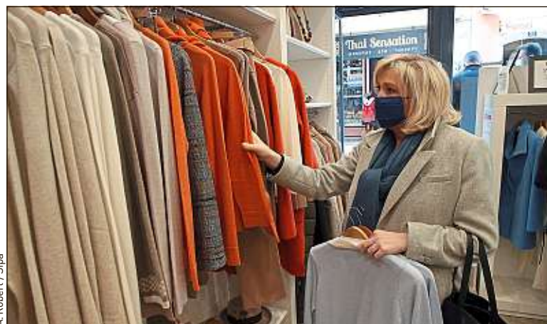
La candidate RN lors d'un déplacement au Portugal, le 9 janvier.