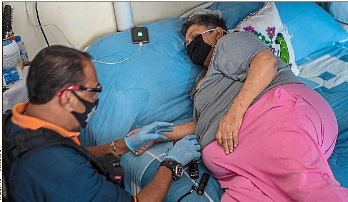
Environ « 80 % des personnes en réanimation ont des problèmes de surpoids », explique la présidente du CNAO.