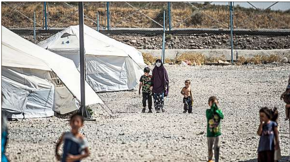
Au camp de Roj, en Syrie, où sont retenus des enfants français de djihadistes, en septembre.