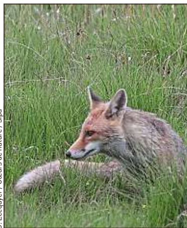
En France, 17,6% des espèces de la faune et de la flore sont menacées.

Le rapport pointe « l'aménagement du territoire, qui reste incontrôlé, et l'intensification des pratiques agricoles ». Pour Muriel Arnal, présidente de l'association de protection des animaux One Voice : « Le cycle de vie est totalement perturbé par les activités humaines, et on ne laisse jamais la nature se réparer ou être tranquille. » Le rapport alerte d'autant plus que la situation d'espèces censées être protégées empire. « Nous parlons de celles qui bénéficient le plus d'efforts de conservation, les vertébrés, et pas des insectes ou des mollusques », note le rapport, qui évoque une source d'espoir : « L'opinion en train d'évoluer » sur cette question. Jean-Loup Delmas