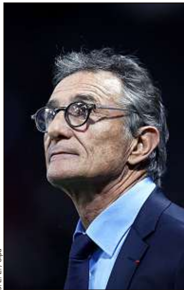
A 67 ans, Novès profite de sa retraite.

Aujourd'hui, l'ex-entraîneur à succès du Stade Toulousain, âgé de 67 ans, revient dans la lumière avec son autobiographie, La Tête haute (éd. Hugo Sport), publiée ce jeudi. Sa tournée médiatique l'éloigne pour un temps du quotidien paisible dans son refuge de Pibrac, en Haute-Garonne. « Je fais du vélo tous les jours, plutôt du vélo d'appartement actuellement, mais aussi de la gymnastique, confie-t-il. Je suis très disponible pour mes enfants et mes petits-enfants. »