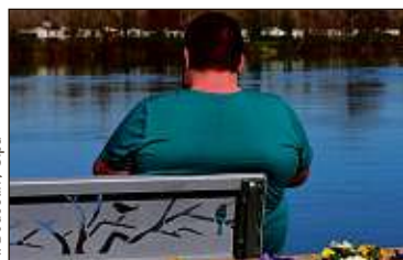
R. Douceim / Sipa