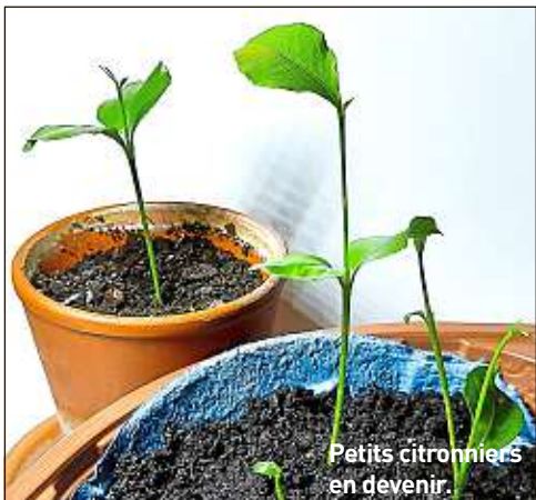
Petits citronniers en devenir.