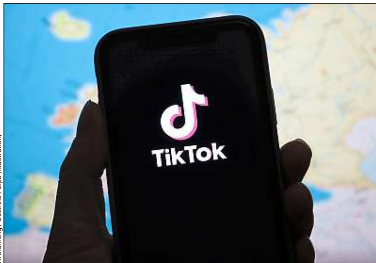
Le tiktokeur YoFunders inaugure la série « Le Milli » pour 20 Minutes .