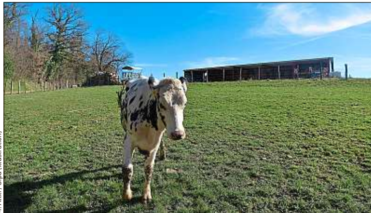
Les animaux abattus à la ferme ne quittent jamais leur environnement.