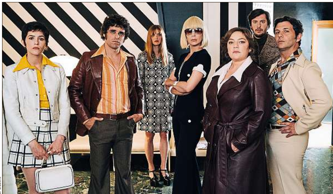
La troisième saison des Petits Meurtres d'Agatha Christie , qui sort ce vendredi, se déroule dans les années 1970.

Les années 1970 portent les germes de notre monde, qu'une nouvelle génération cherche à comprendre : « C'est une époque où l'on découvrait plein de choses nouvelles, qui ont depuis été un peu corrigées », considère Thylacine, le compositeur de la BO d' Ovni(s) . Carburer à la nostalgie n'est donc pas la seule raison de cet engouement pour les années 1970. « Une série d'époque