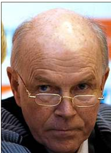
Anders Besseberg est visé.