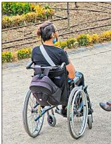
Une pétition pour revoir le mode de calcul de l'AAH fait bouger les lignes.

Pour les partisans de la réforme, il reste à convaincre le gouvernement, qui considère que des dispositions spécifiques suffisent déjà à assurer un niveau de vie décent aux personnes handicapées. Nicolas Raffin