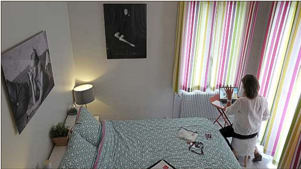
Les factures de chauffage et d'électricité des salariés augmentent avec la démocratisation du télétravail.