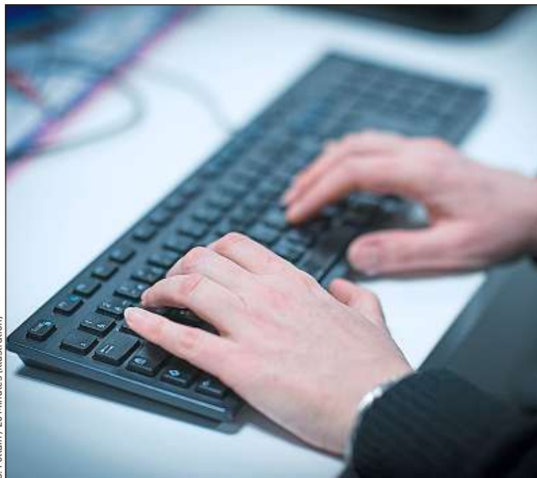
C. Follain / 20 Minutes (illustration)

Des utilisateurs de TikTok l'ont montré en juin à l'occasion d'un meeting de Donald Trump. Des adolescents fans de K-pop ont affirmé avoir saboté la réunion publique en réservant des milliers de places du BOK Center pour détourner en ligne le système d'inscription. « Des milliers d'internautes se sont coordonnés pour induire en erreur l'équipe de campagne du président américain, raconte Tristan Mendès France, maître de conférences associé à l'université Paris-Diderot. C'était un coup de force assez spectaculaire. » D'autres procédés existent. Début octobre, la communauté LGBT a détourné