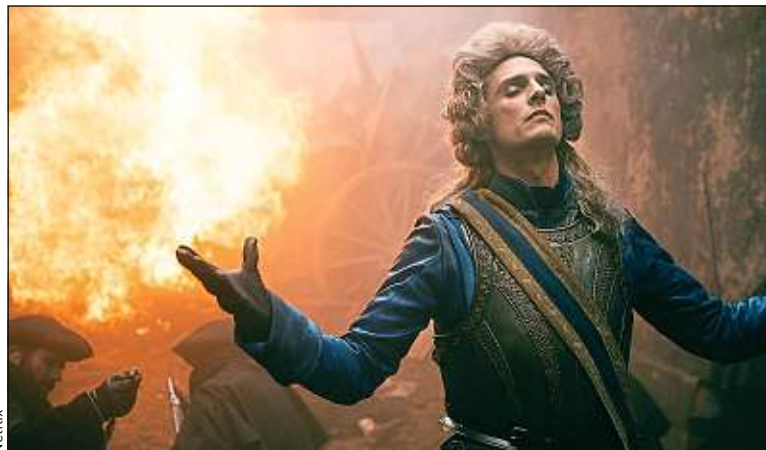
La Révolution française comme vous ne l'avez jamais entendue à l'école.

Les huit épisodes proposent une relecture de la Révolution française comme vous ne l'auriez jamais imaginée sur les bancs de l'école. Et si la prise de la Bastille avait été causée par une épidémie, portant le nom de « sang bleu », ayant contaminé la noblesse et poussé