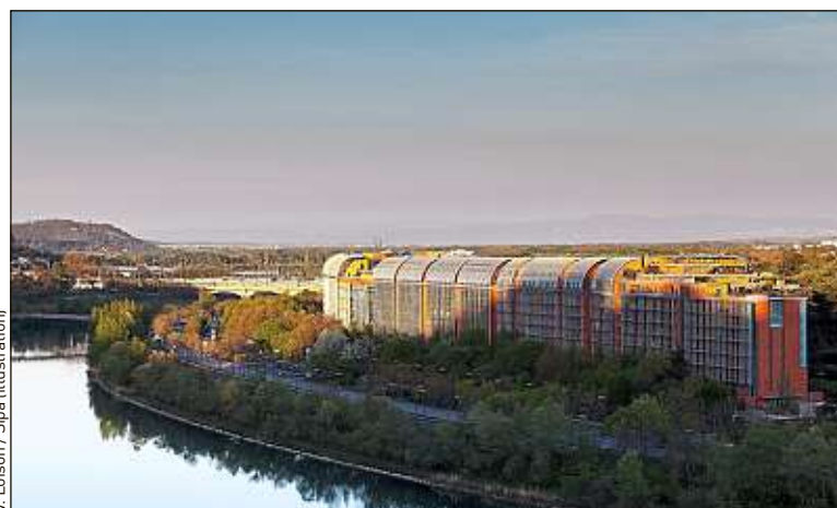
Le corps a été découvert près de la Cité internationale, au bord du Rhône.