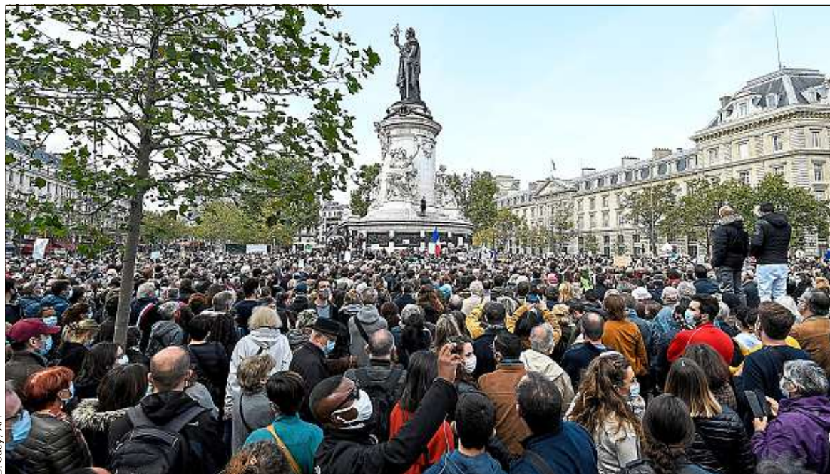
De nombreux manifestants présents dimanche, place de la République, craignent une «fracture» en France.