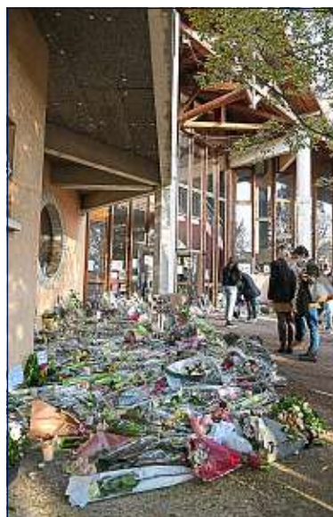
Samedi, devant le collège où Samuel Paty enseignait, dans les Yvelines.