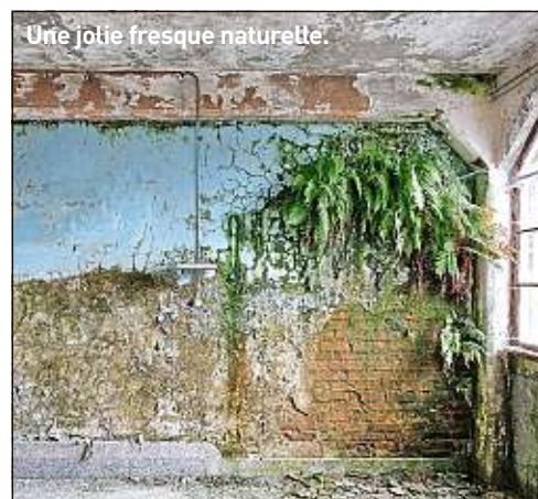
Une jolie fresque naturelle.