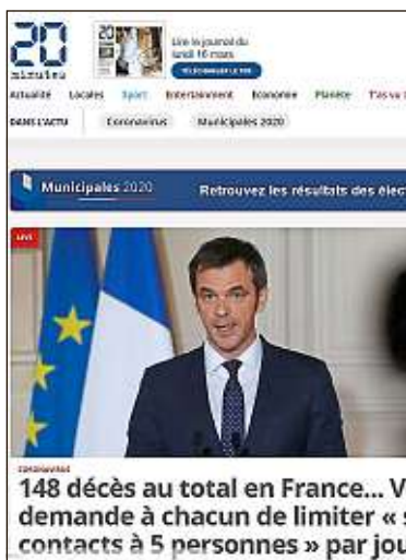
Le site d'info de 20 Minutes.

Elle était une immense star de la chanson et du cinéma dans les années 1950 et 1960. L'actrice, chanteuse et danseuse Suzy Delair est décédée dimanche à l'âge de 102 ans. Elle a marqué l'histoire du cinéma pour ses rôles de Mila Malou dans L'Assassin habite au 21 , et de Jenny Lamour dans Quai des Orfèvres , deux films réalisés par son compagnon, Henri-Georges Clouzot. Elle était la doyenne des actrices françaises.