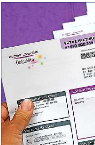
Loyers et factures sont suspendues pour les PME en difficulté.