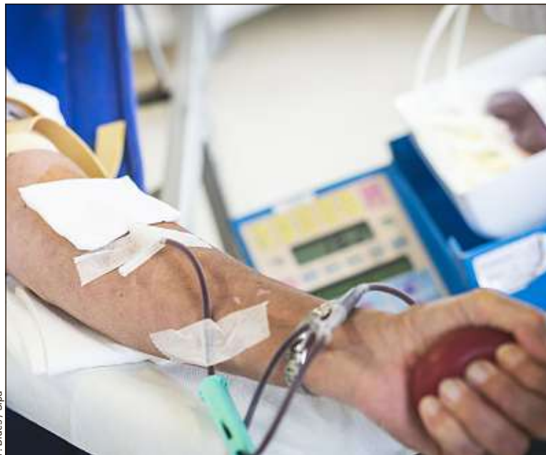
Près d'un jeune sur deux a déjà donné son sang.