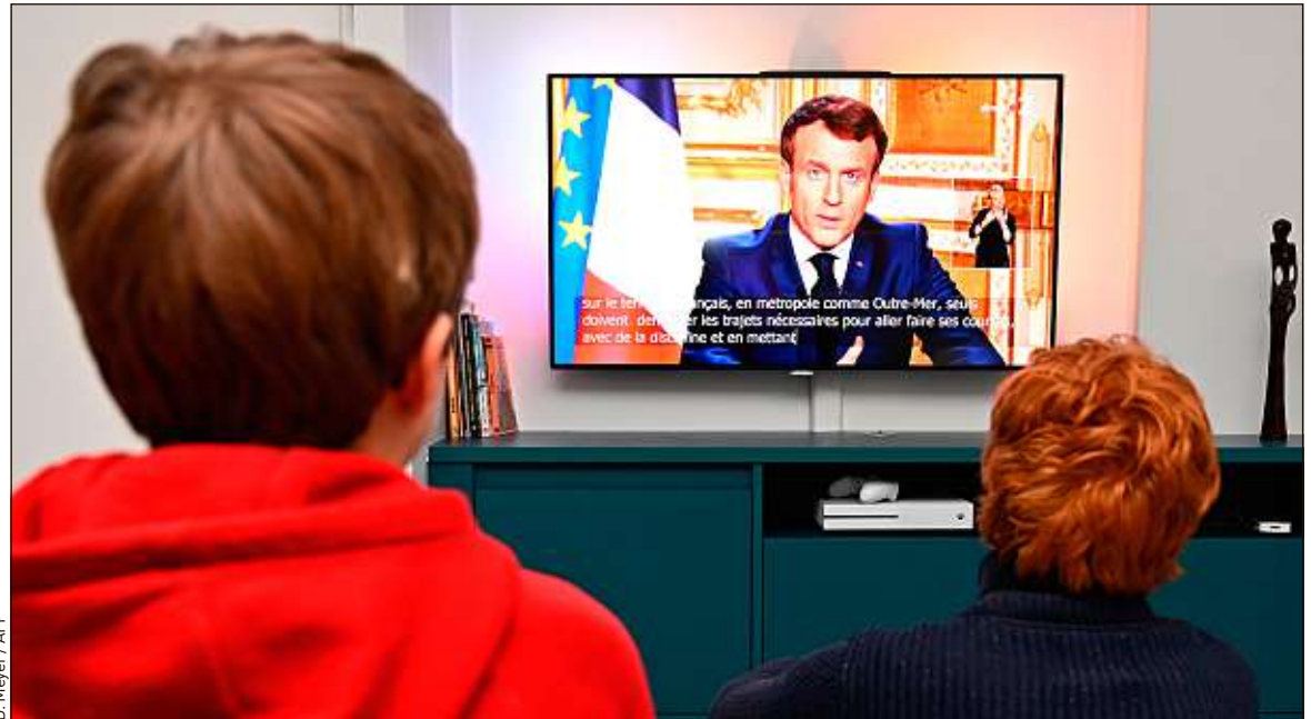
Emmanuel Macron a également annoncé le report du second tour des élections municipales.

pas respecté la consigne de samedi, comme si au fond la vie n'avait pas changé », a déploré le chef de l'Etat. « Non seulement vous ne vous protégez pas vous, mais vous ne protégez pas les autres », a-t-il sermonné. Il en a donc tiré des conclusions, et après avoir consulté le Conseil scientifique installé depuis le début de la crise, le chef de l'Etat a imposé de