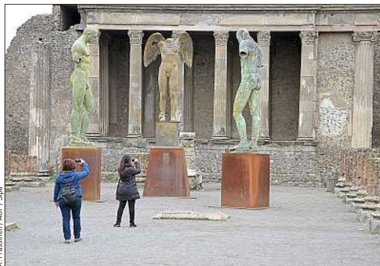
Le site de Pompéi, en Italie, peut désormais se visiter virtuellement.

de Naples. Avec, en prime, une vidéo faisant revivre les différentes étapes d'une opération de restauration. Le site d'Herculanium, également près de Naples, publie tous les mercredis sur les réseaux sociaux des images et vidéos promouvant ses plus belles œuvres. Quant au site de Paestum, il a eu l'idée originale d'utiliser des objets de ses collections pour sensibiliser la population à la lutte contre le coronavirus, comme une amphore pour se souvenir de se laver les mains.