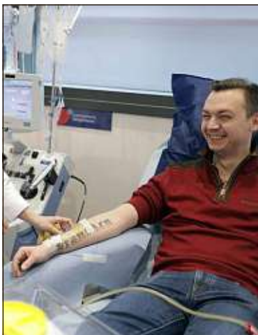
Les hommes jeunes sont recherchés pour le don de moelle osseuse.

Si vous avez entre 18 et 30 ans, vous pouvez participer au projet « #MoiJeune », une série d'enquêtes lancée par 20 Minutes avec OpinionWay en vous inscrivant sur MoiJeune.com .