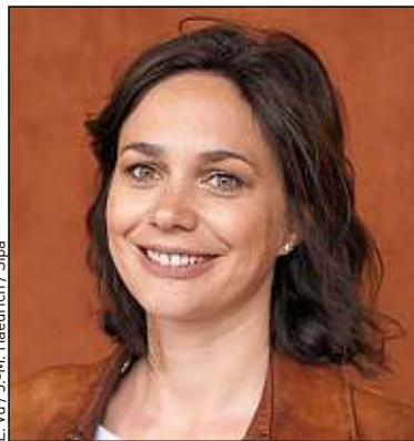
Nathalie Péchalat est la nouvelle présidente de la fédération.