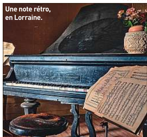
Une note rétro, en Lorraine.