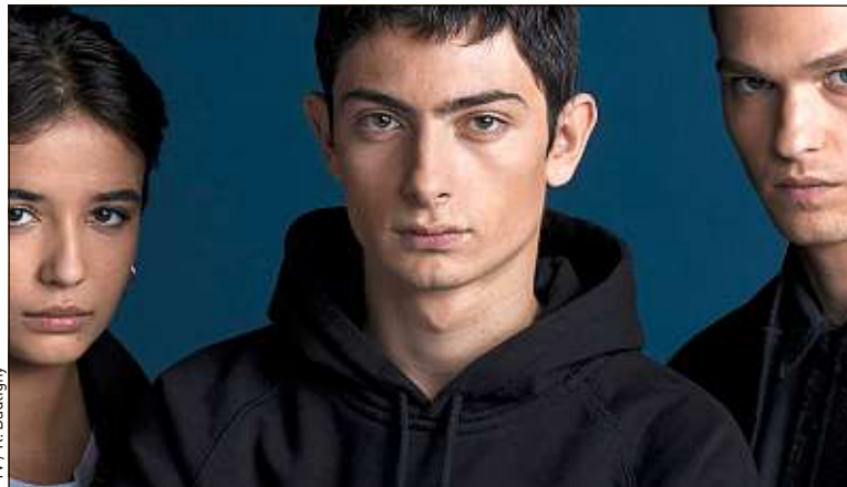
L'acteur Théo Fernandez, au centre, va épier et traquer ses camarades.

Comme son titre l'indique, il y est question de stalking, du verbe to stalk (traquer), pratique de harcèlement, punie par la loi, qui a changé