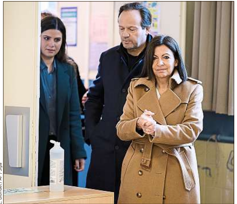
Anne Hidalgo a obtenu près de 31 % des voix, loin devant Rachida Dati.

fr.linkedin.com/ company/20-minutes www.pinterest.fr/20minutes vingt.minutes sur Snapchat Et retrouvez vos infos locales sur WhatsApp