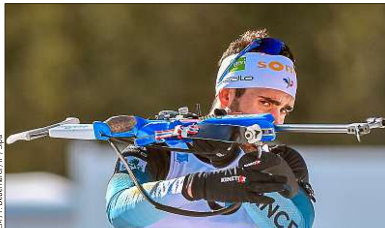
Notre Martin national semble avoir pas mal de projets en ligne de mire.

► S'investir davantage dans Paris 2024. Au sortir des JO de Pyeongchang 2018, où avaient germé les premières rumeurs d'une retraite après deux ans de rab sur les skis, Martin Fourcade enfilait pour la première fois son nouveau costume de président de la commission des athlètes de Paris 2024. Sous sa coupe, on retrouve des grands noms comme Stéphane Diagana ou Guillaume Gille. La commission a vocation à faire entendre la voix des athlètes dans l'organisation des JO 2024. « C'est vraiment cool de savoir qu'il sera encore plus présent pour nous, se satisfait-on au