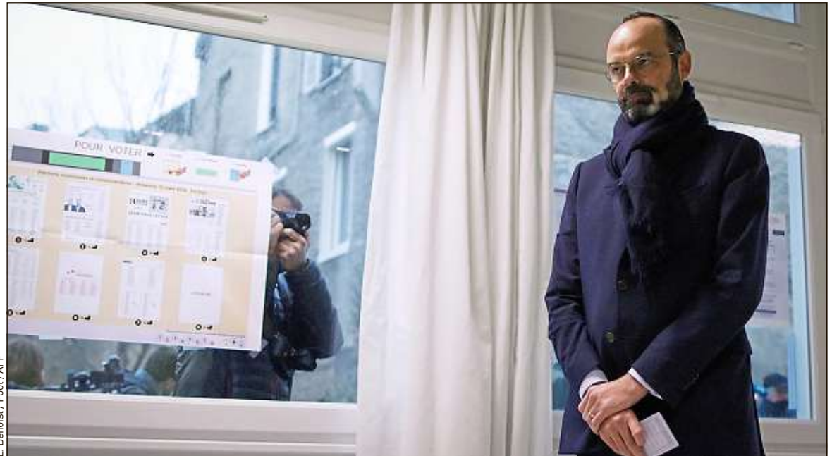
Le Premier ministre, Edouard Philippe, dans un bureau de vote du Havre (Seine-Maritime), dimanche

« Un jour, le bilan devra être tiré des décisions prises par le président, et de celles qui n'ont pas été prises », a prévenu Marine Le Pen. Evoquant « une guerre sanitaire », la présidente du Rassemblement national a appelé au report du second tour, prévu dimanche prochain. Une demande également faite par de nombreux membres de l'opposition, du chef des députés LR,