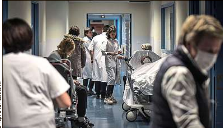
Certains médecins et infirmiers redoutent une saturation de leurs services.

Virginie et son conjoint, tous deux infirmiers, peinent à entrevoir une solution pour les jours à venir : « Nous avons deux enfants âgés de 10 et 12 ans. Nous ne pouvons pas solliciter les grands-parents, car nos enfants sont