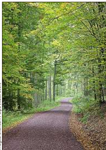
La tentative d'assassinat a eu lieu dans la forêt de Bondy, en août 2017.