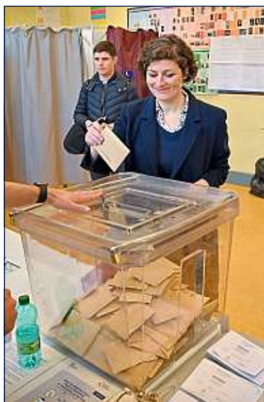
La candidate EELV à Strasbourg, Jeanne Barseghian, est en tête.