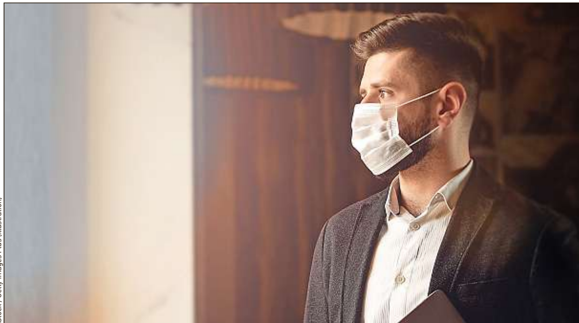
Certaines personnes jugées à risque ou contaminées doivent rester chez elles pour limiter les cas de contagion.

20 minutes avec vous avec une personne infectée ou qu'ils habitent dans un foyer de contamination. Une expérience dure à vivre psychologiquement pour beaucoup, comme le raconte Mouloud, un habitant de Creil (Oise), l'un des foyers du coronavirus, qui est confiné depuis le 2 mars : «Mes collègues m'appellent et prennent de mes nouvelles, mais ce sentiment d'être