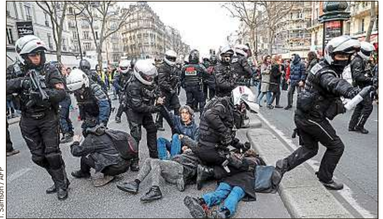
Le 29 janvier à Paris, lors d'une manifestation contre la réforme des retraites.

A partir du début des années 2000. Des forces spécialisées ont été créées à cette époque : des équipes d'interpellation, avec comme objectif la judiciarisation et la condamnation de manifestants. Quand on regarde la communication politique actuelle, on constate qu'elle se focalise uniquement sur les chiffres des personnes interpellées, jugées ou condamnées, comme si c'était la preuve d'un bon maintien de l'ordre.