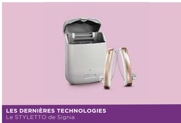
LES DERNIÈRES TECHNOLOGIES Le STYLETTO de Signia