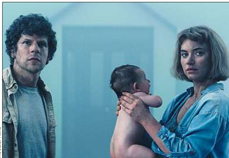
Les héros de Vivarium sont interprétés par Jesse Eisenberg et Imogen Poots.

Cette comédie grinçante, découverte à la Semaine de la critique du Festival de Cannes avant d'être présentée au festival de Gérardmer, fait partager le cauchemar de jeunes gens ordinaires. « C'est un conte à la fois surréaliste et