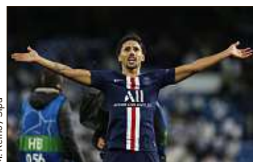
M. Rejno / Sipa

« La Bonne Epouse » aborde joyeusement le féminisme P.16