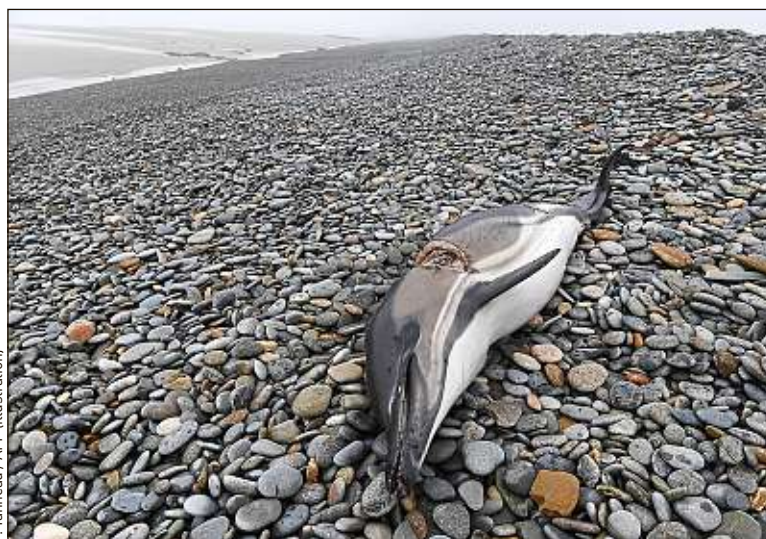
Depuis 2002, 29 dauphins ont été mutilés dans le sud-est des Etats-Unis.

Sur le site de la National Oceanic and Atmosphere Administration (NOAA), on peut voir une photo du dauphin avec une large entaille au niveau de son bec. La même semaine, un autre dauphin est retrouvé, mort d'un impact de balle. Depuis 2002, 29 dauphins ont été trouvés tués par balle, flèche ou empalés sur les côtes du sud-est des Etats-Unis. Selon la loi, la chasse, la maltraitance ou le fait de nourrir des dauphins est passible d'un an de prison et 100 000 $ (88 440 €) d'amende. Maureen Songne