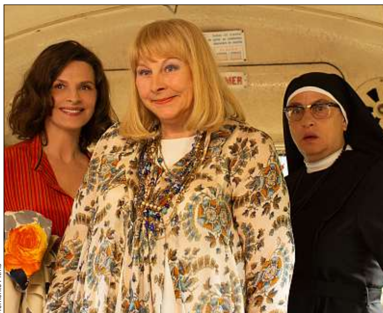
Juliette Binoche, Yolande Moreau et Noémie Lvovsky tiennent des rôles en or.

Coincée jusqu'aux boutons de ses tailleurs, la directrice qu'incarne Juliette Binoche voit son horizon s'élargir à la mort subite de son époux (François Berléand en beauf aux petits oignons). « Elle croit aux valeurs de soumission féminine qu'elle enseigne dans son école, explique Martin Provost. Tout