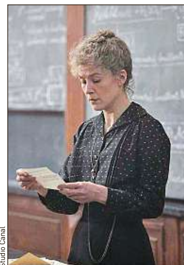
Rosamund Pike incarne la savante dans le dernier film de Satrapi.