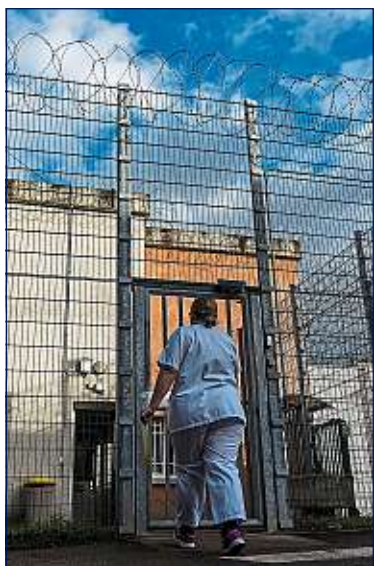
Le centre pénitentiaire de La Talaudière (Loire).