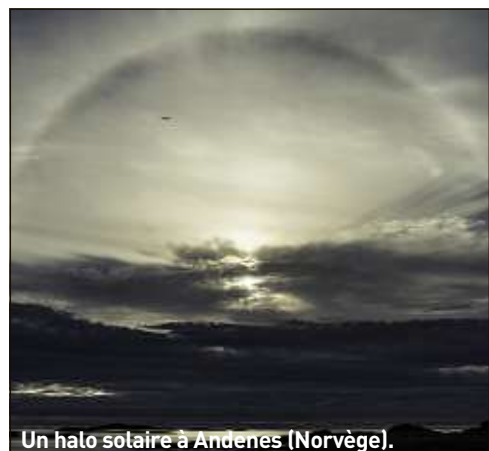
Un halo solaire à Andenes (Norvège).

Vos photos ne seront destinées qu'à cette rubrique. Pour en savoir plus sur la gestion de vos données : https://www.20minutes.fr/politique-protection-donnees-personnelles