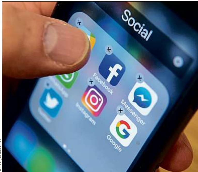
Les réseaux permettent d'élargir les audiences des aspirants maires.