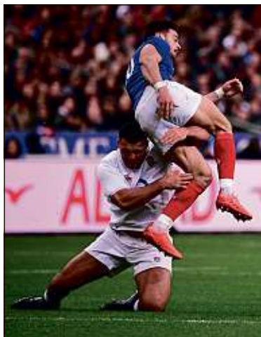
Le Français Romain Ntamack au contact avec l'Anglais Ellis Genge.

Tenant du titre, Rennes avance en favori sur le terrain de Saint-Etienne, en demi-finale de Coupe de France, ce jeudi (20h55). Pour autant, le coach des Rouge et Noir, Julien Stéphan, se méfie. «Le classement en Ligue 1 n'aura pas d'incidence, c'est une autre compétition. Il faudra être au top, top, top», martèle-t-il. Avant de rappeler un bon souvenir à son groupe : «Se qualifier pour une finale à l'extérieur, on l'a déjà fait.» C'était l'an passé, à Lyon (2-3).