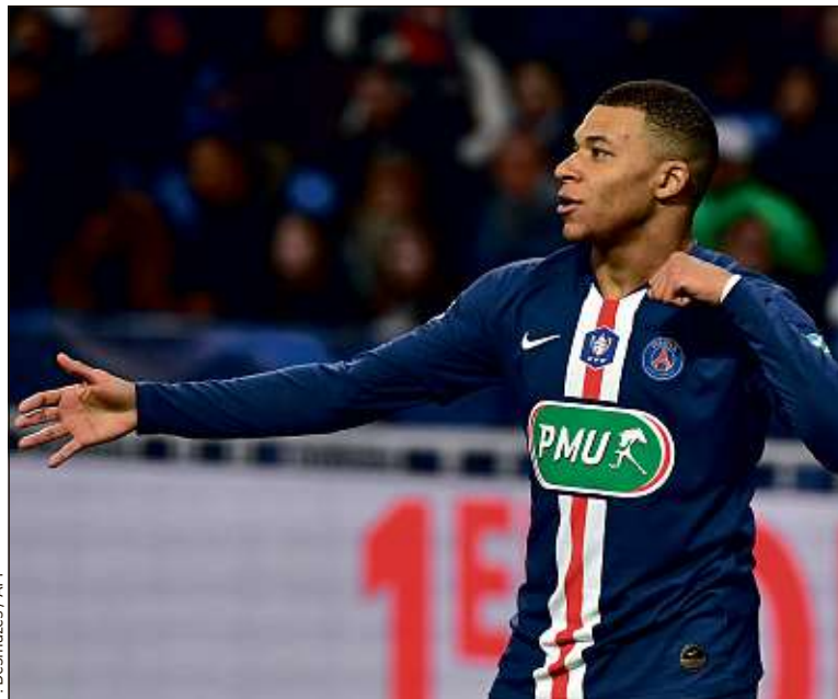
Kylian Mbappé s'est distingué avec un but inscrit en partant de son camp.

On avait eu un premier aperçu contre la Juventus et l'ASSE. C'est désormais confirmé : l'OL actuel est métamorphosé et n'a plus rien à voir avec l'équipe moribonde des derniers mois. Au cours d'une splendide 1 re période, où les deux équipes se sont rendu coup pour coup, les Gones ont tenu la dragée haute aux Parisiens. Ce sont même eux qui ont frappé les premiers, avec un plat du pied de Terrier (1-0), après une belle passe en retrait de Toko Ekambi. Et même après l'égalisation de Mbappé (1-1), les Lyonnais auraient pu reprendre l'avantage grâce au même Terrier, qui s'est ouvert le chemin du but, mais a buté sur Navas.