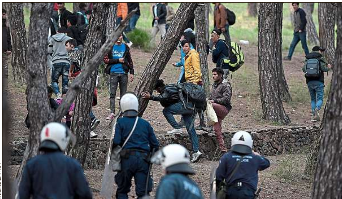
Des migrants fuient la police, sur l'île de Lesbos, mardi, alors qu'ils espéraient prendre un ferry pour Athènes.

Elle a incité un nombre massif de réfugiés et de migrants à essayer de se rendre en Grèce au niveau de la région d'Evros, dans le nord du pays. Les policiers et les militaires grecs se sont rassemblés aux frontières et ont fait usage de gaz lacrymogènes. Il y a eu des tensions pendant trois jours. [Mercredi, la Turquie a affirmé qu'un migrant a été tué par des tirs grecs, ce qu'a démenti la Grèce, selon l'AFP]. La police et l'armée ont déclaré avoir empêché