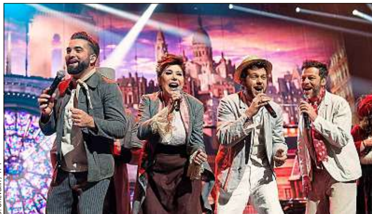
Kendji Girac, Liane Foly, Claudio Capéo et Christophe Maé en janvier à Paris.

Bien sûr. Cela a été un tel bouleversement pour la France. On essaie toujours de trouver des entrées fortes. On s'est dit que ce serait une merveilleuse occasion de rendre hommage à Notre-Dame, la