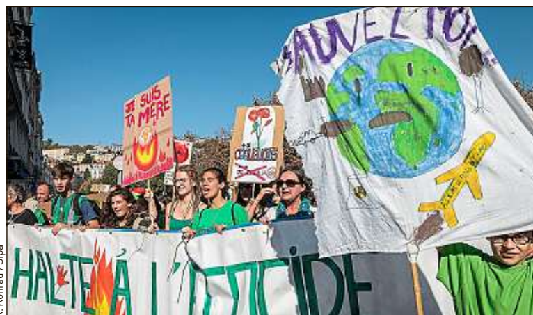
L'indicateur se focalise sur les émissions françaises.

Les ONG de l'Affaire du siècle ont donc mis en perspective ce budget à ne plus dépasser en 2050 avec une estimation des émissions de gaz à effet de serre