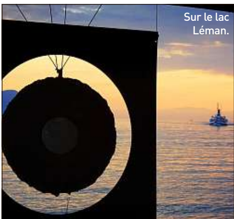
Sur le lac Léman.