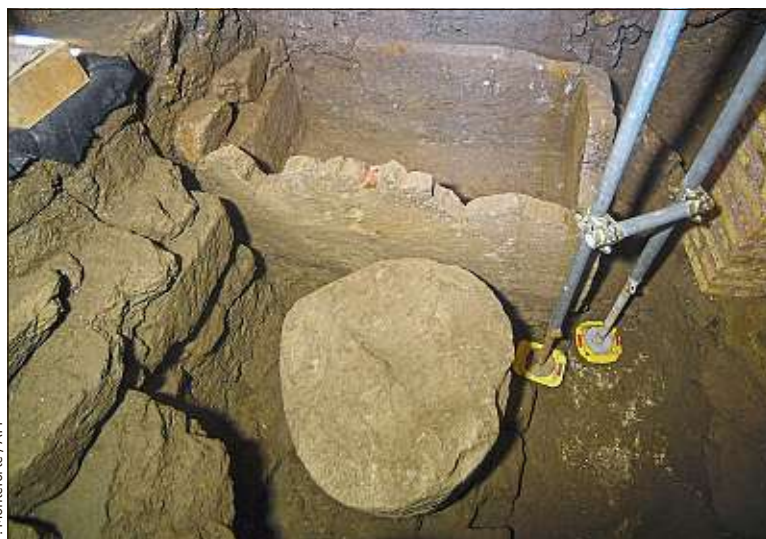
Ce qui pourrait être le tombeau de Romulus a été présenté vendredi.

Des fouilles récentes, effectuées par le Parc archéologique du Colisée, ont permis de confirmer cette hypothèse en remettant au jour « un sarcophage de tuf d'environ 1,40 m de long, associé à un élément circulaire, probablement un autel », les deux éléments remontant au VI e siècle avant J.-C. Les responsables du Parc archéologique ont cependant tenu à préciser qu'il était impossible « d'affirmer scientifiquement » qu'il s'agit bien du tombeau de Romulus.