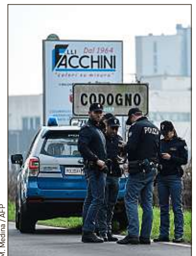
Onze communes du nord de l'Italie sont fermées depuis samedi.