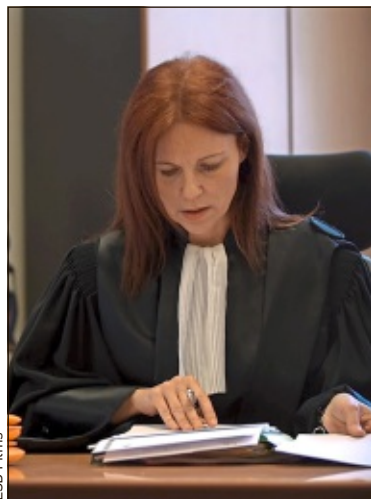
« La Séparation, les Enfants d'abord » sera diffusé mardi soir sur France 5.