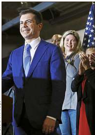
Pete Buttigieg, ici samedi à Las Vegas, peine à séduire les minorités.

« Intelligent », « éloquent », « humble », « rassembleur ». Chez ses soutiens, venus vendredi soir, la veille du vote,