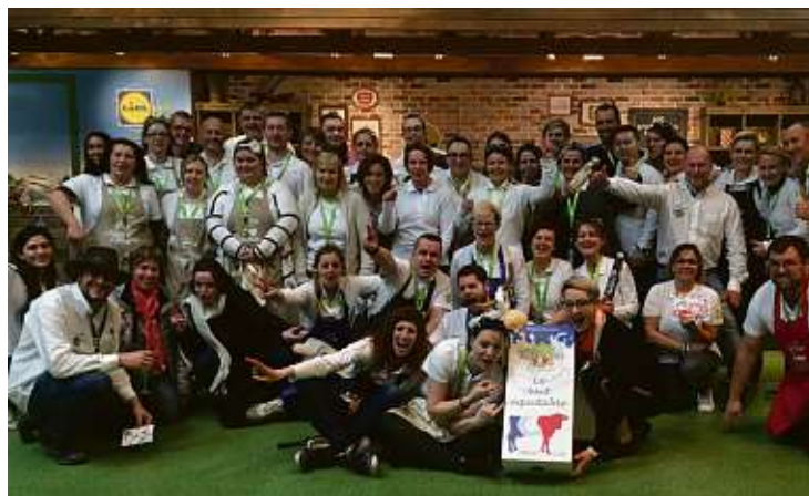
Retrouvez les agriculteurs FaireFrance sur leur stand (Pavillon 1, place N054). Une occasion idéale de déguster leurs produits ! Les 24, 25 février et le 1er mars, FaireFrance sera également présent sur le stand Lidl (Pavillon 1, place F094)

Depuis 2015, les produits FaireFrance sont distribués dans près de 1 500 points de vente et leur a permis de pouvoir participer au Salon International de l'Agriculture. Chaque année depuis cette date, FaireFrance propose des animations sur le stand de Lidl. Grâce à Lidl, FaireFrance dispose depuis 2018 de son propre stand.