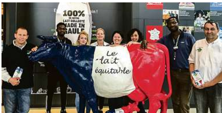
Au programme : dégustation de lait équitable FaireFrance demi-écrémé, rencontres et échanges avec les agriculteurs FaireFrance, recettes à base de lait et crème liquide FaireFrance et de nombreuses autres surprises à découvrir sur place !

Lidl s'est inscrit dans une démarche de transparence, c'est la raison pour laquelle nous avons choisi de proposer à nos clients du lait responsable dans tous nos supermarchés en France. Aujourd'hui c'est une fierté de proposer du lait FaireFrance dans 600 de nos supermarchés et les clients le plébiscitent ! »