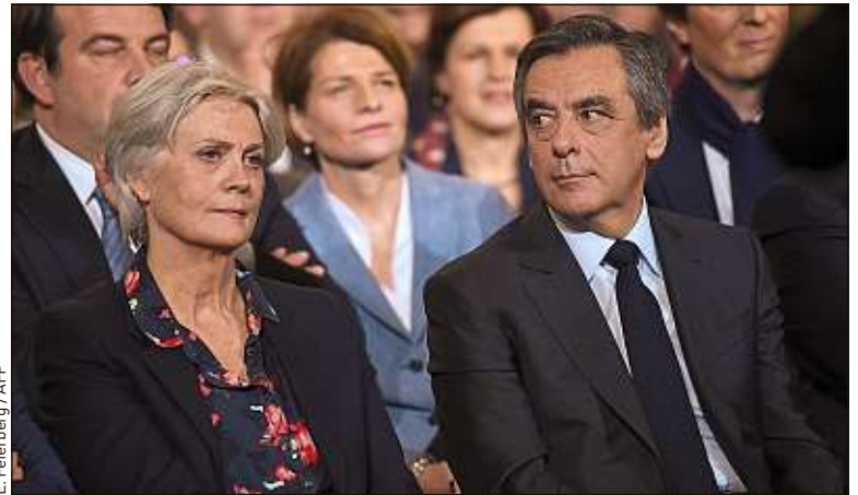
Penelope Fillon et l'ancien Premier ministre, le 29 janvier 2017 à Paris.

L'ancien élu sarthois reconverti dans la finance va, semble-t-il, contester les faits et tenter de démontrer au tribunal que son épouse a bien été « sa première et plus importante collaboratrice ». Sauf que les preuves manquent. Les revues de presse qu'elle préparait ?