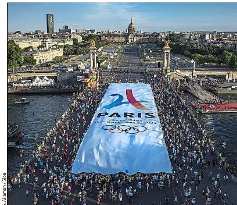
La France insoumise souhaite organiser un référendum sur la tenue des Jeux.

« Paris est doté des plus grands clubs sportifs, des plus grands équipements sportifs, pourtant, il est très compliqué de faire du sport à Paris ou de faire faire du sport à nos enfants, promet dans son programme Rachida Dati, la candidate LR. Je ne parle même pas des plus âgés pour se maintenir en forme. Tout espace qui se libérera à Paris sera un emplacement pour un équipement sportif. » Enfin, du côté d'Agnès Buzyn (LREM), les propositions concernant le sport se concentrent sur quatre axes. « Nous améliorerons la qualité de l'air dans les équipements sportifs et encouragerons le sport écoresponsable », « nous augmenterons les ouvertures de créneaux tôt le matin et tard le soir dans les équipements sportifs de la Ville de Paris », « nous reconvertirons la petite ceinture en un parcours sportif en pratique libre » et « nous ferons du sport un vecteur de lien social au sein des 240 quartiers de Paris ». Lundi prochain, dans le cadre de sa série sur les municipales, 20 Minutes abordera le thème des transports publics.