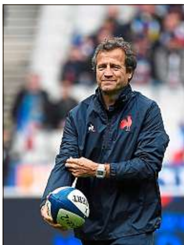
Fabien Galthié, le sélectionneur du XV de France, était heureux.