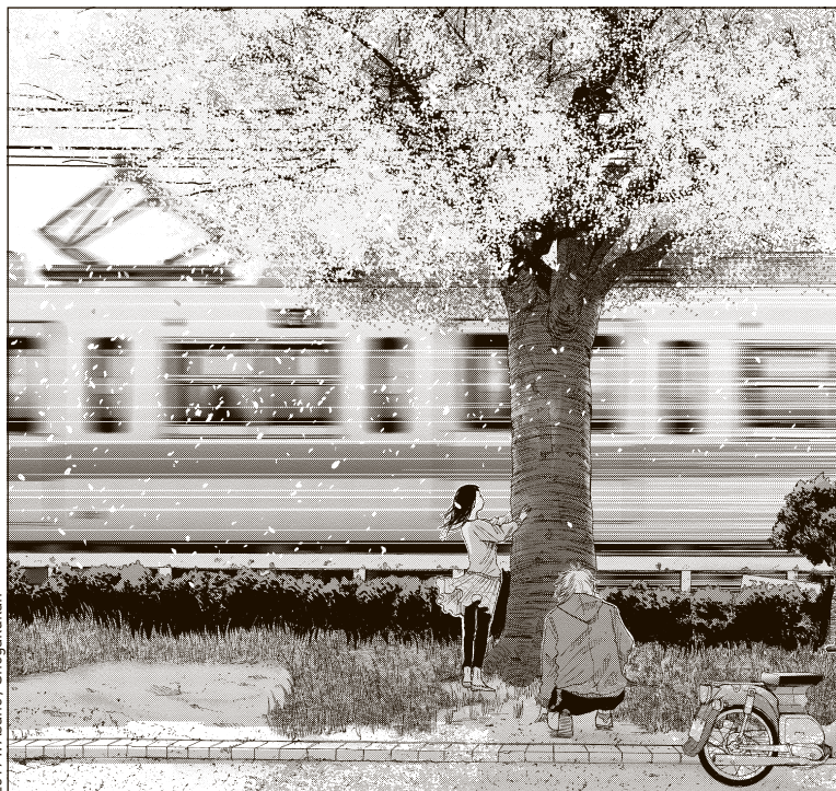
Un monde formidable fait partie des œuvres courtes de l'auteur.

► Bonne nuit Punpun ! « Avant Solanin , je ne me considérais pas encore comme un mangaka à part entière. Après, je me suis rendu compte que, si je voulais en faire mon métier, il fallait que je sois capable de dessiner des séries longues. J'ai alors réfléchi à un thème. Et mon moteur est l'introspection. Punpun est un héros assez pessimiste, voire dépressif. Si je l'avais dessiné de manière réaliste