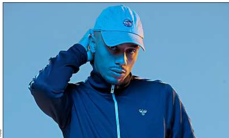
Le premier album de Mister V, Double V , a été disque de platine.

Le retour des gens du milieu me permet de m'assurer plus de crédibilité que lorsque j'ai commencé. Mais je ne