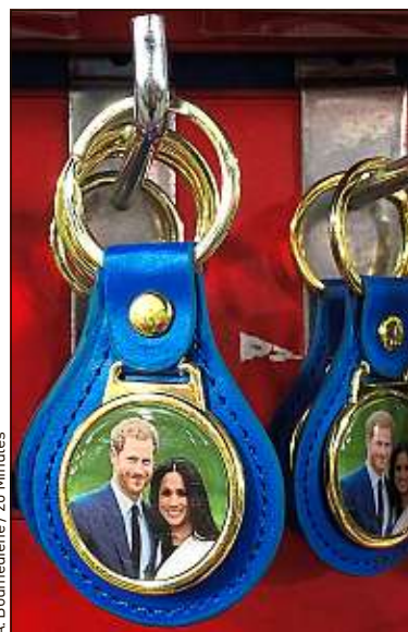
Des visages que certains Londoniens ne veulent plus voir.