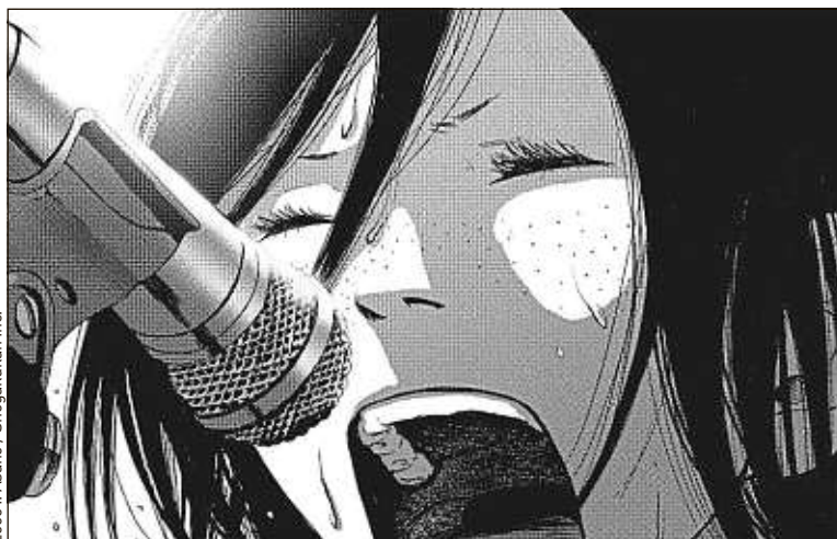
Inio Asano a créé Solanin alors qu'il avait une vingtaine d'années.