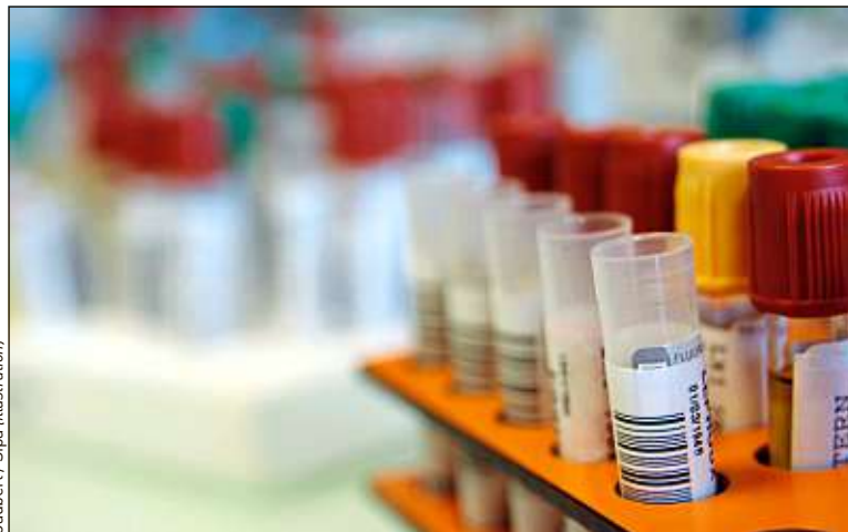
Les tests développés par NovaGray sont basés sur un prélèvement sanguin.

La radiothérapie est l'un des piliers de la lutte contre le cancer, un patient sur deux y a recours. Mais cette méthode lourde, qui consiste à tenter d'éradiquer la tumeur en l'irradiant, n'est parfois pas sans conséquences : selon l'Institut de radioprotection et de sûreté nucléaire, elle entraîne des effets secondaires chez 5 à 10 % des malades. A l'occasion de la Journée mondiale contre le cancer, 20 Minutes s'est in-