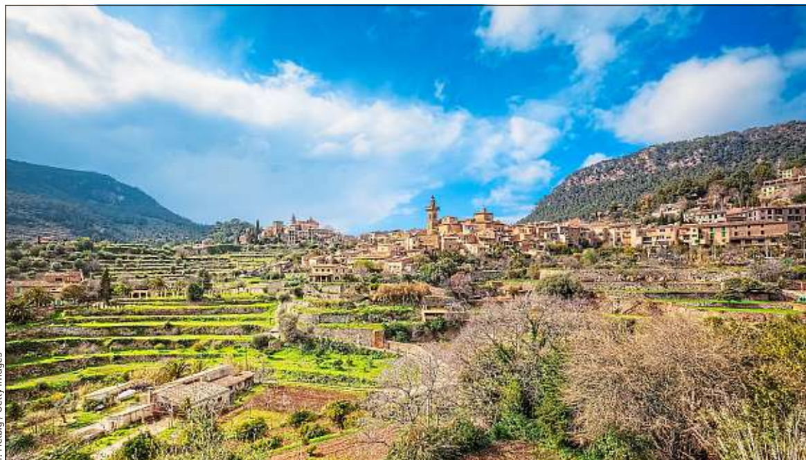
Entourée d'une végétation abondante, Valldemossa est connue pour ses plantations d'oliviers et son architecture.