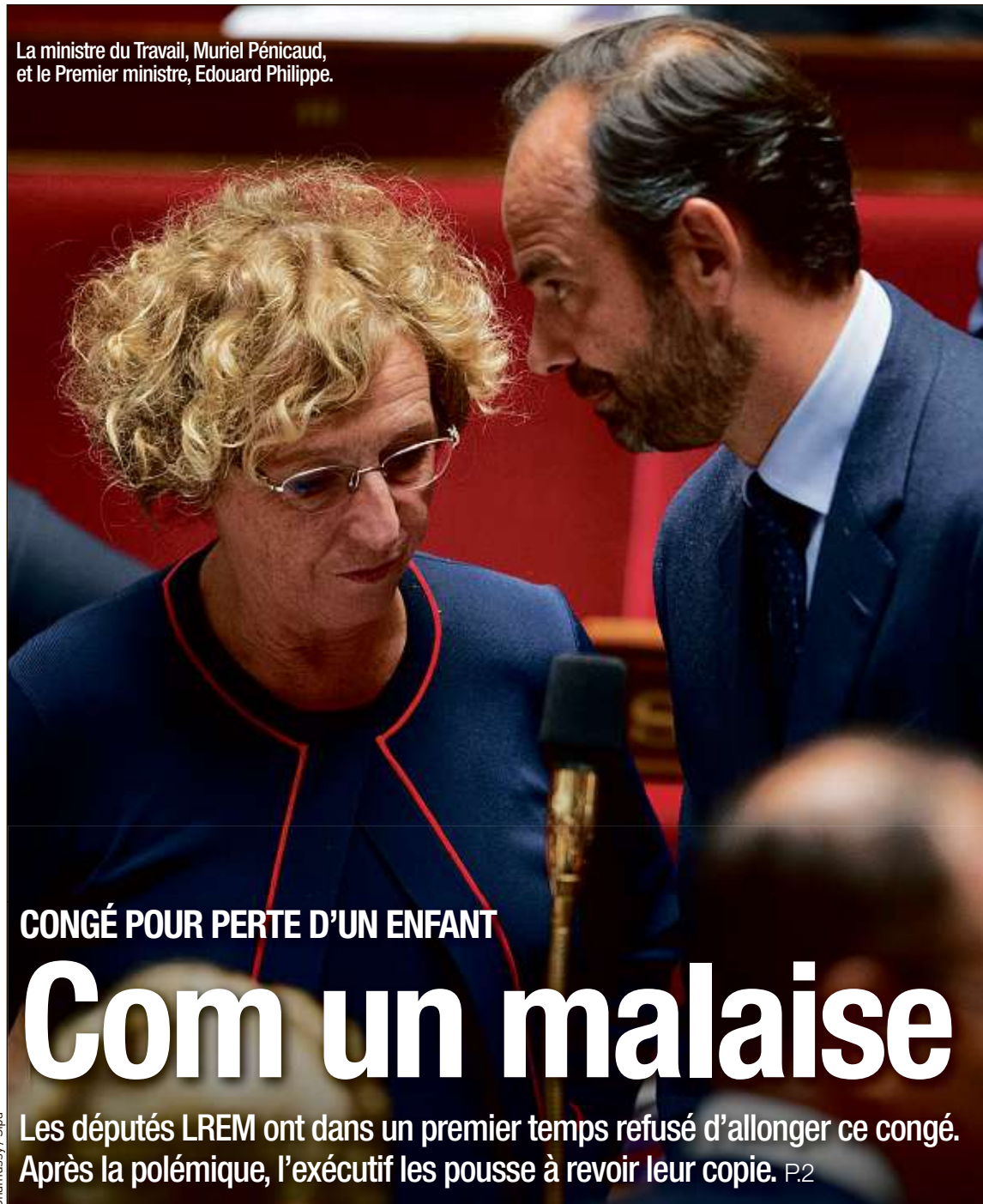
La ministre du Travail, Muriel Pénicaud, et le Premier ministre, Edouard Philippe.