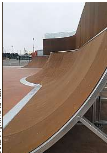
Le nouveau pôle France du BMX.

Jeudi, Tony Estanguet et Claude Onesta se rendront à Montpellier pour signer une double convention liant le Cojo (Comité d'organisation des jeux olympiques) à la région Occitanie. Depuis la nomination de Paris pour l'organisation des Jeux 2024, la région s'est positionnée comme base de préparation et base arrière de l'événement.