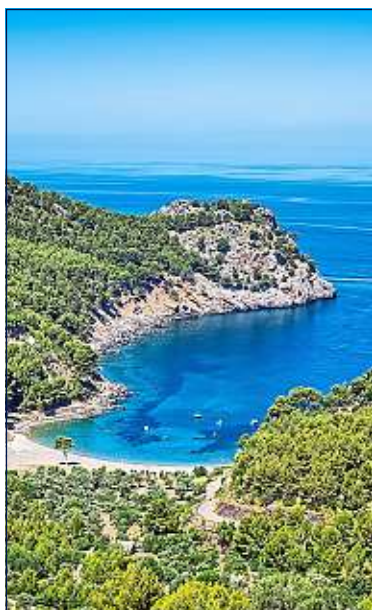
Cala Tuent est peu fréquentée.