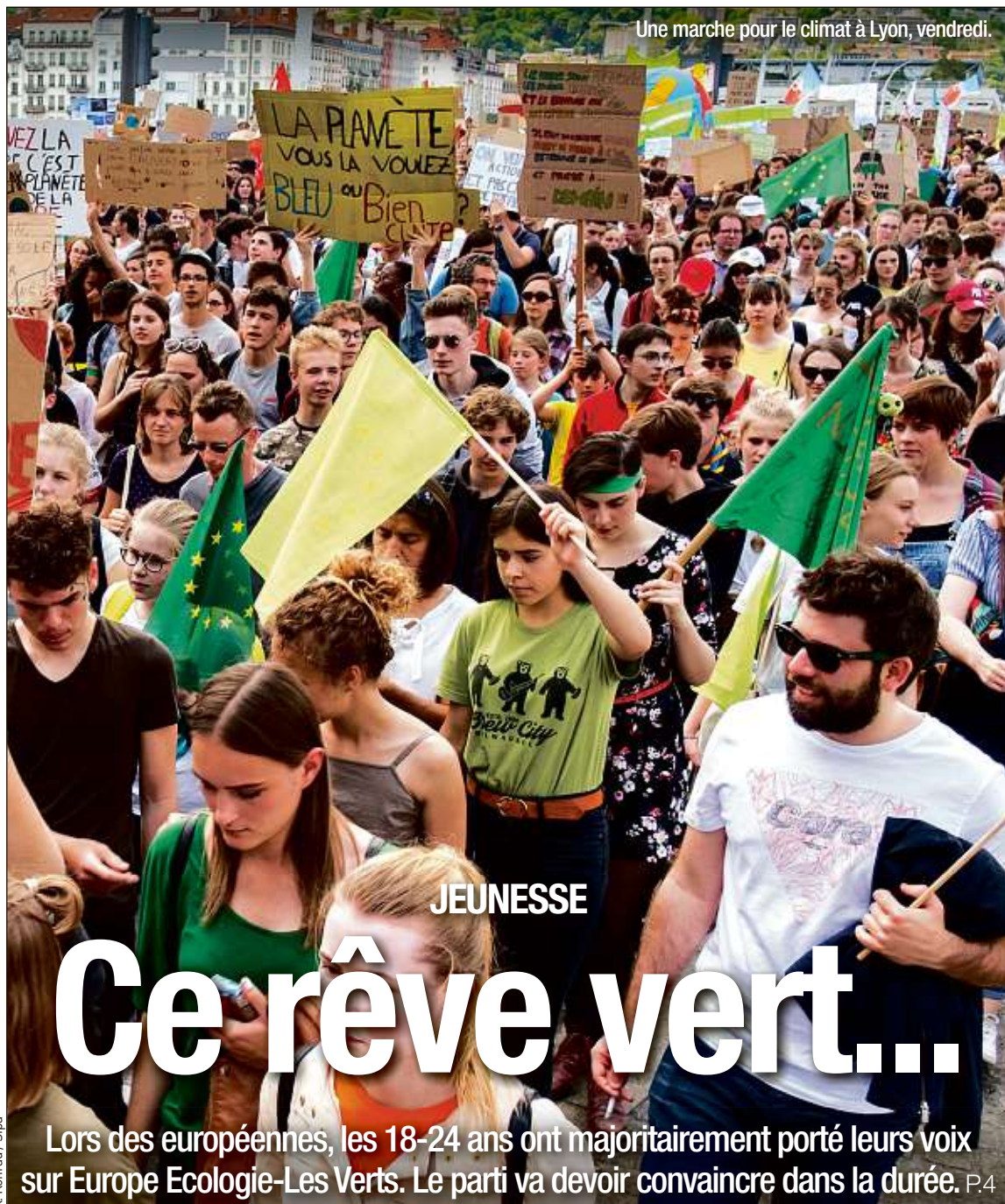
Une marche pour le climat à Lyon, vendredi.