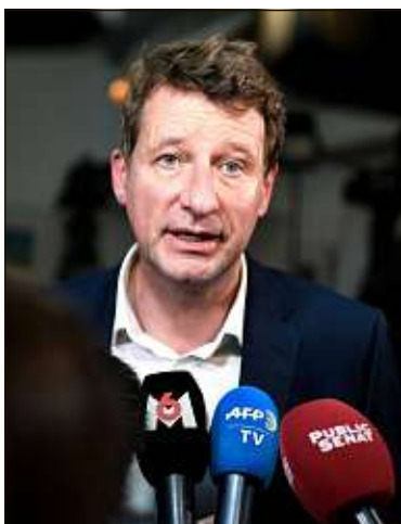
Yannick Jadot et les écologistes devraient négocier leur soutien.

* Sondage réalisé entre le 22 et le 25 mai, sur un échantillon représentatif de 5 433 Français majeurs inscrits sur les listes électorales méthode des quotas.