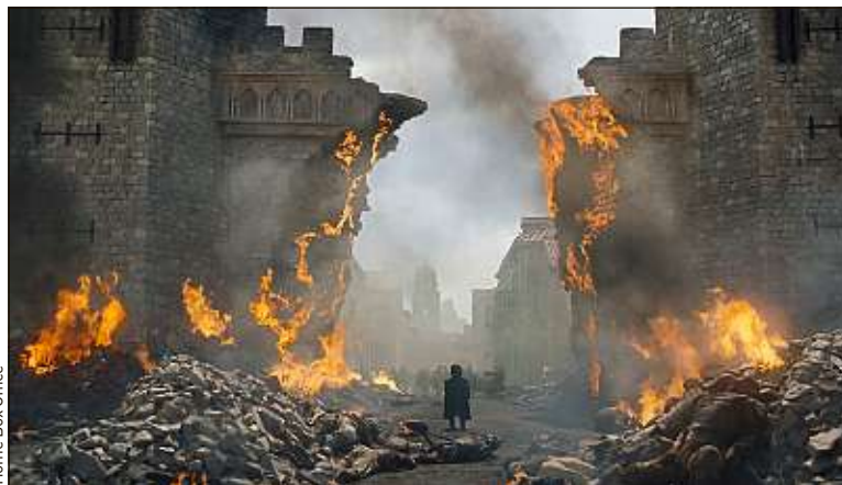
Les nombreux textes reçus imaginent souvent le pire.

la saga, toute une frange de fans exigent d'en savoir plus. Comme on n'est jamais aussi bien servi que par les lecteurs de 20 Minutes , nous vous avons demandé d'imaginer une suite à la saison 8 de «GOT». Attention : spoilers.