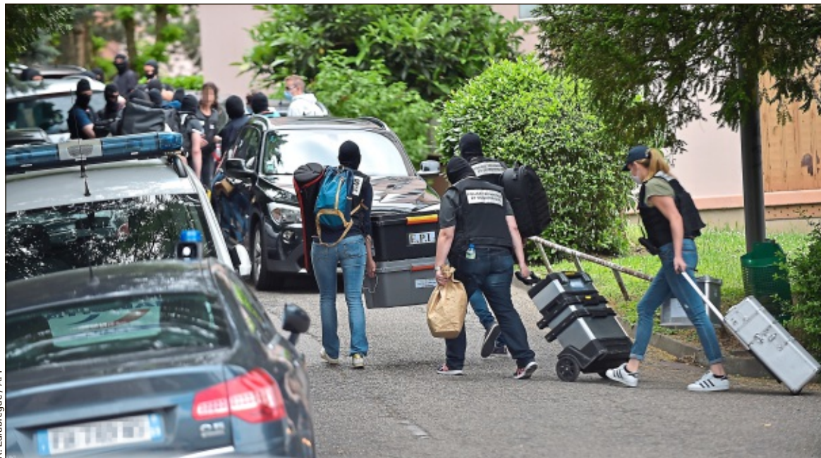
Les autorités ont mené des perquisitions au domicile du principal suspect, à Oullins, une commune proche de Lyon.

Trois jours après l'explosion d'un colis piégé rue Victor-Hugo, à Lyon, quatre personnes ont été interpellées et placées en garde à vue lundi. Selon le maire de Lyon, Gérard Collomb, interrogé par 20 Minutes , c'est l'exploitation des images de vidéosurveillance qui a permis de remonter jusqu'au suspect numéro un : un jeune homme de 24 ans. Surveillé depuis dimanche, cet étudiant en informatique a été appréhendé sur la voie publique, dans le 7 e arrondissement, car les policiers redoutaient que du TATP – un explosif instable – se trouve dans son appartement, confie à 20 Minutes une source proche du dossier.