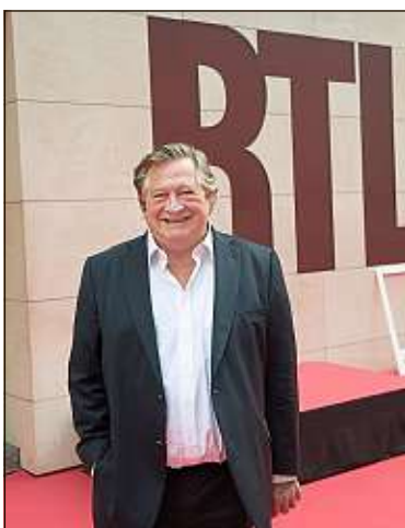
Jacques Pradel participe au podcast « Les Voix du crime », lancé lundi.

« De manière générale, je ne crois plus trop à Internet » Après avoir signé six volumes de la collection « Shampooing » ( Le Jeu vidéo , La Famille , L'Amour , La Blogosphère , La Guerre , La BD ), qui reprenaient des billets issus de son blog dessiné, Bastien Vivès propose davantage d'inédits. « J'ai viré mon blog il y a quelques années parce que je préférais me concentrer sur mes albums, explique-t-il à 20 Minutes. De manière générale, je ne crois plus trop à Internet. Quelques strips de cet album ont quand même été prépubliés sur le Net, mais les deux tiers sont des exclus. »