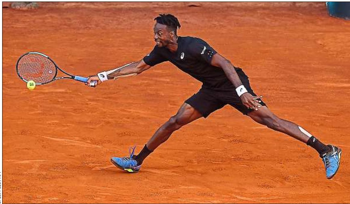
Gaël Monfils commence ce tournoi de Roland-Garros sans douleur et avec le sourire. Que demande le peuple ?