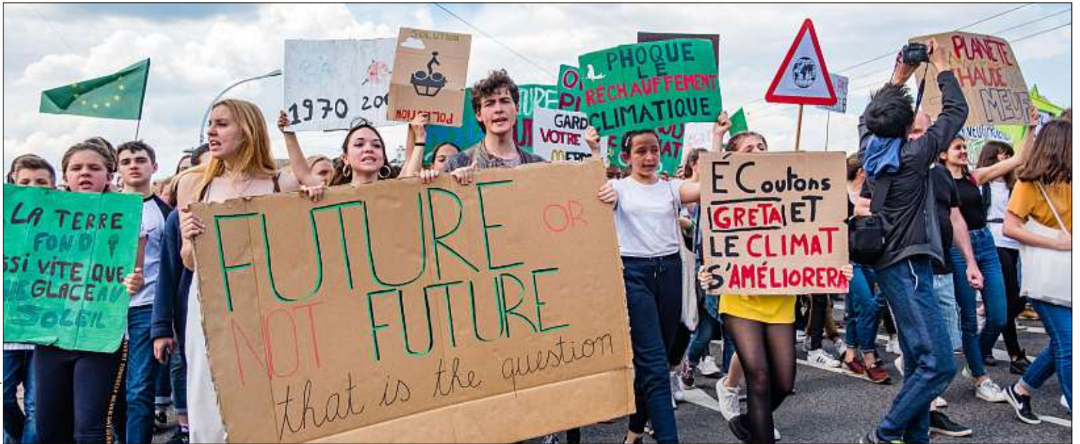
Les marches pour le climat (ici à Lyon, le 24 mai) et les « Friday for future » de ces dernières semaines ont contribué à rajeunir l'écologie politique.