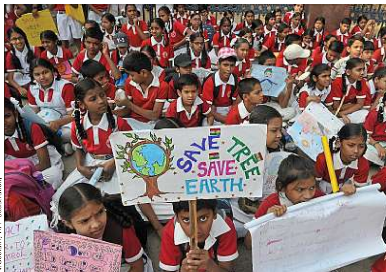
En échange de déchets en plastique, des Indiens ont un accès gratuit à l'école.

déchets en plastique pour s'en débarrasser. Ils souhaitaient donc mettre fin à cette pratique polluante. L'institut, fondé par un couple souhaitant offrir l'accès à l'éducation aux plus pauvres, rémunère également les élèves plus âgés qui font cours aux plus jeunes, après avoir suivi une formation, raconte le site NDTV. Une belle manière de lutter contre la déscolarisation : l'établissement, qui comptait au départ 20 élèves, en accueille aujourd'hui 110.