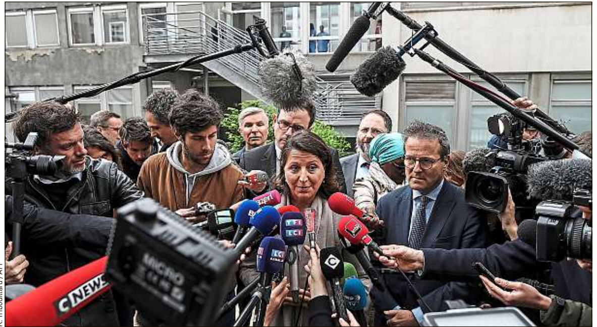
Agnès Buzyn, ministre de la Santé, s'est rendue jeudi à l'hôpital où des manifestants se seraient introduits la veille.

Cette version des faits est toutefois démentie sur les réseaux sociaux par des manifestants, qui racontent s'être retrouvés dans l'enceinte de l'hôpital pour échapper aux forces de l'ordre et aux gaz lacrymogènes. « On était bloqués sur le cortège déclaré, témoigne