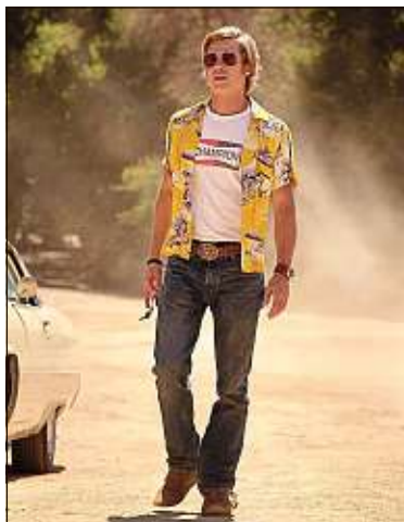
Brad Pitt joue un cascadeur dans Once Upon a Time... in Hollywood .