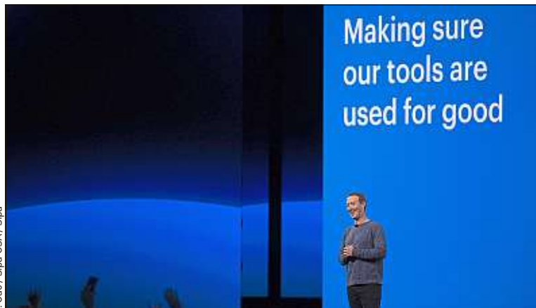
Mark Zuckerberg a annoncé une nouvelle fonctionnalité de son appli Dating.