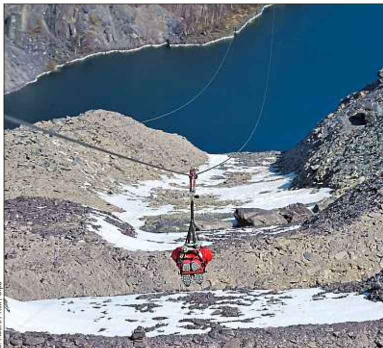
Au pays de Galles, une tyrolienne permet d'admirer le lac de Penrhyn.

« Ici, on est un peu comme en Nouvelle-Zélande ou en Islande. Vous pouvez trouver des paysages spectaculaires