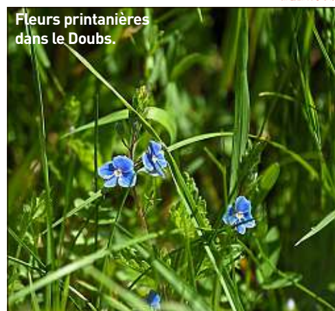
Fleurs printanières dans le Doubs.