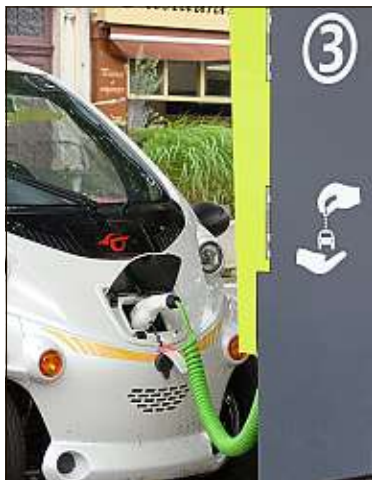
Entre 5 et 6 milliards d'euros seront investis pour ce consortium.

Environ 800 000 personnes ont été évacuées de régions de l'est de l'Inde. Ces dernières pourraient être sur la trajectoire du cyclone Fani, accompagné de fortes précipitations et de rafales dépassant les 200 km/h, ont annoncé jeudi des responsables indiens.