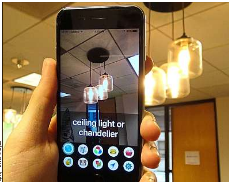
Déjà disponible, l'application Aipoly décrit tout ce qui vous entoure.