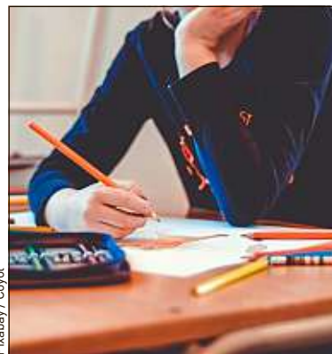
Il est destiné aux jeunes de 3 à 25 ans.

Ecole Comment améliorer la réussite des élèves de banlieue à l'école ? C'est l'objectif d'un grand plan lancé ce jeudi par le ministre de l'Education nationale Jean-Michel Blanquer et le ministre de la Cohésion des territoires, Julien Denormandie. Sous le nom de code « label Cités éducatives », cette marque « d'excellence » va mobiliser plusieurs acteurs du territoire pour participer à la réussite des jeunes de 3 à 25 ans dans les quartiers populaires. Ce label fonctionne grâce à une « grande