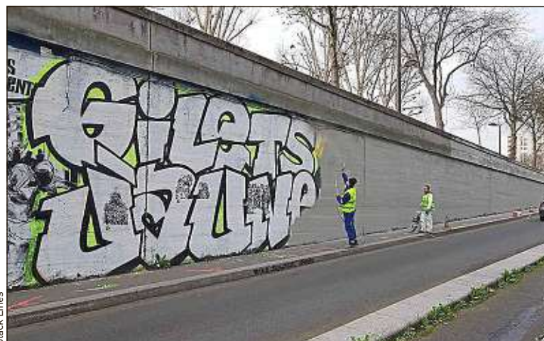
Peinte le 24 février, la fresque géante a été recouverte mercredi.