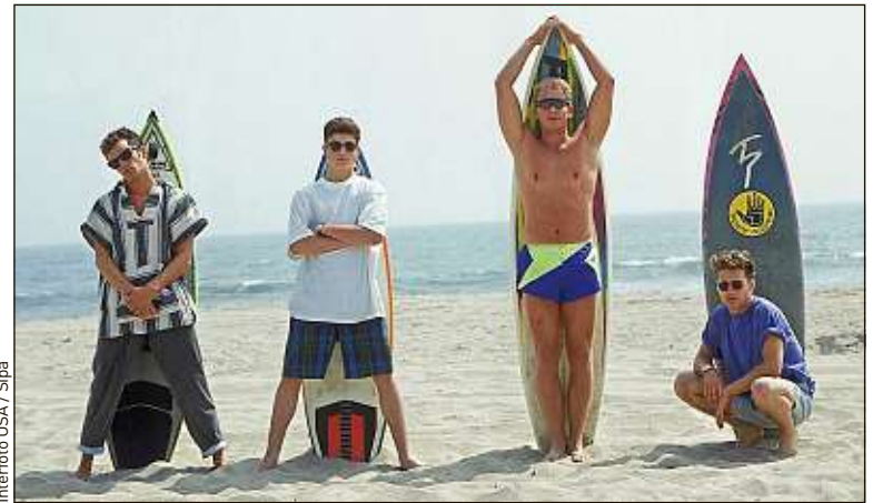
La jeunesse dorée de « Beverly Hills » (1990), sous le soleil californien.

Les séries ado ont aussi permis de faire avancer les mentalités, de donner un reflet plus réaliste de la société. « Dawson » est ainsi la première série à avoir mis en scène un baiser gay en prime time à la télé américaine. Dès 1994, « Angela, 15 ans » proposait un portrait sensible de l'adolescence, où le changement d'une couleur de cheveux, une rumeur dans les couloirs du lycée étaient traités comme des sujets de la plus haute importance. « L'école est un champ de bataille pour le cœur », lance son héroïne dans le pilote. La série est arrêtée au bout d'une saison, ce qui a, paradoxalement, participé à la rendre culte. Vincent Julé