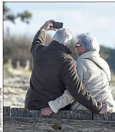
Huit Français sur dix partent avec une retraite à taux plein.

Un relèvement de l'âge nécessaire pour partir avec une retraite à taux