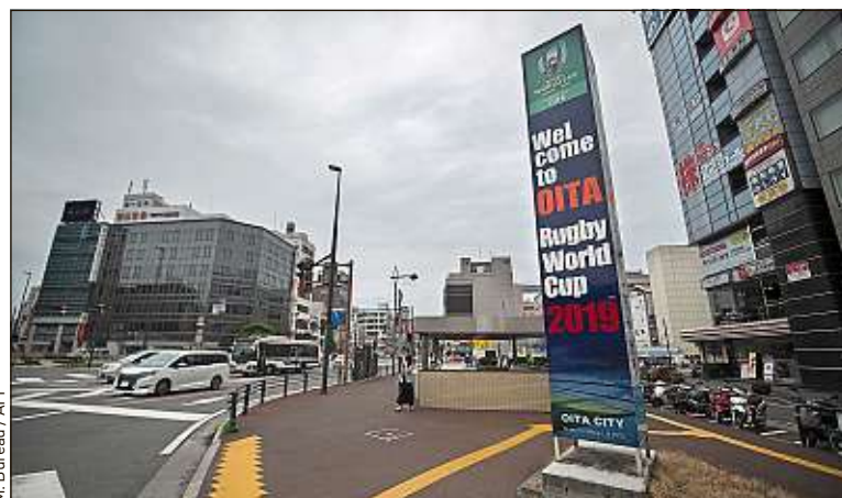
La ville d'Oita accueillera les supporters néo-zélandais, gallois ou australiens.

naï) persillé, les champignons shiitake ou le kabosu , un agrume utilisé dans la cuisine et les boissons. Pour surmonter la barrière linguistique, beaucoup de restaurants locaux utilisent déjà un système de QR code qui affiche la liste des plats en anglais, coréen ou chinois.