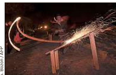
S. Bazon / AFP

Étincelles et cercles de feu sont venus illuminer la nuit alsacienne samedi, à Guevenatten (Haut-Rhin). Environ 150 personnes se sont rassemblées pour perpétuer la tradition du Schiewaschläga . «On chasse l'hiver en lançant dans le ciel des disques de hêtre incandescents, comme symbole du Soleil», explique Bernard Schittly, maire de Guevenatten.