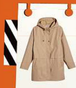
RCS PARIS 572 232 650 - www.madamecloud