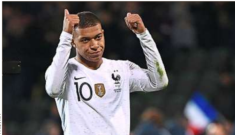
Contre la Moldavie, vendredi, Kylian Mbappé a souvent étalé sa frustration.

Il y a une semaine, contre l'OM, sa célébration mystérieuse, face aux ultras, pour le retour au Parc après l'immense déception de Manchester United, avait laissé perplexe. On avait aussi noté son