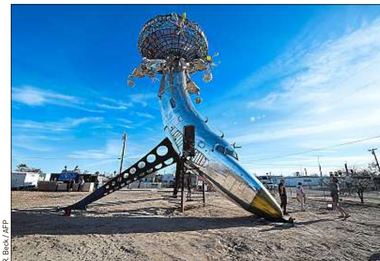
A Bombay Beach (Californie), on trouve désormais un avion en forme de poisson.

ainsi été disséminées en ville pour l'édition 2019 : un dôme fait de vieilles ferrailles, un fuselage d'avion représentant un poisson ou encore deux conteneurs formant une croix, dont l'intérieur est orné de peintures religieuses représentant des « scientifiques persécutés »... « Si Andy Warhol était toujours en vie, ça serait son truc », assure l'une des artistes exposées, qui a déployé cent tentes blanches sur un parking désaffecté pour y figurer les sans-abri et déplacés du monde.