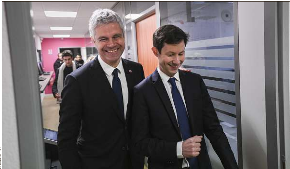
Le patron de LR, aux côtés de la tête de liste François-Xavier Bellamy (à droite), doit encore définir l'ordre des noms.

« Les noms seront donnés par ordre alphabétique », confirme le vice-président du parti Damien Abad. « Cela permet de commencer la campagne avec 30 candidats qui vont se déployer, sans se poser la question des éligibles et des non-éligibles », précisait, dès lundi, l'entourage de Laurent Wauquiez. Les derniers sondages (entre 9 à 13 % des intentions de vote) promettent aux Républicains entre 10 et 15 sièges au Parlement européen. Un nombre de places restreint qui a convaincu le patron du parti de lancer une sorte de « casting » à la candidature. « L'objectif est de créer une émulation pour maintenir tout le monde dans le même bateau, pour que tous soient actifs dans la campagne », assure Damien Abad.