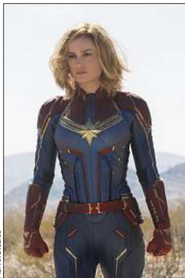
La comédienne campe Carol Danvers, alias Captain Marvel.

De States of Grace (2013) à Room (2015), où son rôle de jeune mère séquestrée