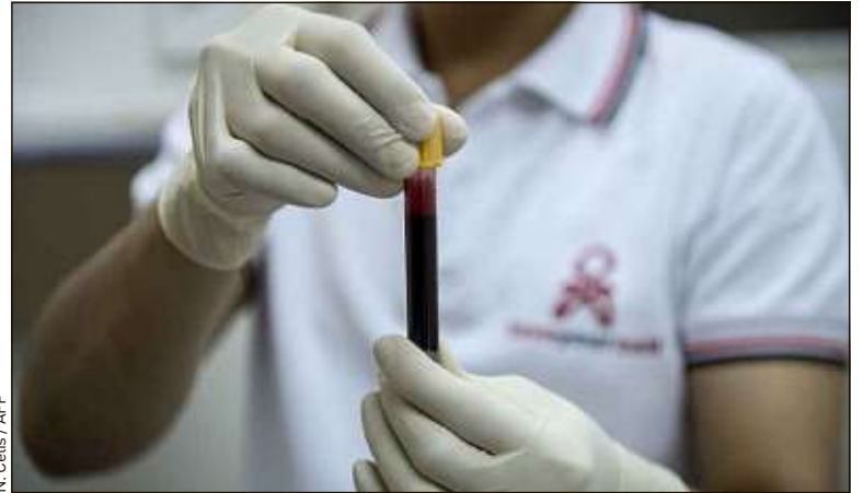
Les traitements actuels ne permettent pas aux porteurs du VIH de guérir.

sur l'importance du dépistage, surtout chez les populations à risque, afin de traiter le virus au plus tôt. On ne sait toujours pas réparer un système immunitaire que le virus aurait trop atteint. Une deuxième personne en rémission, est-ce un signe d'espoir ?