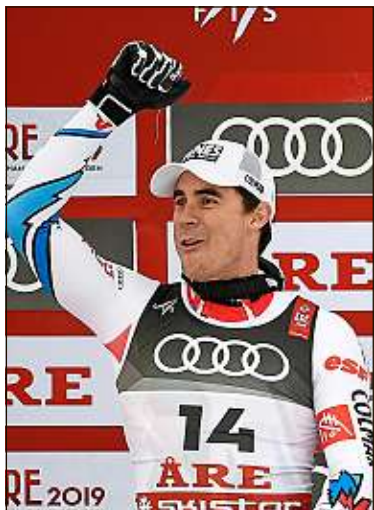
Il termine à neuf centièmes de Paris.

Gianni Infantino seul candidat à sa succession. L'Italo-Suisse Gianni Infantino, nommé à la tête de la Fifa depuis février 2016, est le seul candidat à la prochaine élection à la présidence de l'instance prévue en juin. Il est donc assuré d'un second mandat.