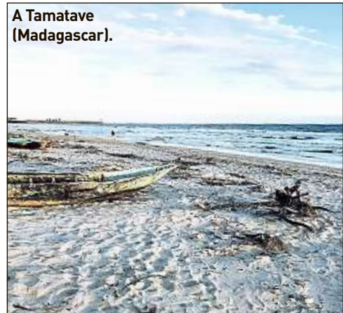
A Tamatave (Madagascar).