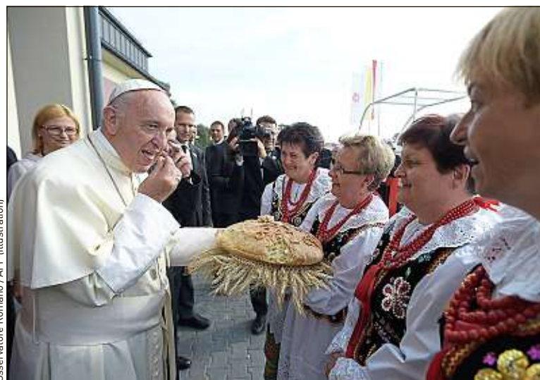
Le souverain pontife va peut-être vivre une période de carême originale.

de causer destructions et déforestations à l'échelle mondiale », peut-on lire dans une lettre ouverte au souverain pontife, transmise par l'équipe de la campagne « Million Dollar Vegan ». Une pétition « Demandons au pape François de manger végétarien pendant le carême », qui commence le 6 mars, accompagne cette campagne, lancée par des militants végétariens et soutenue par des célébrités comme Paul McCartney, Brigitte Bardot, ou encore Joaquin Phoenix.