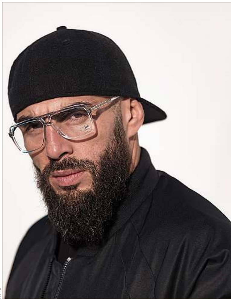
Le rappeur Médine dénonce la « société du trolling » et les stigmatisations.

Non, parce que je n'ai pas l'esprit revanchard. Pour moi, cette polémique n'avait pas lieu d'être, c'était un faux procès qui m'a été fait. Il aurait suffi que les médias vérifient leurs informations et épaississent un peu le sujet pour comprendre qu'il n'y avait