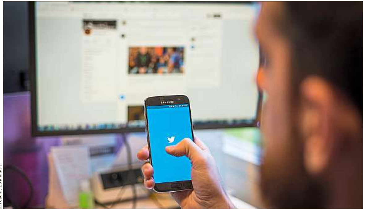
Un projet de loi doit être présenté d'ici à la fin de l'année pour lutter contre les discours de haine sur Internet.

« Impossible de tout faire seul » « La France va "se battre" pour un projet législatif au niveau européen contraignant les opérateurs du Net, et notamment les réseaux sociaux, à retirer très rapidement le "torrent de boue" des contenus "haineux, racistes ou antisémites" », avait déjà déclaré l'an dernier le Premier ministre, Edouard Philippe. « On ne peut pas tout faire tout seul. Il y a un vrai travail collectif de régulation à faire », reconnaît