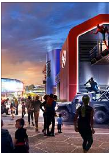
Le projet devrait voir le jour d'ici à 2025.

et la Guêpe et pourra faire équipe avec Iron Man, Captain Marvel, Black Panther ou encore Captain America. De nouvelles attractions seront également proposées, sans compter des spectacles inédits et des restaurants. Les spectateurs devraient se précipiter à la découverte d'un Rock'n'Roller Coaster totalement repensé pour une aventure à sensations fortes et à grande vitesse. Cet espace Marvel, qui devrait voir le jour d'ici à 2025, est la première étape de la transformation du célèbre parc francilien. Laure Beaudonnet