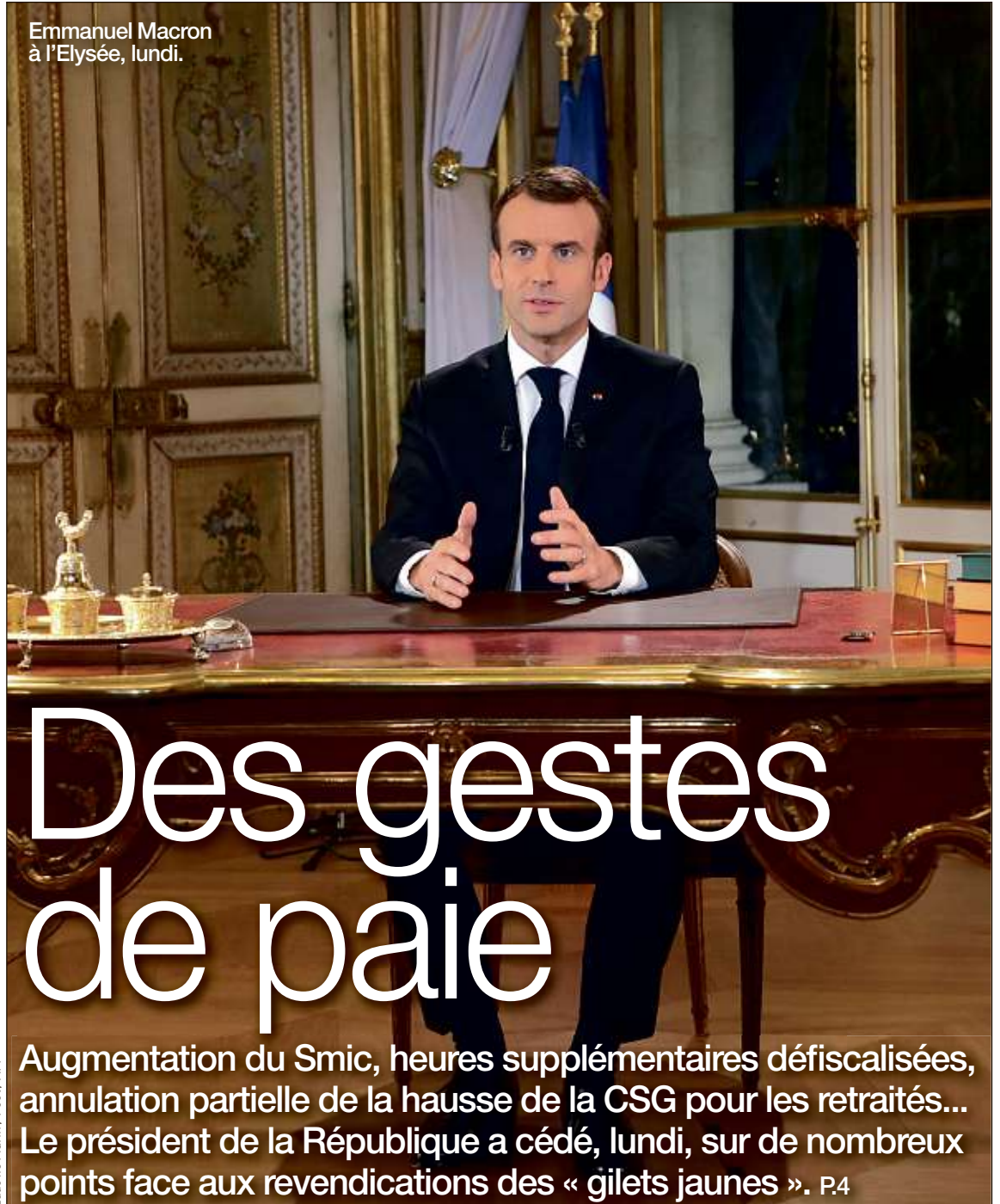
Emmanuel Macron à l'Elysée, lundi.