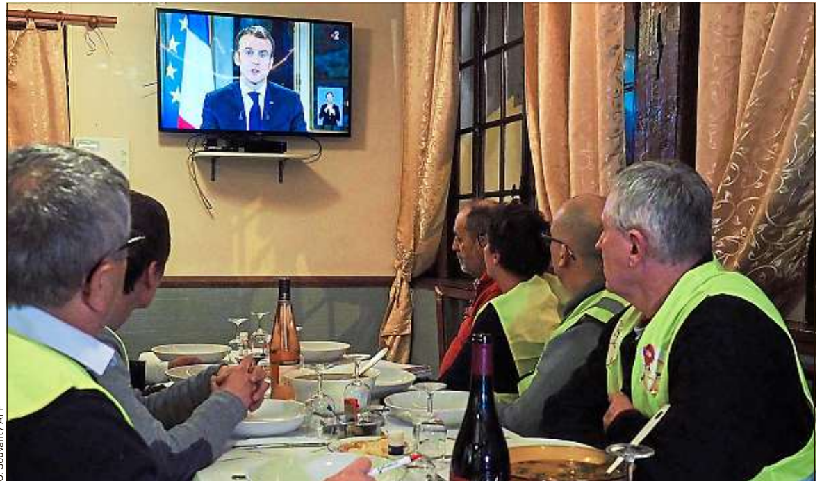
L'intervention du chef de l'Etat, lundi soir, était très attendue par les « gilets jaunes », comme ici près d'Orléans.