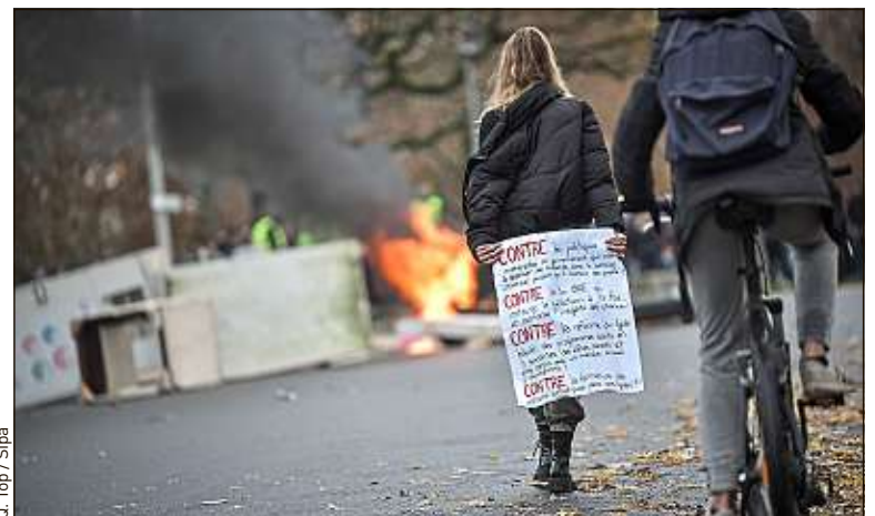
Les lycéens sont mobilisés contre les réformes dans l'Education.

L'hôpital peut mieux faire en matière de suivi post-opératoire, note l'étude.