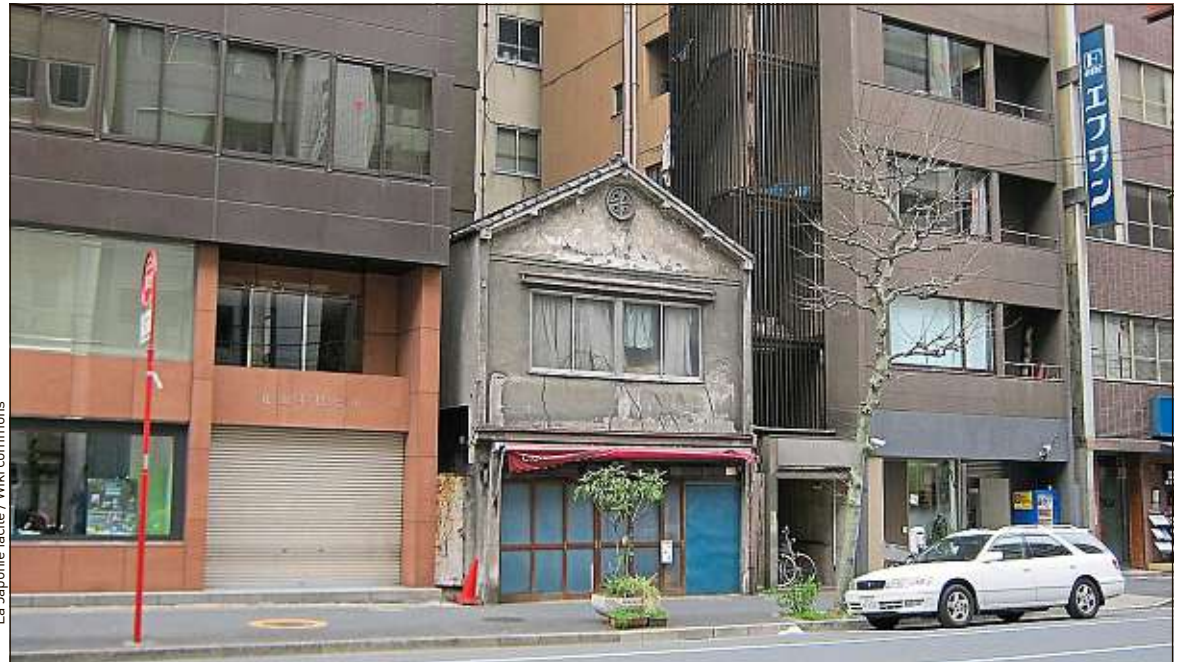
Les maisons nippones ( ici à Tokyo ) sont traditionnellement conçues pour supporter l'été, très chaud et humide.

Pour se réchauffer, les habitants prennent un bain brûlant le soir. Résultat, l'eau chaude représentait en 2012 14 % des dépenses énergétiques d'une maison japonaise, deux fois plus