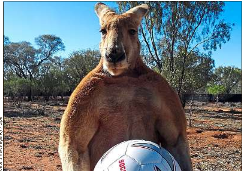
Roger le kangourou avait plus d'un million de fans sur sa page Facebook.