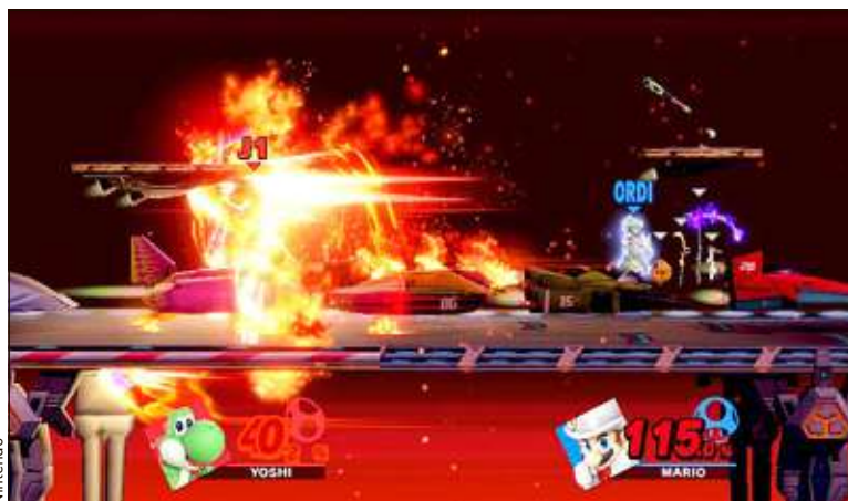
Dans cet opus, plus de 70 combattants sont à débloquer au fil des parties.

Ce nouvel épisode de la saga, lancée en 1999 sur la Nintendo 64, fait dans la démesure. Le jeu commence avec huit personnages, mais on se retrouve vite face à un choix démentiel. Outre Link, Zelda,