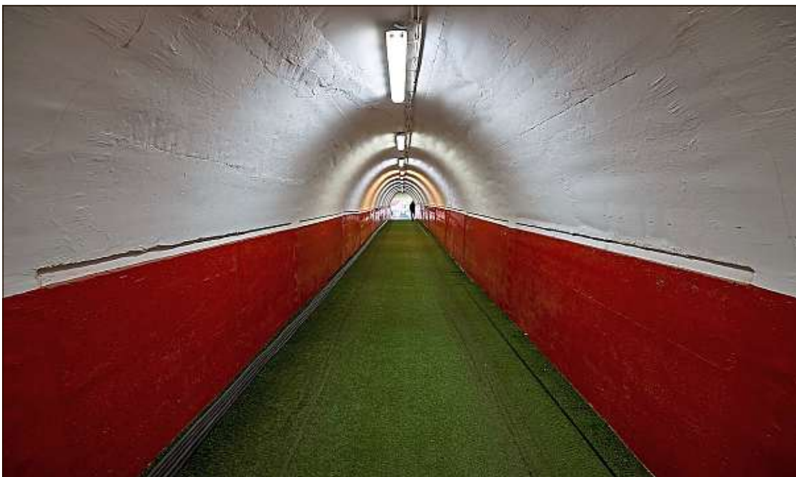
Pour aller du terrain au vestiaire, les joueurs parisiens devront emprunter ce long tunnel de 75 m assez intimidant.