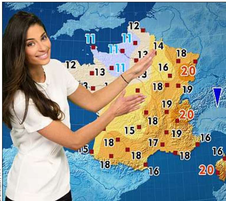
Tatiana Silva a succédé à Catherine Laborde sur TF1, en 2017.