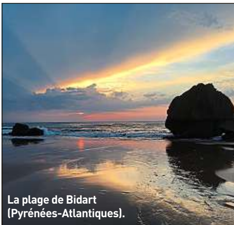
La plage de Bidart (Pyrénées-Atlantiques).