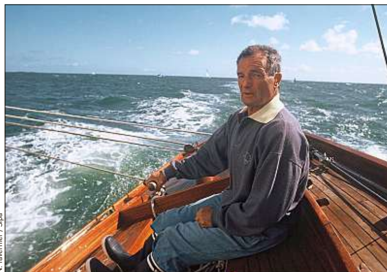
L'épouse d'Eric Tabarly (ici sur le Pen Duick en 1990) a lancé un appel aux dons.