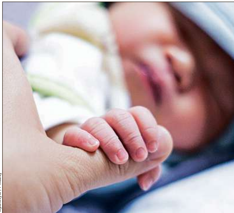
Après la naissance, le second parent peut poser onze jours de congés.

En France, le congé « de paternité et d'accueil du jeune enfant », instauré en 2002, accorde au second parent onze jours consécutifs pour une naissance simple et dix-huit jours pour une naissance multiple. Payé par l'Assurance maladie en fonction du salaire, ce congé reste cependant optionnel. Au nom de l'égalité entre