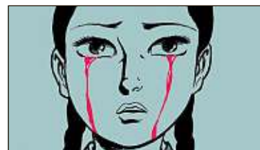
Futuropolis; Ki-oon; Akata; Kana