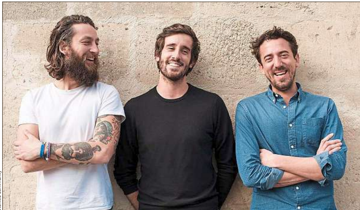
Les cofondateurs de Wanted Community ont remporté un chèque de près de 850 000 €.

Celui de Paris réunit près de 450 000 personnes. Leurs groupes sont devenus des références dans plusieurs villes françaises, comme à Bordeaux, où a ouvert récemment le premier