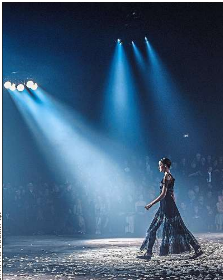
Le défilé de Christian Dior a ouvert les festivités, lundi à Paris.