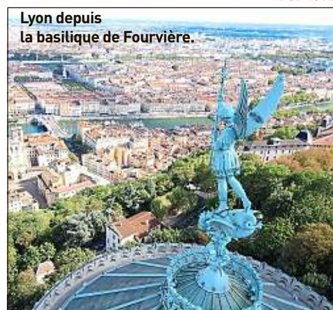
Lyon depuis la basilique de Fourvière.