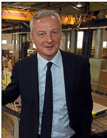
Le ministre de l'Economie et des finances Bruno Le Maire.

L'Italie durcit sa politique d'accueil des migrants. Le Conseil des ministres a adopté lundi une loi drastique. Au menu : expulsion de demandeurs d'asile, baisse des permis de séjours humanitaires, révocation de la naturalisation en cas de condamnation et armement des policiers municipaux.