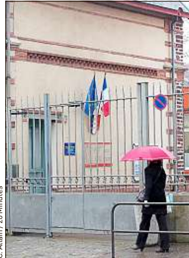
C. Allain / 20 Minutes

Un professeur de génie mécanique soupçonné de soutenir la cause djihadiste a été révoqué par l'Education nationale. Contestée par l'enseignant, cette décision a été confirmée par le tribunal administratif, qui a jugé que l'homme avait adopté « un comportement incompatible avec l'exercice de ses missions d'enseignement ». Les services de renseignement l'avaient identifié comme membre du milieu salafiste rennais, coupable d'avoir traduit des textes sur des forums djihadistes et incité plusieurs personnes à partir en Syrie. Au lycée professionnel Charles-Tillon où il exerçait, la nouvelle s'est rapidement répandue. « On a vu ça sur Facebook. Ça fait bizarre. Mais on ne le connaissait pas », témoignent des élèves. Cela fait trois ans que l'enseignant n'a pas mis les pieds au lycée. Déjà surveillé, il avait fait l'objet d'une