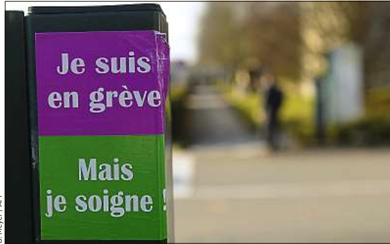
Guillaume-Régnier est le troisième plus grand hôpital psychiatrique de France.