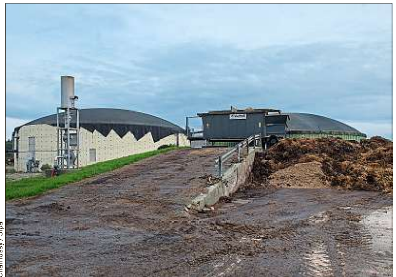
Chamussy / Sipa

Le cap ne pourra pas être atteint sans le développement de la méthanisation,