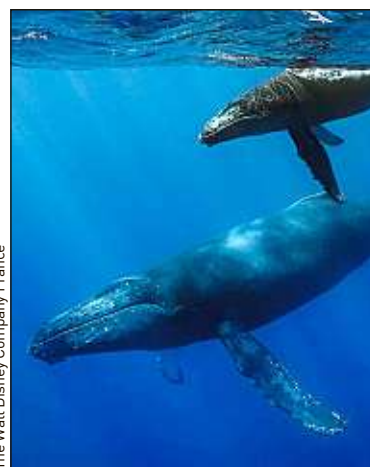
The Walt Disney Company France

Les prises de vue sous-marines des baleines sont impressionnantes.