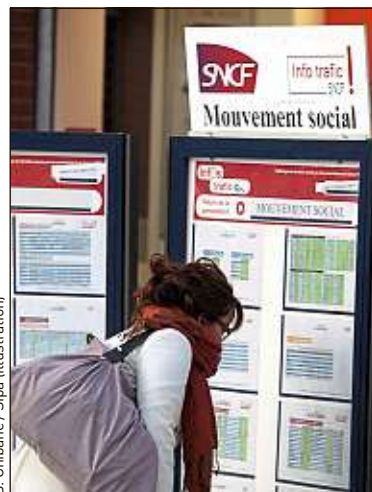
(illustration)