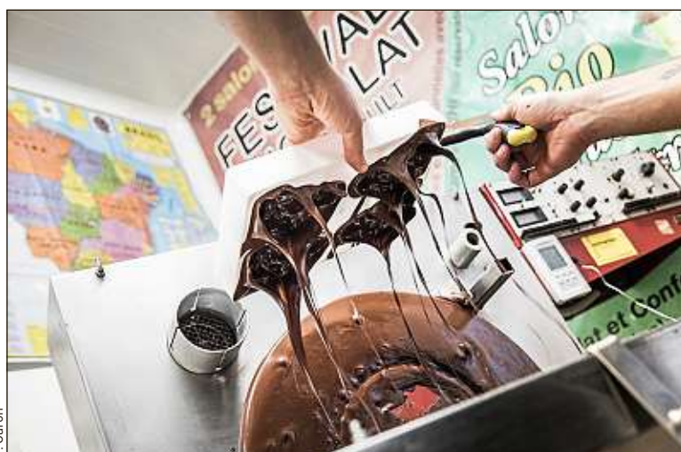
L'artisanat englobe 250 métiers et concerne 3,1 millions de travailleurs.

Grâce à une technique d'impulsion d'air, Arca rend le bois aussi malléable que du textile. Résultat : d'impressionnants systèmes de rangement et des meubles design aux formes aériennes.