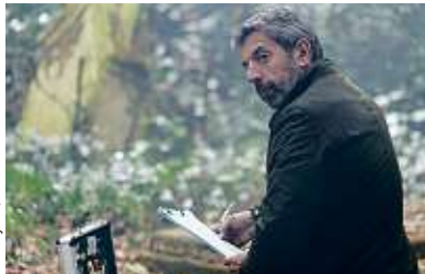
N. Guyon / FTV

« J'avais envie de m'amuser dans une fiction » P.20