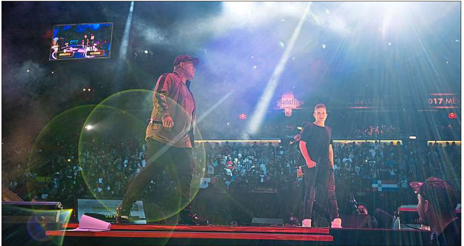
La demi-finale de la Batalla de los Gallos 2017 opposant le Mexicain Aczino (à g.) et l'Espagnol Arkano a soulevé la foule de l'Arena Mexico, en décembre 2017.