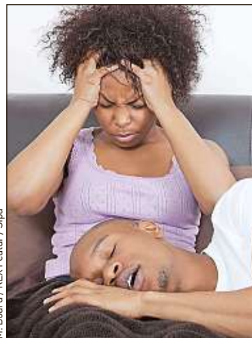
Pas facile toutes les nuits...

Il existe aussi les bandes nasales (de petits sparadraps à coller sur le nez), qui s'avèrent utiles quand on vit dans une ville polluée et que le ronflement vient du nez. Enfin, si le problème résonne trop fort, n'hésitez pas à consulter un chirurgien. ■ Oihana Gabriel