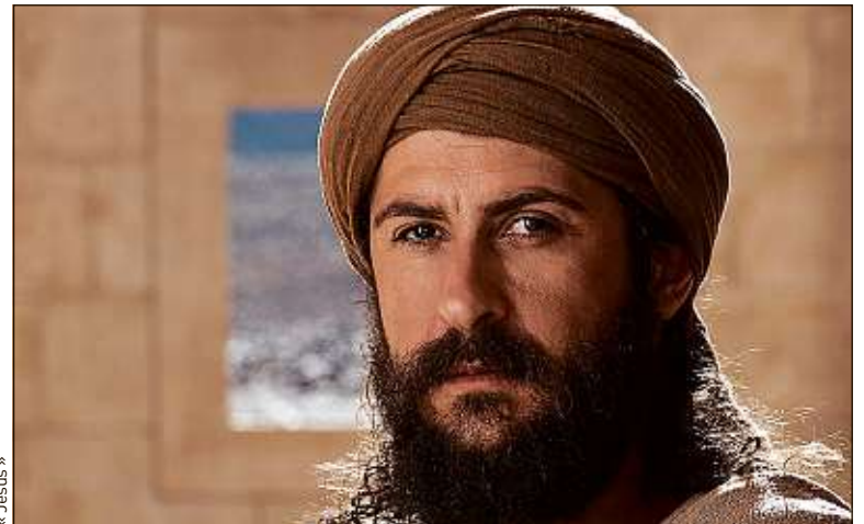
« Jésus »