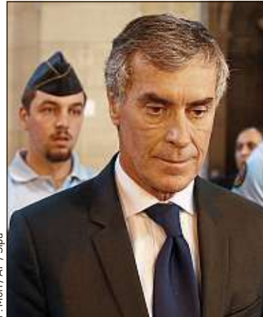
L'ancien ministre du Budget, au Palais de justice de Paris.