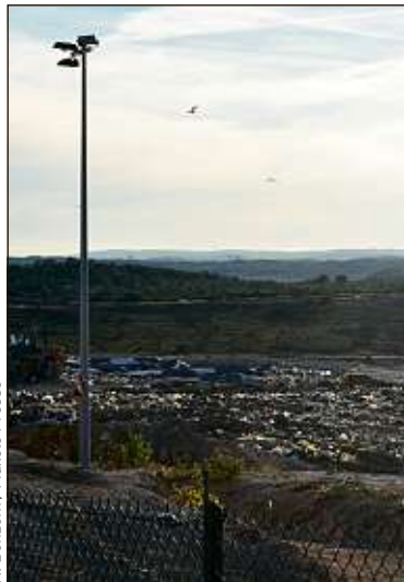
La décharge de Castries (Archives).

D epuis bientôt six ans, au nord-est de Montpellier, riverains et associations mènent une lutte sans merci contre la décharge de Castries : cet immense centre de stockage qui engrange quelque 80 000 tonnes de déchets inertes chaque année est responsable d'odeurs pestilentielles et de méfaits sur l'environnement, assurent les militants... Une affaire qui a provoqué de nombreux remous politico-judiciaires : l'ACIDC (Association collectif intercommunal contre la décharge de Castries) a déposé plainte contre la métropole, gestionnaire du centre. Un procès gagné par l'institution, mais qui sera rejugé en appel. L'Europe a aussi été saisie, à travers une pétition.