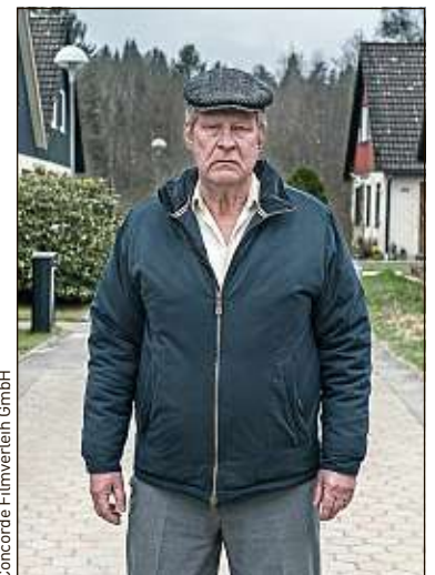
Rolf Lassgård incarne un grincheux.