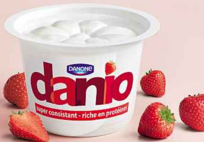
RCS D.P.F.F. 672 039 971 RCS Bobigny