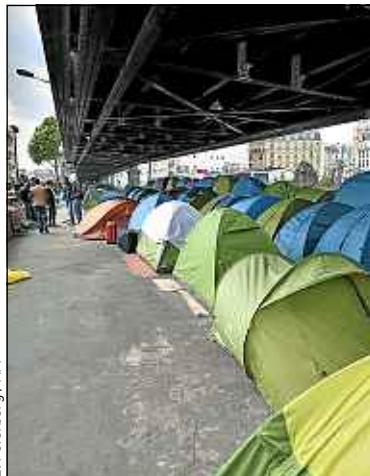
Le campement est situé dans le quartier de la Chapelle.

Sur place, les ordures jonchent le bitume où des hommes dorment, tout habillés, sur des matelas posés à même le sol.