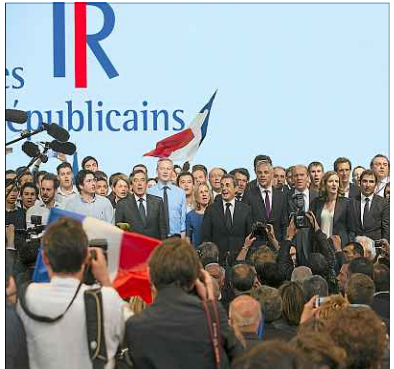
La grande famille de l'ex-UMP a mis de côté les divisions ce week-end.

Les faits se sont déroulés dans une cité sensible de Lorraine.