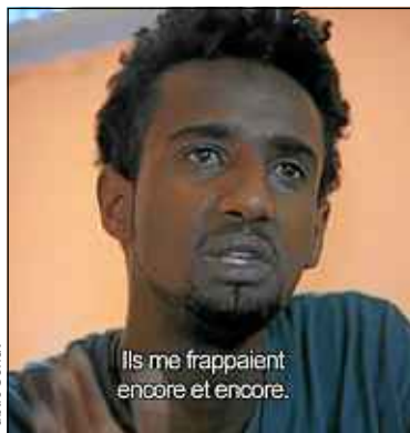
Un Erythréen témoigne.

Les réalisatrices ont tourné en 2014. « Aujourd'hui, on ne pourrait plus, avec les groupes ralliés à l'Etat islamique. On y est allé avant la mode d'égorger les journalistes », lance Delphine