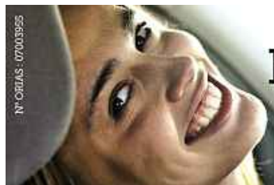
N° ORIAS : 070003955

Assurance auto résiliée ? Retrouvez votre assurance et votre sourire