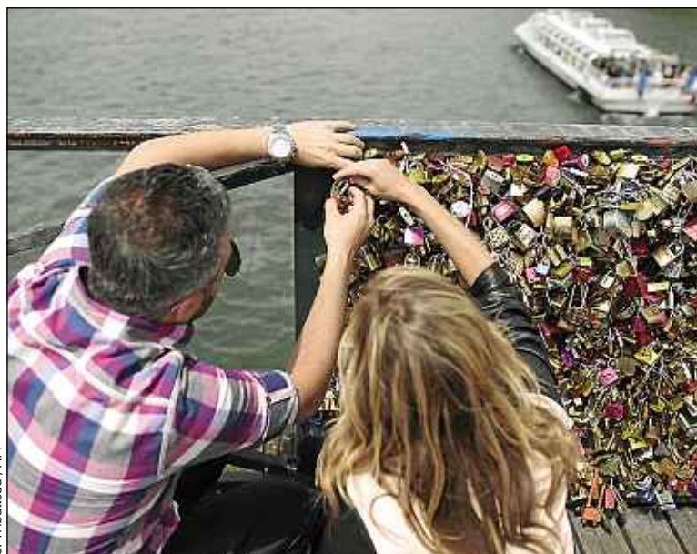
Le pont des Arts (6 e ) menace de s'effondrer sous le poids des cadenas.

Celui du patrimoine, en revanche, divise. Un père de famille espagnol, traîné par sa progéniture sur le pont des Arts ce vendredi-là, se réjouit et affirme que « le pont doit être protégé. Même si ça va attrister ma fille. » Un peu plus loin, occupés à se prendre en photo pour immortaliser leur lune de miel, deux jeunes Californiens veulent au contraire que la tradition perdure. « Il faut garder les cadenas, c'est le pont des amoureux ici, expliquent-ils. Il faudrait mettre du Plexiglas autour pour les conserver sans que les gens en ajoutent. » ■