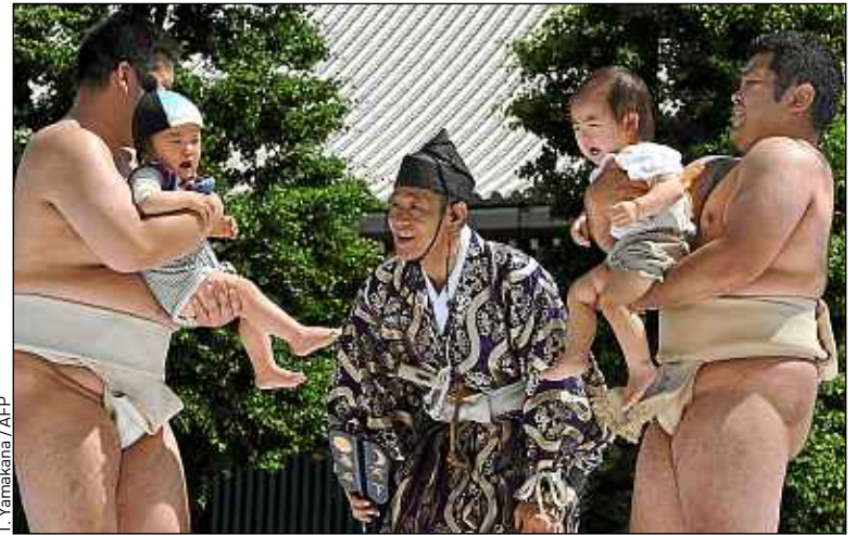
T. Yamakana / AFP

Selon la tradition, les enfants doivent pleurer pour montrer leur bonne santé.