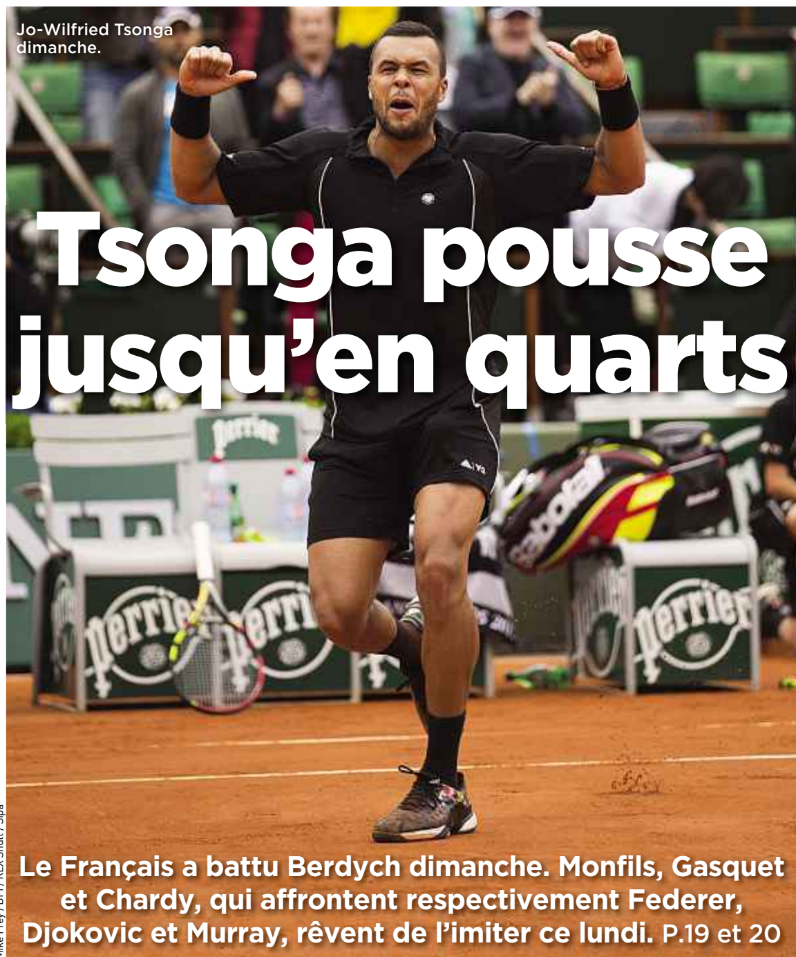
Jo-Wilfried Tsonga dimanche.

Guy Novès sera bien le futur patron du XV de France P.21