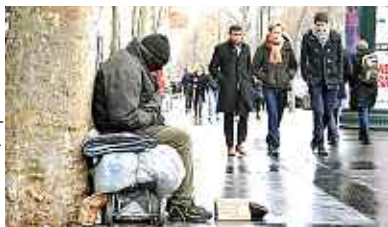
Antoine Cau / Sipa

Les inégalités se creusent de plus en plus P.4