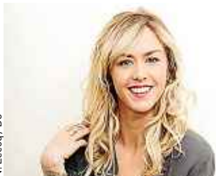
N. Lecoq / D8

Le pire de la télé honoré par les Gérard P.8