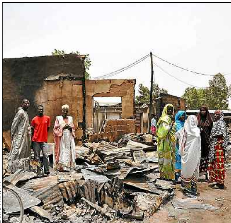
Depuis quelques jours, Boko Haram frappe dans le nord du Cameroun.

Depuis l'arrivée, en 2009, d'Aboubakar Shekau à la tête du groupe, les attentats frappant les civils, en particulier les chrétiens, se sont multipliés, suivis de nombreuses prises d'otages. « Il est aujourd'hui difficile de dire que Boko Haram suit des revendications idéologiques visant à l'instauration de la charia sur l'ensemble du territoire, estime Samuel Nguembock. Il y a aussi des enjeux politiques et économiques, notamment un contrôle territorial plus important autour du lac Tchad pour avoir un positionnement