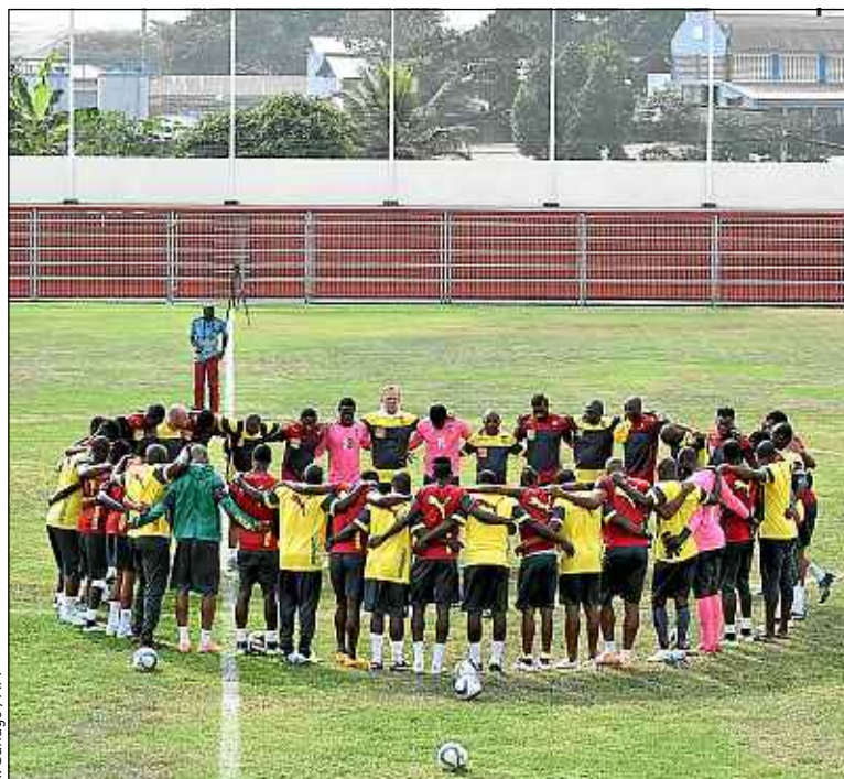
Les Lions Indomptables à l'entraînement dimanche, à Malabo.

Cet été au Brésil, les Camerounais nous ont offert : une bouderie collective à l'aéroport pour une histoire de primes, une bagarre entre Assou-Ekoto et Moukandjo en mondiovision contre la Croatie, et enfin des soupçons de corruption face au pays hôte. Trois matchs, trois fessées et autant de polémiques, les Lions Indomptables ont touché le fond au Mondial.