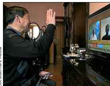
Dans une « smart community » de Shanghai, en Chine.

sée (allées et venues, achats, examens médicaux, activités) « grâce » aux solutions technologiques d'entreprises privées. « L'aspect sécuritaire est promu par des groupes qui misent là-dessus pour vendre leurs produits. Avec la menace terroriste, il y a un vrai risque. On est plus enclin à se réfugier dans ces ghettos technologiques, commente le réalisateur. Je ne pensais pas que ces avancées technologiques étaient déjà installées avant de faire ce film, à Shanghai par exemple. C'est déjà une tendance politique. Mon film est là pour ouvrir le débat. Il faut être conscient des dérives possibles. » ■ Anaëlle Grondin