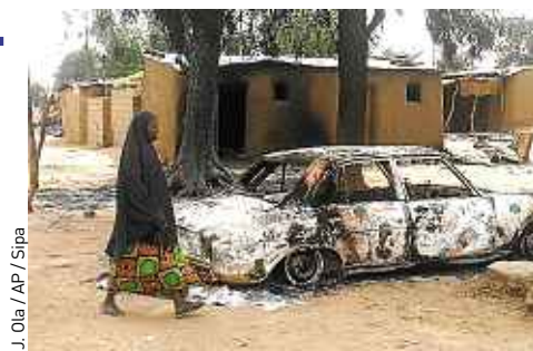
J. Ola / AP / Sipa