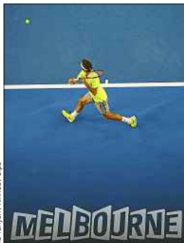
Roger Federer, lundi.