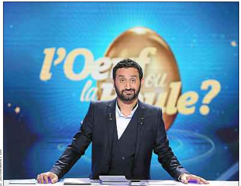
Cyril Hanouna remporte un triplé, dont le Gérard de l'animateur.