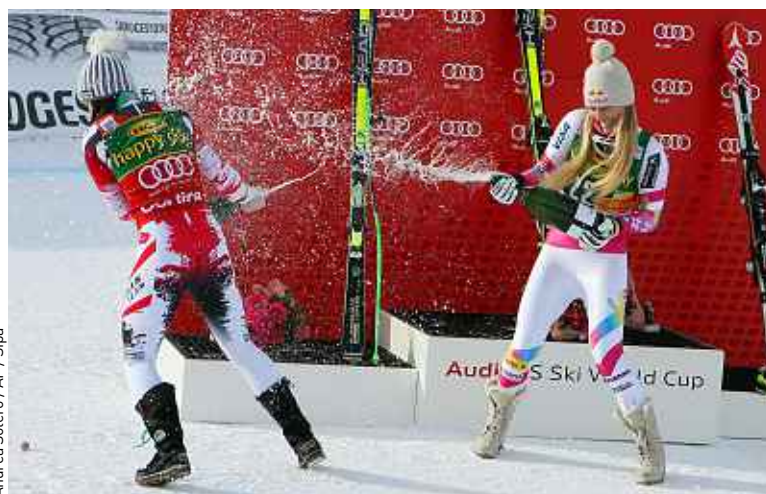
Lindsey Vonn (à dr.) célèbre sa victoire avec Anna Fenninger (à g.).

Paul dans le Minnesota, au micro de la télévision publique autrichienne ORF dans l'aire d'arrivée. Ce record a tenu 35 ans, et j'espère bien que le mien tiendra encore 35 ans au minimum. » L'Américaine, véritable cannibale de victoires comme son compagnon, le golfeur américain Tiger Woods, n'en est pas moins appréciée du circuit féminin, car elle a permis de mettre un coup de projecteur sur une discipline peu médiatisée. ■ N. G.