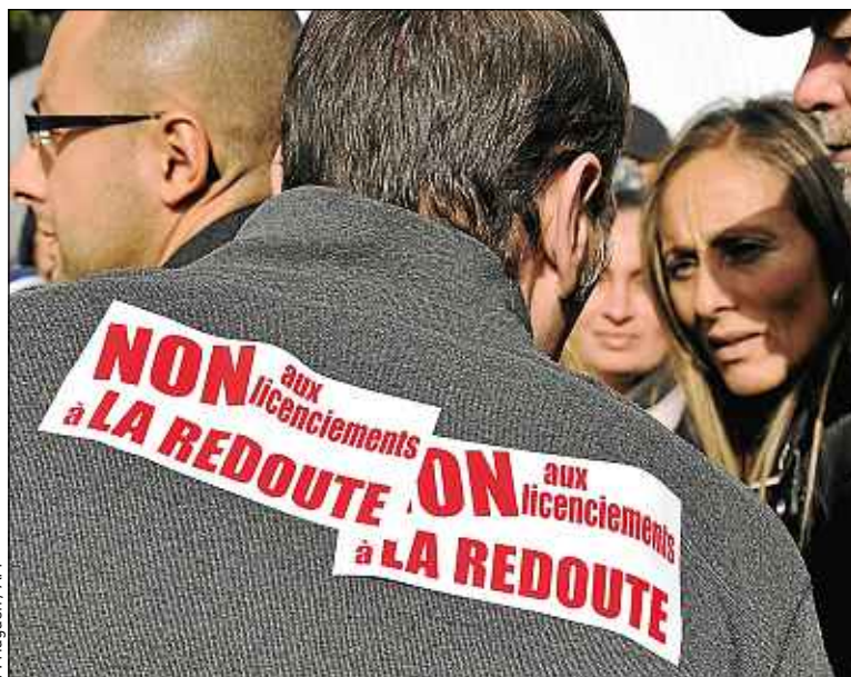
Les grandes crises, comme à la Redoute, masquent de plus petites faillites.

► Un cadre légal facilitateur. Pour certaines entreprises, l'entrée en vigueur le 1 er juillet de la loi de sécurisation de l'emploi a pu avoir un effet déclencheur pour lancer leur restructuration.