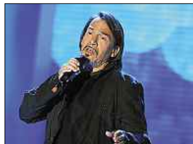
Eminem, Céline Dion, Eddy Mitchell et Florent Pagny (de g. à dr. et de h. en b.).