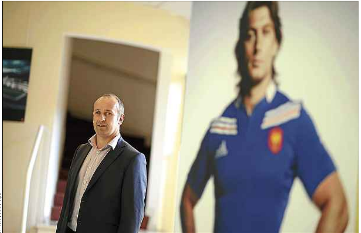
Philippe Saint-André n'a les joueurs du groupe France à sa disposition que onze semaines par an.

On en veut toujours plus, mais on a réussi à récupérer ces stages et c'est bon d'avoir les joueurs pour travailler. Notre fonctionnement en France est un fonctionnement de club, on n'aura jamais les mêmes conditions que les Néo-Zélandais qui sont ensemble six mois par an. On s'aperçoit que le rugby international évolue, qu'il se joue de plus en plus sur les détails... Plus nos joueurs seront ensemble, plus l'équipe sera performante.