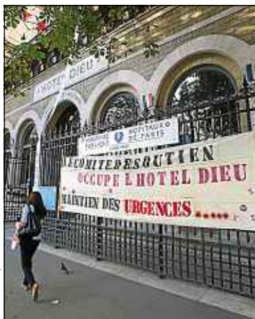
Le maire de Paris ne « validera aucune forme de démantèlement ».

Alors que François Hollande a lancé une consultation pour savoir qui les Français veulent voir « panthéoniser » en 2014, Anne Hidalgo (PS) appelle de ses vœux l'entrée d'Olympe de Gouges, femme « libre et avant-gardiste ».