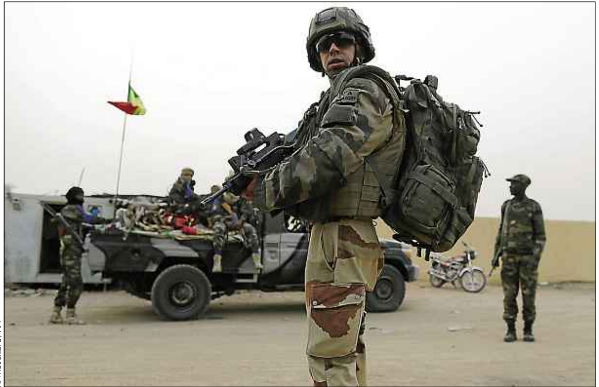
Un soldat français patrouille avec des Maliens à Kidal, au mois de juillet. Aujourd'hui, des chefs islamistes y paradent.