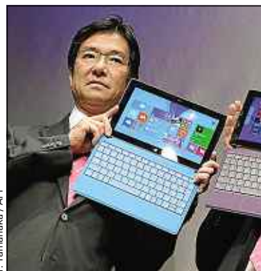
Il y a quatre couleurs de clavier.

Côté tablette, la Surface 2 souffle le chaud et le froid. Elle brille pour regarder des vidéos, mais est quasi-inutilisable en orientation portrait. Elle reste surtout handicapée par le manque d'apps. A qui s'adresse alors la Surface 2 ? A ceux qui veulent une tablette polyvalente équipée d'Office sans attendre d'elle qu'elle remplace complètement un PC. Pour cela, il faut s'orienter du côté de la version Pro, sous Windows 8, qui démarre à 879 €. Ou aller voir chez Asus, dont le Transformer Book T100 arrive avec un rapport qualité/prix imbattable : 379 €, clavier inclus. ■ P. B.