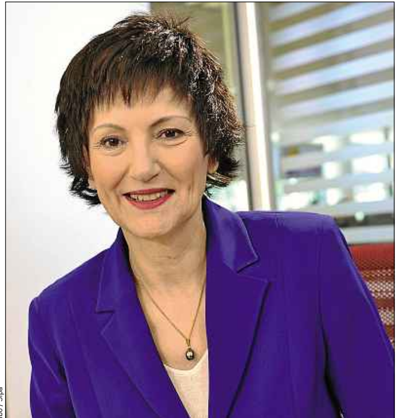
Un projet de loi va tenter de répondre aux besoins des « familles modernes ».

– ce serait une petite révolution. Aujourd'hui, on a du mal à rompre les liens biologiques et à rendre adoptables ces enfants. Or des familles sont prêtes à adopter, peut-être d'ailleurs en conservant les liens avec les parents biologiques.