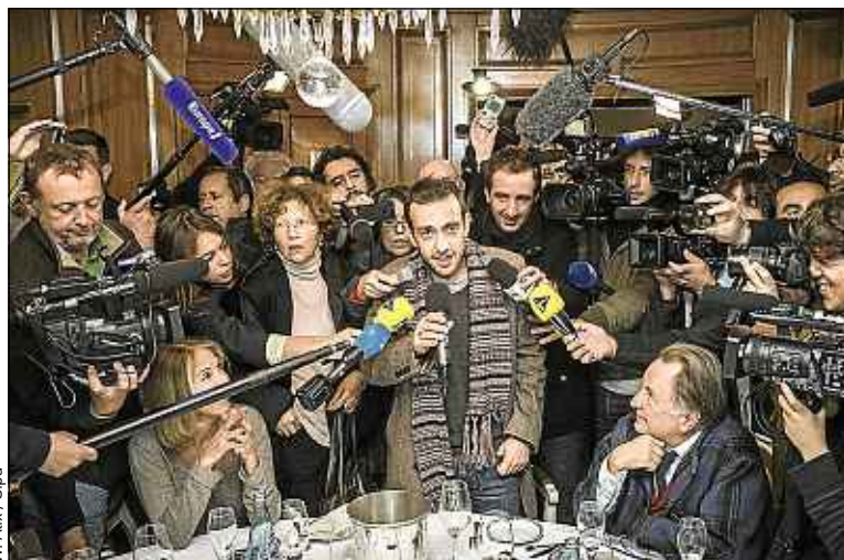
En 2012, le prix Goncourt a été remis à Jérôme Ferrari.

► Copinage. Cette année, on recense 555 livres pour la rentrée littéraire. « Il n'est pas question de tout lire, mais on ne passe à côté de rien », assure Pierre Assouline, juré du Goncourt depuis 2012. Pour lui, la « justice littéraire » n'a « pas plus de sens que la perfection en art ». « GalliGrasSeuil », l'expression inventée en 1989 pour dénoncer la mainmise sur les prix des maisons d'édition Gallimard, Grasset et Seuil, a largement perdu de sa pertinence. Actes Sud, a, par exemple, été récompensée en 2004 et 2012. Mais les intérêts éditoriaux – qui avaient en 1932 « confisqué » le Goncourt à Céline – n'ont, bien sûr, pas disparu. « Les plus gros éditeurs se taillent la part du lion », note Sylvie Ducas, auteur de La