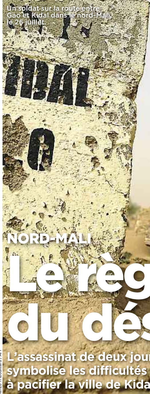
Un soldat sur la route entre Gao et Kidal dans le nord-Mali, le 26 juillet.

Saint-André, sélectionneur très pressé P.22