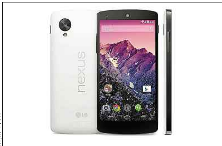
Le Nexus 5 est Full HD et compatible avec les réseaux 4G/LTE.

Là où la firme de Mountain View risque de secouer le marché, c'est en proposant un smartphone haut de gamme à partir de 349 € sans contrat. Le Nexus 5 est par exemple deux fois moins cher que l'iPhone 5S 16 Go à 700 €.