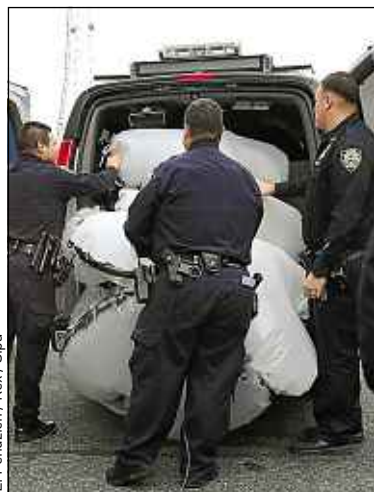
Les ballons installés par Banksy sont embarqués par la police.

Le New York Post dénonce une fausse subversion et s'étonne : « Comment a-t-il pu faire tout ça sans jamais être découvert ? » Village Voice voit Banksy comme un artiste banal qui se déguise en « casse-cou des rues » pour asseoir sa notoriété. Le New York Post regrette également que Banksy ne « laisse aucune œuvre assez grandiose pour mériter une préservation, rien de comparable au graffiti Crack is Wack de Keith Haring sur Harlem River Drive. » Comme le Post , de nombreux médias new-yorkais estiment que Banksy a une « vision de touriste » de la ville dont il n'a pas su percer l'âme complexe. ■