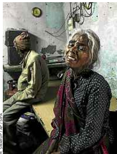
La mère de l'accusé, en pleurs, lundi.