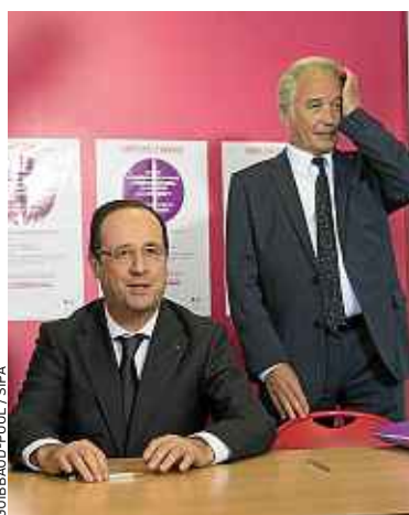
François Hollande a été reçu par le maire de Dijon, François Rebsamen.

En inaugurant ses déplacements de deux jours à Dijon (lire ci-dessous), Hollande voulait revenir au contact des Français, se « réimmerger » dans le territoire. Ses premières heures dans un quartier populaire l'ont plongé dans une France en crise. Bises aux enfants, coucou aux habitants et sourires en rafales. Les moments chaleureux de la présidentielle n'ont pas tout à fait disparu : « Franchement, continuez... »,