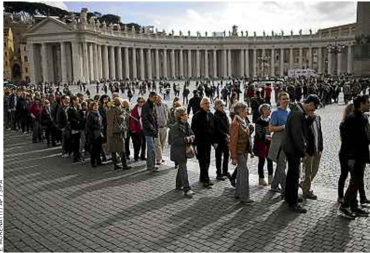
Des touristes font la queue, lundi, devant la basilique Saint-Pierre.