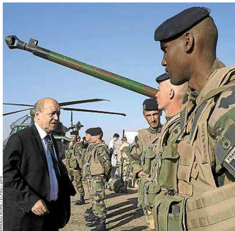
Jean-Yves Le Drian (ici au Mali le 7 mars) reste prudent sur les délais.