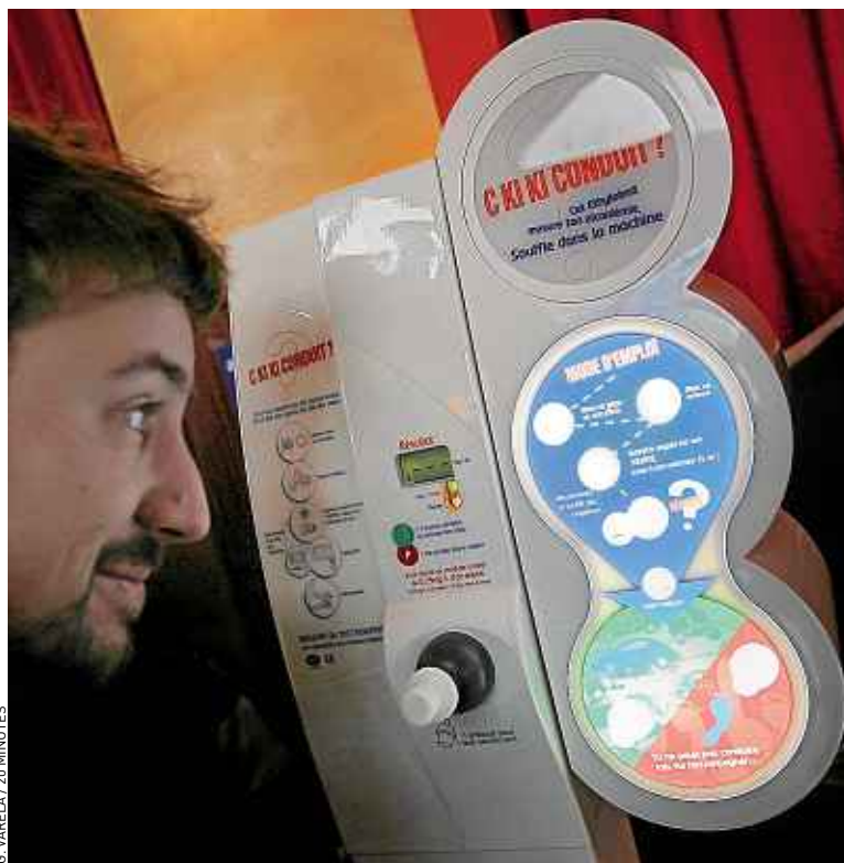
Les alcoolbornes peuvent être utilisées gratuitement par les étudiants fêtards.