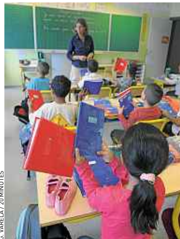
T.C. La réforme pose problème. (archives)

conditions de travail des enseignants, les rythmes des enfants et de leurs parents et les activités périscolaires. Au conseil général du Bas-Rhin, qui recense les options retenues par les communes, on indique que toutes celles qui ont pris position à ce jour ont opté pour le report. « Celles qui appliqueront la réforme en 2013 se compteront sur les doigts d'une main », anticipe Olivier Studer, conseiller technique au cabinet du président. En termes de transports scolaires, le surcoût est estimé à 750 000 € en 2014. ■