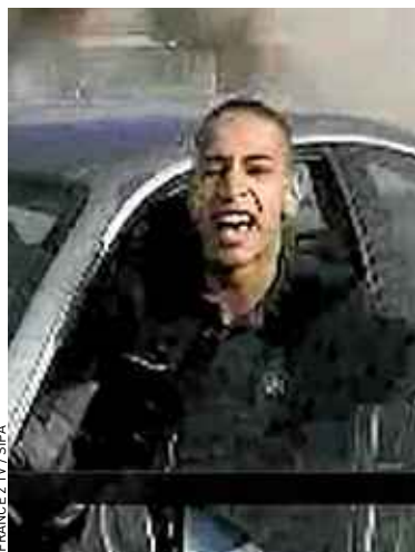
Le groupe interpellé à Marignane glorifiait Mohamed Merah.

La mission des policiers et juges anti-terroristes s'est complexifiée, selon le magistrat, à cause notamment de la « diversité » des types d'individus interpellés. « Ce qui ressort des enquêtes (...), c'est qu'il n'existe pas de profil type du djihadisme radicalisé » en France, a introduit François Molins. Familles déstructurées ou correctement ancrées dans la société, étrangers, Français, binationaux, musulmans ou convertis... Le groupe de Marignane,