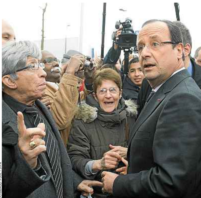
François Hollande s'est rendu lundi dans le quartier des Grésilles, à Dijon.