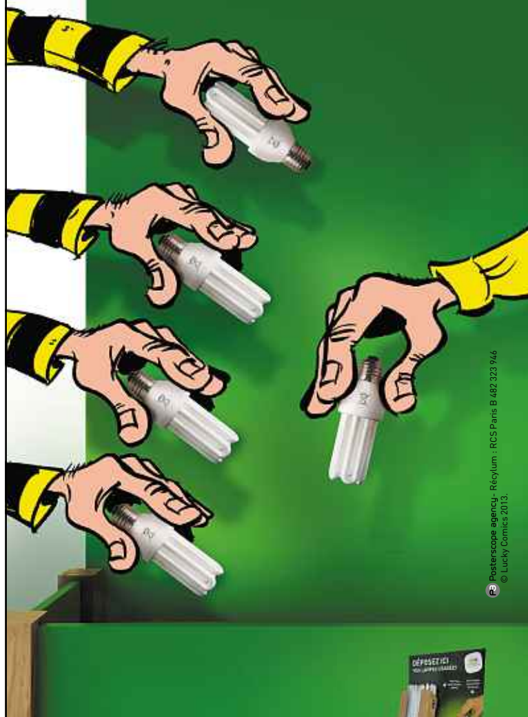
Posterscope agence - Recylum - RCS Paris B 482 323 946.

RECYCLER SES LAMPES, TOUT LE MONDE S'Y MET.