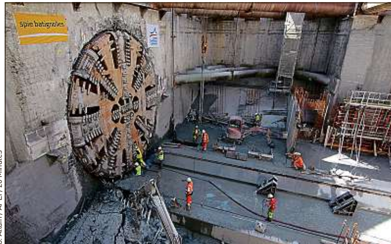
Le tunnelier a creusé 5,1 km (60% du tracé total) et redémarrera le 4 avril.