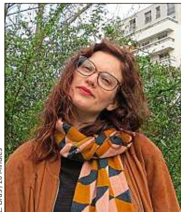
L. Bras / 20 Minutes

nous dise qu'on peut se sauver par nous-mêmes grâce à un comportement citoyen. Et ça commence en essayant d'être fidèle à nos idées. Je boycotte le plus possible les grandes filiales et multinationales alimentaires ou l'industrie de la mode... Je n'ai pas beaucoup d'argent, mais je ne veux pas en donner à des gens qui s'enrichissent sur l'exploitation des plus fragiles dans le monde. » ■ Propos recueillis par Lucie Bras, à Paris