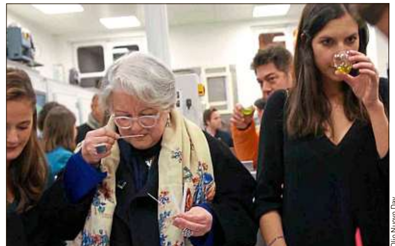
Les connaisseurs dégustent les huiles d'olive nouvelles.

L'huile d'olive nouvelle, c'est comme le beaujolais : elle arrive fraîche et pimpante, tout juste extraite de la première cueillette de l'hiver 2016. Cette huile primeur est appréciée des connaisseurs qui la distinguent au nez ou à la robe (on parle de fruité vert, de fruité noir...) et la dégustent comme on le fait d'un vin.