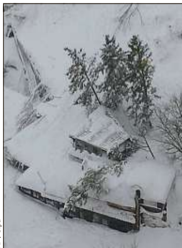
L'hôtel Rigopiano, près de Farindola.

une élégante structure de trois étages située près de Farindola. Deux victimes en hypothermie ont été secourues à l'extérieur et deux cadavres ont été extraits des décombres. Sous la puissance de l'impact, l'hôtel