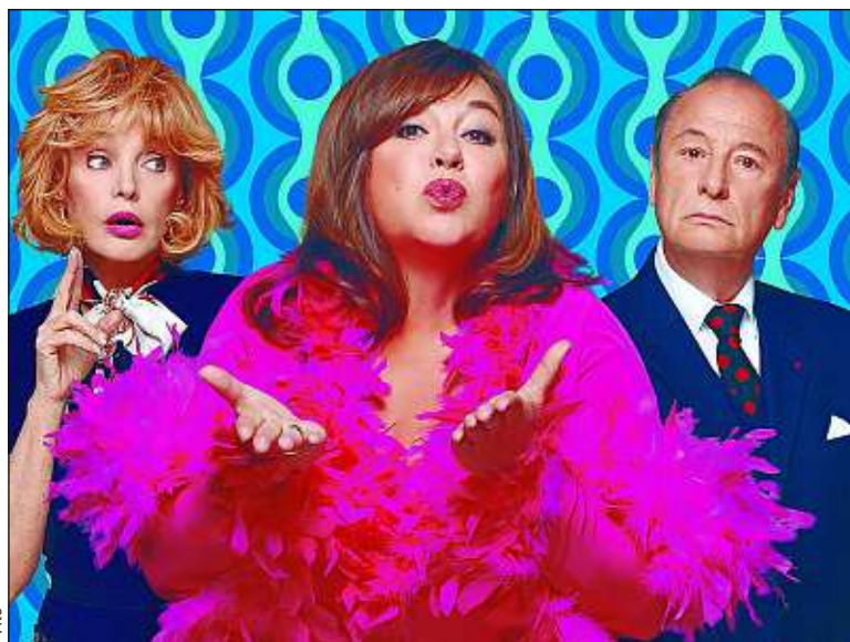
Arielle Dombasle, Michèle Bernier, Patrick Braoudé dans Folle Amanda .

Au casting de Folle Amanda , les téléspectateurs retrouveront Michèle Bernier, Arielle Dombasle ou encore Patrick Braoudé. Côté texte, quelques coupes ont été effectuées pour dépoussiérer l'ensemble, dans son jus des années 1970, mais aucune scène n'a été supprimée. Enfin, cerise sur le gâteau pour ceux qui ne jureraient que par « Au théâtre ce soir », les acteurs énonceront à la fin de la pièce la célèbre tirade « les décors sont de... et les costumes de... ». C'est dans les vieux pots qu'on fait les meilleures confitures.