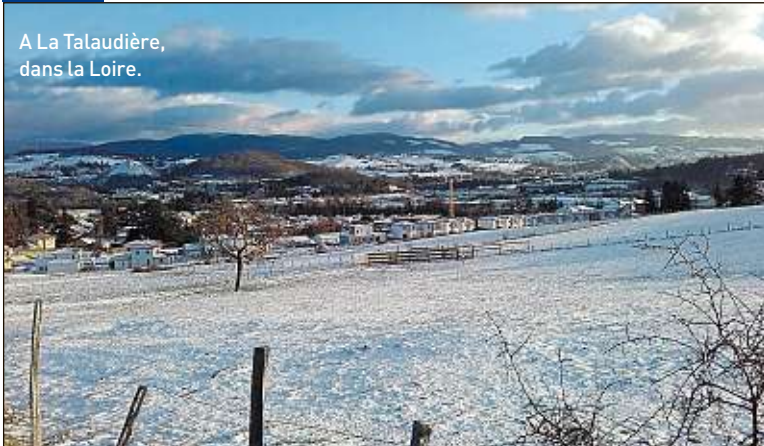
A La Talaudière, dans la Loire.