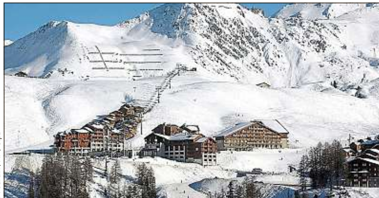
La vallée contient tous les équipements pour faire du sport d'hiver.

Révolue cette période où les plus blasés boudaient l'urbanisme populaire de Plagne-Centre, premier site dans cet immense territoire qui compte désormais 10 sites d'altitude, construits progressivement jusqu'en 1990 et tous reliés entre eux. Les appréhensions architecturales se sont dissipées, et