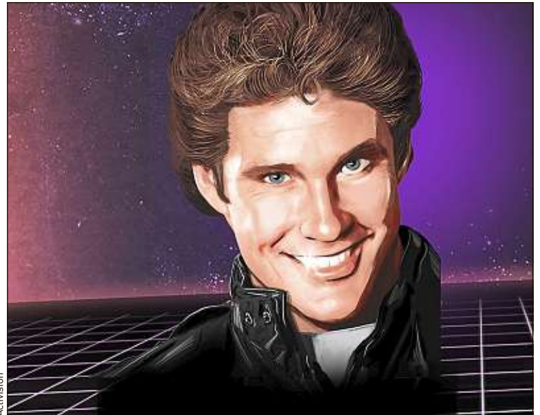
Le personnage ressemble à David Hasselhoff époque « K2000 ».

Ce mode coopératif déjanté d'« Infinite Warfare », quasiment un jeu dans le jeu, se déroule dans un parc d'attractions furieusement années 1980. Au menu : ambiance néon glauquissime, zombies sapés comme votre arrière-tante, quelques flingues rouillés et vous, une bande de quatre stéréotypes (le geek, la bimbo, le sportif et le rappeur). Qui de mieux que l'acteur pour incarner le rétro eighties et appâter le trentenaire nostalgique ? « Les créateurs m'ont laissé une grande liberté, détaille David Hasselhoff. J'ai pu tester mes différentes voix et "hoffismes", comme "Hofftastic!" et "To Hoffinity and beyond!" »