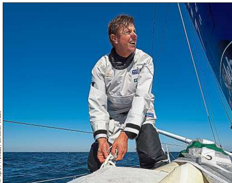
A. Pipre / Y. Zezda / StMichel-Virbac

L'avantage, quand on a traversé toutes ces épreuves, c'est qu'on se blinde avec le temps. « Vous devenez stoïques, vous êtes capables de réparer des choses facilement et vous savez comment gérer ces situations plus facilement », analyse Dick. Ce dernier voit néanmoins dans son expérience de poissard un tout