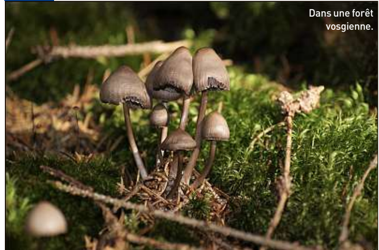
Dans une forêt vosgienne.