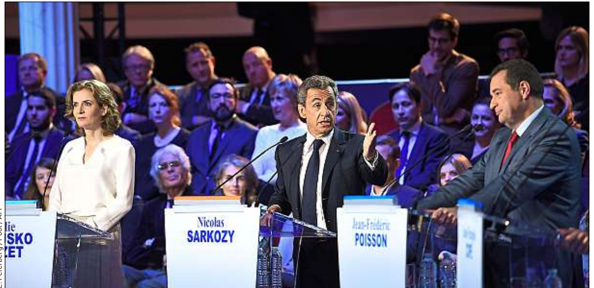
Nicolas Sarkozy a dû expliquer, notamment, pourquoi il avait supprimé des postes de gendarmes et de policiers.

Alain Juppé a embrayé en demandant de « dénoncer les accords du Touquet ». Ce à quoi a répondu Nicolas Sarkozy : « Ce n'était pas l'accord du Touquet mais l'accord de Canterbury. Tout le monde n'est pas obligé de connaître exactement le dossier. » Bruno Le Maire, dès le deuxième sujet, à savoir l'idée que se font les candidats de la fonction de président, a indiqué vouloir être honnête. « Honnête, ça veut dire