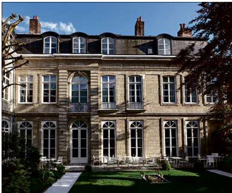
Clarence Hôtel Lille