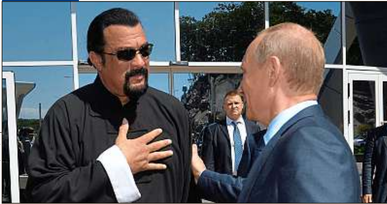
Steven Seagal et Vladimir Poutine à Vladivostok, le 4 septembre 2015.

On connaissait l'amitié qui liait Vladimir Poutine à Gérard Depardieu. Mais le dirigeant russe a un autre admirateur parmi les acteurs : Steven Seagal. En signe de reconnaissance, l'ancienne vedette du cinéma d'action hollywoodien vient de se voir accorder la nationalité russe. Grand spécialiste d'aïkido, Steven Seagal a rencontré ces dernières années à de nombreuses reprises l'amateur de judo, Vladimir Poutine. Il s'est rendu régulièrement à Moscou et a défendu