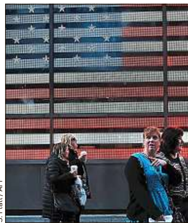
A quatre jours de l'élection américaine, les sondages divergent.

De notre correspondant aux Etats-Unis, Philippe Berry