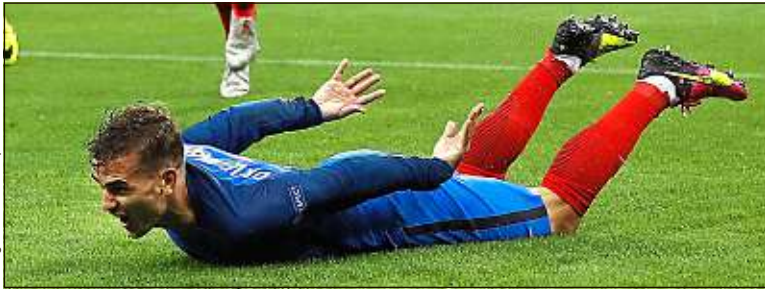
Faites un peu de sport pour ne pas stresser avant le match de Grizou.

Six heures, le réveil hurle. La sueur a trempé vos draps, la nuit a été courte. Vous n'avez qu'une chose en tête : le match des Bleus face à l'Allemagne. Il va pourtant falloir patienter, pointer au bureau et se coltiner les collègues. Pour vous aider à gérer le stress, 20 Minutes a enquêté.