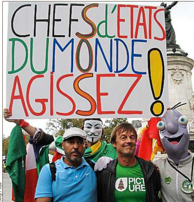
Nicolas Hulot, lors de la Marche citoyenne pour le climat à Paris en 2014.

Déjà bien mal en point après les départs des députés pro-gouvernement, la dissolution du groupe écologiste à l'Assemblée et l'affaire Baupin, EELV s'obs-