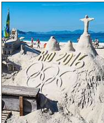
Les Jeux commencent le 5 août.