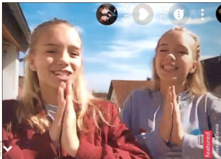
Ces jumelles allemandes comptent 5 millions de fans parmi les ados.