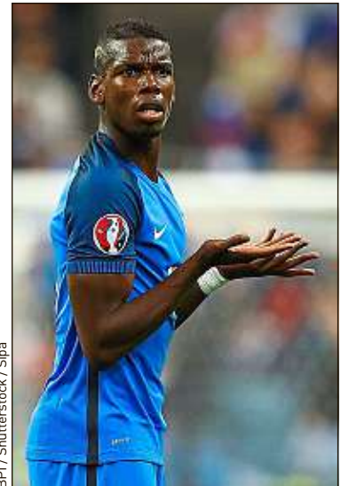
Paul Pogba « muscle son jeu ».