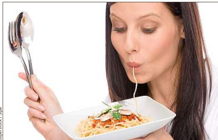
Vous ne verrez plus vos spaghettis de la même façon...

conclusions, publiées dans la revue scientifique Nutrition & Diabetes . Les deux études menées par les spécialistes ont observé les habitudes alimentaires de 23 000 sujets. « On pense généralement que les pâtes ne sont pas idéales pour perdre du poids. Certains arrêtent même complètement d'en manger. (...) Nos recherches ont montré que rien ne justifie cette réaction, il n'y a aucune raison de s'en passer », a ainsi résumé l'une des responsables de l'étude. ■