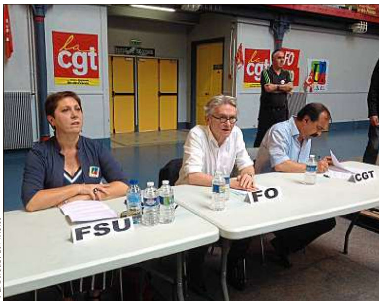
Bernadette Groison (FSU), Jean-Claude Mailly (FO) et Philippe Martinez (CGT).

► L'autosatisfaction : « C'est assez inédit qu'on fasse une manifestation un 5 juillet, et elle était importante. » La manifestation de mardi, la 12 e depuis le début du mouvement en mars, est, selon Philippe Martinez, un succès. Selon les chiffres des autorités, cette dernière mobilisation avant la trêve estivale est plutôt un échec : 30 000 personnes auraient défilé dans toute la France, soit deux fois moins que lors de la manifestation précédente, le