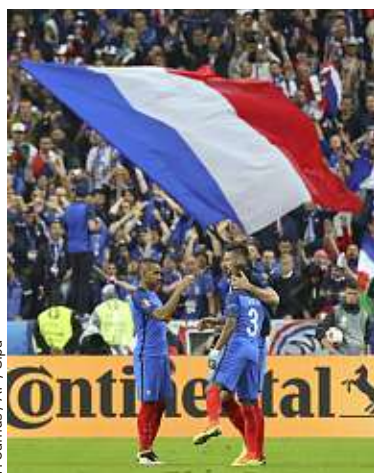
Des millions de Français suivront encore les Bleus ce jeudi soir.

Les deux humoristes-youtubers prennent le contrôle des réseaux sociaux de 20 Minutes sport pour la demi-finale France-Allemagne.