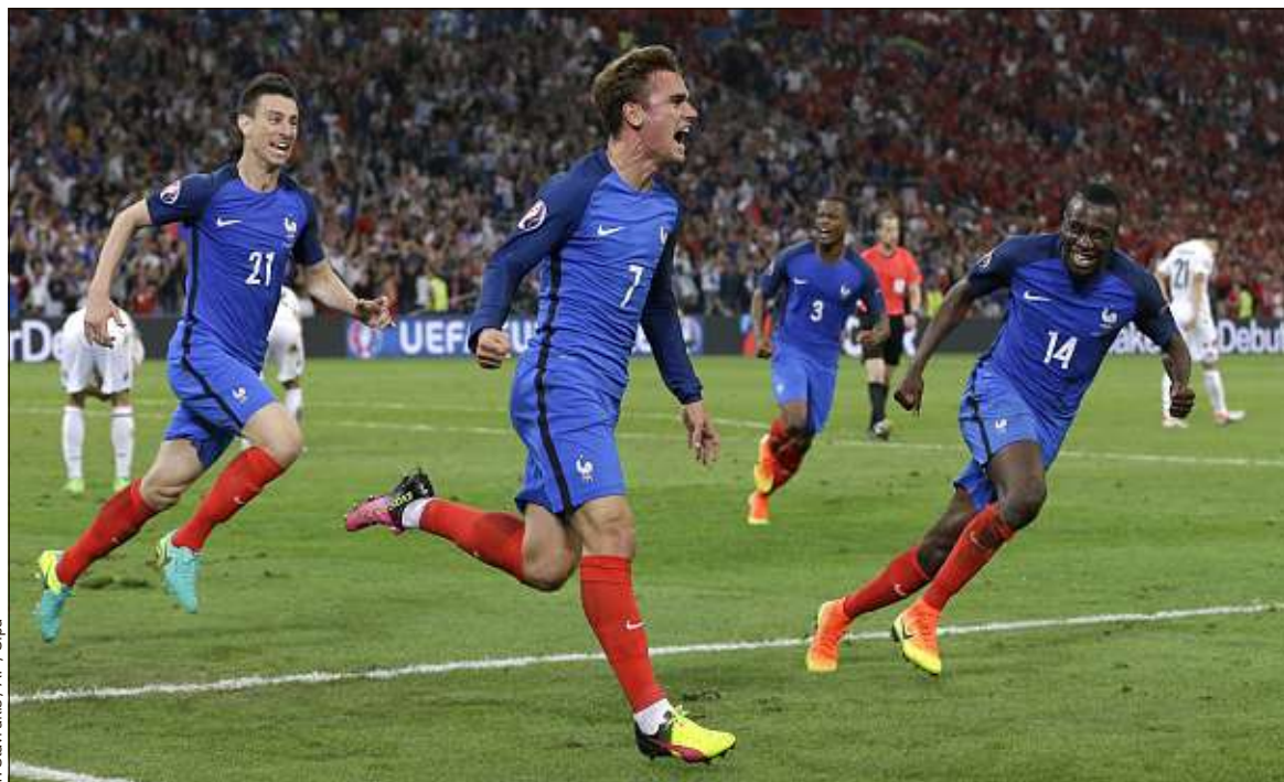
Antoine Griezmann et ses coéquipiers nous préparent quelque chose de grand ce jeudi soir au Stade-Vélodrome.

► Parce que Sissoko. Moussa notre dieu, Moussa notre amour éternel, Moussa notre idole, Moussa notre Messi tricolore, Moussa notre démonstrateur de défenseurs adverses, Moussa notre guide spirituel, Moussa notre gourou du temple solaire, Moussa notre Grand Timonier, Moussa et son visage projeté en grand sur l'Arc de triomphe, c'est pour bientôt.