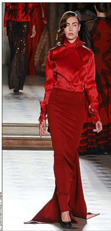
L. Benhamou / Sipa