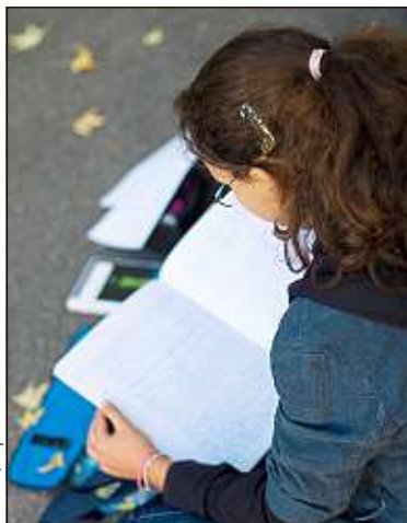
Ils sont 840 000 collégiens à avoir passé le brevet cette année.