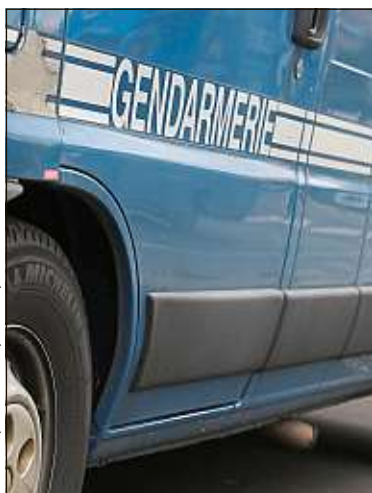
Les faits se sont produits lundi.

Samedi, vers 21 h, un piéton qui passait cours Berriat à Grenoble, a reçu un tir de plomb en plein front. Le tireur de 20 ans, armé d'un pistolet à air comprimé, qui s'amusait à viser les passants depuis son balcon, a été interpellé. Le passant s'est fait retirer deux plombs du visage.