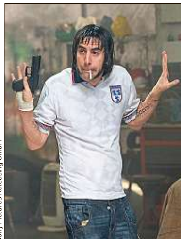
Sony Pictures Releasing GmbH

Le comédien britannique revient dans Grimsby - Agent trop spécial .