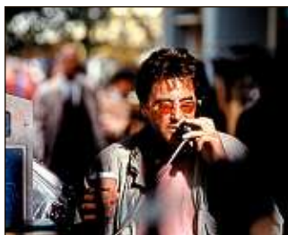
Gaumont Buena Vista International

Révélation , avec Al Pacino, sera projeté samedi (14 h 15).