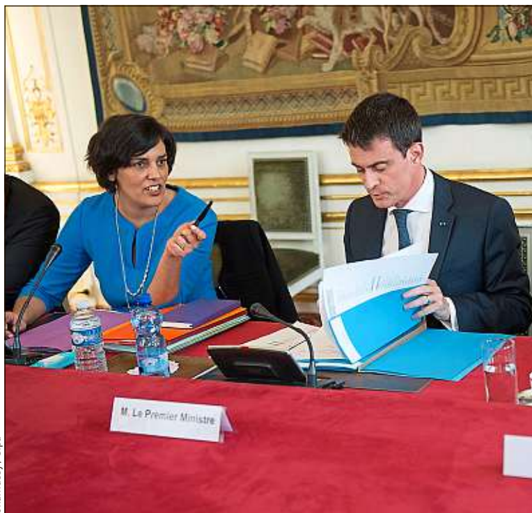
Le gouvernement a présenté aux syndicats le projet modifié.

► Accords limités. Le projet de loi « corrigé » réduit le champ laissé aux décisions unilatérales des chefs de