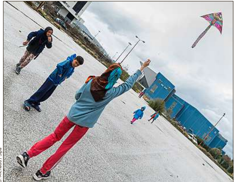
Des cerfs-volants ont été distribués aux enfants réfugiés.