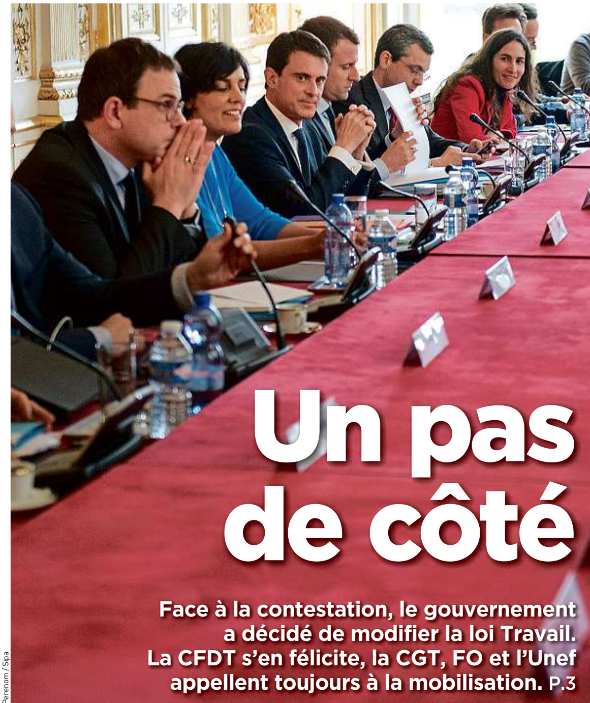
Perenom / Sipa