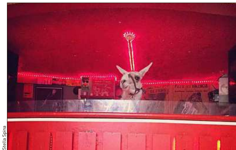
Le lama Paco derrière les platines de la Churascaia (Gard), samedi soir.