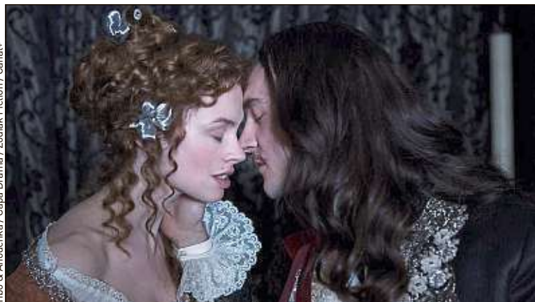
Le roi Louis XIV en compagnie de sa maîtresse dans la série « Versailles ».