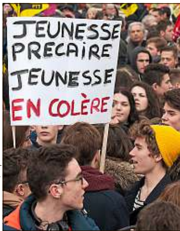
Des organisations de jeunesse appellent à une manifestation jeudi.

Une fusée Proton a décollé lundi matin de Baïkonour (Kazakhstan), embarquant à son bord les deux modules de la première mission ExoMars, dans le cadre d'un programme russo-européen. La sonde TGO, l'un des modules, détectera la présence de gaz à base de carbone, comme le méthane.