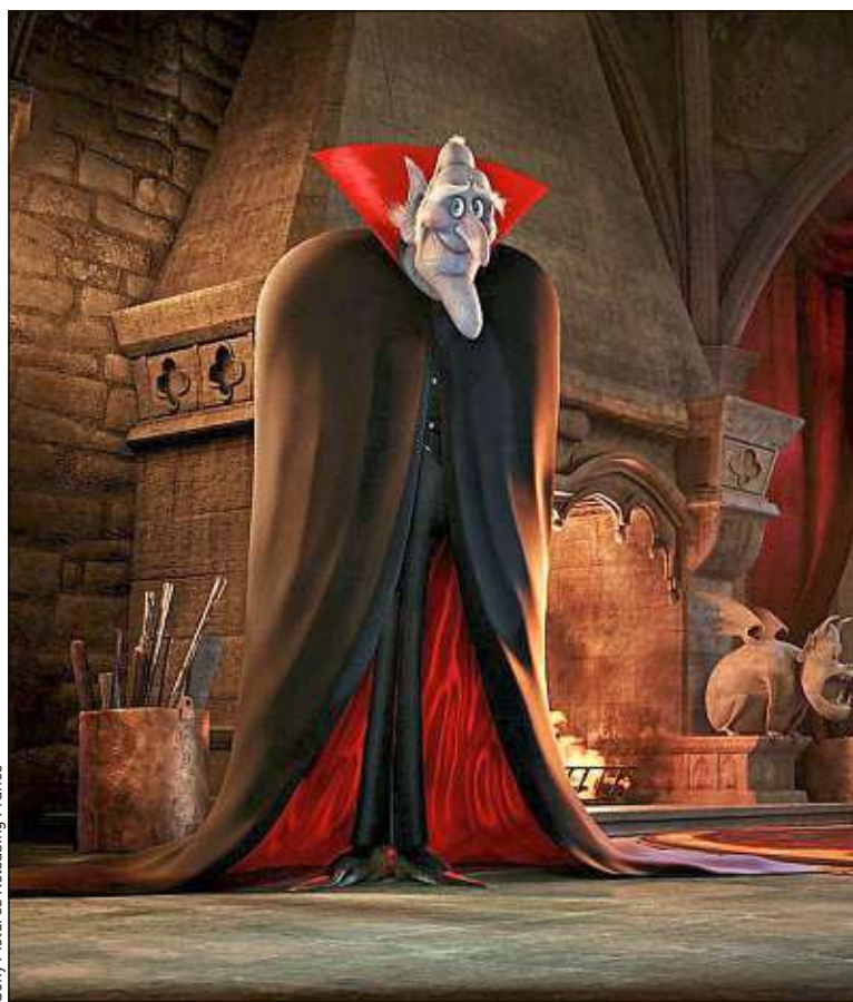
Les mouvements de cape peuvent se faire à partir de n'importe quel tissu.

► Les ailes des chauves-souris. Quelques jolis moments du film viennent quand les chauves-souris vampires prennent leur envol. Un son bien particulier pour lequel on se sert notamment de cuir et de gants en caoutchouc, des trucs ingénieux, mais qui ne doivent pas empêcher les apprentis ingénieurs du son d'innover à leur tour. ■