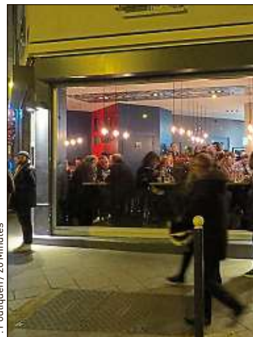
Il y avait foule le premier soir.