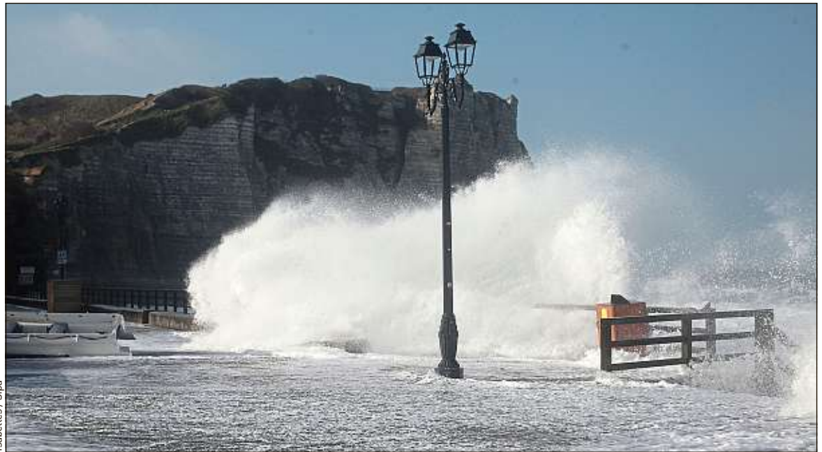
Sur les côtes normandes (ici à Etretat), les vents ont atteint 140km/h et les vagues plusieurs mètres de haut.

➤ Un insouciant à La Rochelle. Alors que la tempête battait son plein, un plaisancier imprudent a voulu effectuer une sortie dans son bateau avec son fils. Il a évidemment dû rebrousser chemin à cause de la météo. Mais il s'est entêté à retourner, seul cette fois, à bord de ce semi-rigide de 5,50 m, pour récupérer une écope, perdue dans la tempête, rapporte Sud-Ouest . La houle