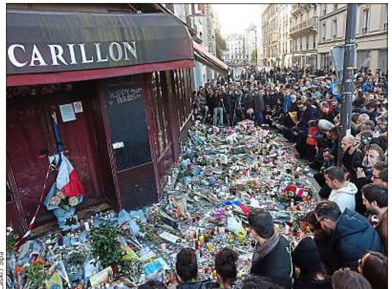
Certains élèves pensent que les attentats de novembre ont été fomentés par le gouvernement pour appliquer une politique sécuritaire.

Selon lui, il n'existe pas de profils plus susceptibles de tomber dans le panneau : « Certains de mes élèves éprouvent une certaine fierté lorsqu'ils ont l'impression de connaître une pseudo-vérité que les autres ne connaissent pas. Etre bon élève ne protège pas de la mauvaise interprétation de l'actualité, car il faut des compé-