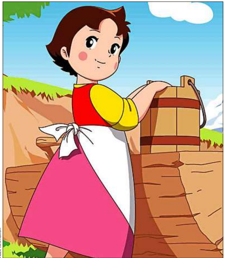
Heureuse à la montagne, Heidi finit dépressive dans une grande ville.

Les orphelins, de Princesse Sarah à Tom Sawyer en passant par Belle et Sébastien et Rémi sans famille , sont récurrents dans les histoires pour enfants. L'histoire de Candy , c'est avant tout celle d'une gosse abandonnée le soir de Noël, qui grandira dans un orphelinat. La mort de son béguin, Anthony, d'une chute de cheval est tellement violente, choquante et brutale qu'au moment de la première diffusion en 1979, les parents écrivent à « Récré A2 » pour se plaindre. Dorothee, la présentatrice, annonce qu'Anthony n'est pas mort, mais grièvement blessé, cloué sur un lit d'hôpital... Antenne 2 modifie donc le scénario, et le doublage, rendant l'histoire incompréhensible. ■