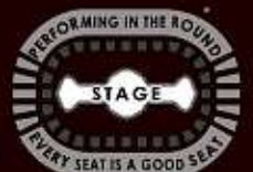
SCENE CENTRALE - CHAQUE PLACE EST UNE BONNE PLACE