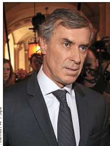
Jérôme Cahuzac au tribunal lundi.