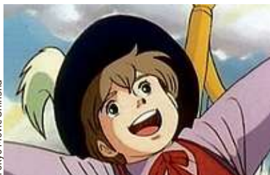
Tokyo Movie Shinsha

Ces dessins animés traumatisants pour les enfants P.8