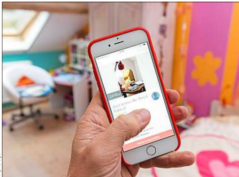
Airbnb est l'une des plateformes stars de l'économie collaborative.

D'abord, il me semble que ce rapport ne parle que de l'économie des échanges de services et de propriété, alors qu'il y a plusieurs économies collaboratives, dont une qui crée de vraies ressources partagées, les « communs ». Ensuite, ce rapport rappelle que des aspects de mutualisation des biens et des infrastructures sont une bonne chose pour l'écologie, et qu'elle peut permettre des revenus supplémentaires pour certains. En disant que les acteurs doivent être régulés et fis-