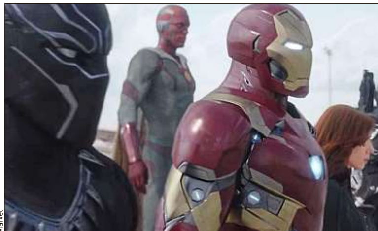
En 2016, les super-héros devront choisir entre Captain America et Iron Man .

20minutes.fr). Les sagas Marvel étaient à l'honneur, avec les sorties de Captain America : Civil War et X-Men : Apocalypse . Alors que Disney présentait son nouveau Livre de la jungle en prise de vue réelle, il y avait un parfum de fin du monde dans le stade avec Independence Day : Resurgence , vingt ans après le premier épisode. Matt Damon faisait aussi son retour dans Jason Bourne . ■