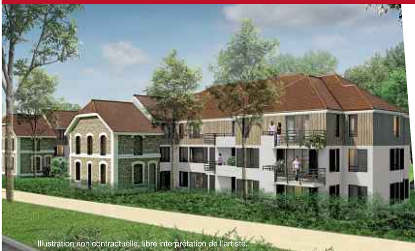
Illustration non contractuelle, libre interprétation de l'artiste.

La Rentrée à prix barrés ! Du 1 er au 30 septembre 2015