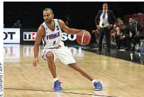
E. Dunand / AFP

Les Français passent l'obstacle letton et retrouveront l'Espagne en demie P.22