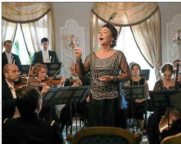
Concordia Filmverleih GmbH

Délaissée par son mari (André Marcon, formidable), secrètement moquée par ses proches, l'héroïne se persuade qu'elle doit se produire sur la scène de l'Opéra avec l'aide d'un professeur incarné par le fantastique Michel Fau. Ce