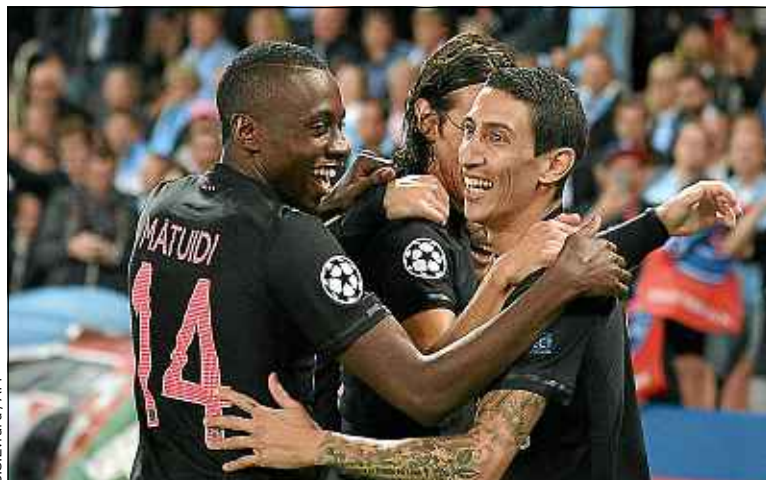
Di Maria a inscrit le premier but de la Ligue des champions 2015 - 2016.

Ne faisons pas les difficiles : l'Argentin est décidément un superbe joueur de foot, en tout cas celui qui manquait au PSG. Son but, déjà, était plus facile à mettre à côté qu'en lucarne (4 e ), il aurait sans doute suffi que cela tombe sur Cavani pour se faire, d'ailleurs. L'Uruguayen a beaucoup raté, et il a fallu qu'Ibra sorte son seul geste inspiré de la soirée, une aile de pigeon bien sentie dans le prolongement d'un centre de Maxwell, pour que « le Mata-