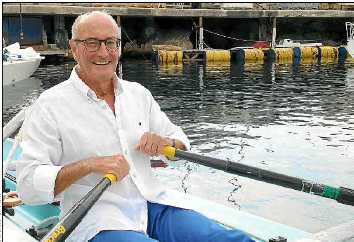
C. Nertens / 20 Minutes

Dans sa dernière phase d'entraînement avant l'épreuve d'octobre, Jacques affûte