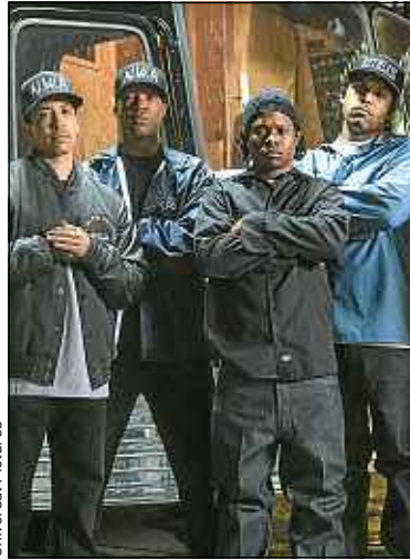
Les acteurs du film.

» « Le message est toujours d'actualité. » Michael Bay, réalisateur et producteur de la saga « Transformers », a adoré le film et n'a pas été surpris par son succès. « Les gens se souvenaient de N.W.A. Ceux qui avaient 20 ans quand ils les écoutaient ont maintenant une quarantaine d'années et sont ravis de retrouver leur jeunesse dans ce film, affirme-t-il. Et le message des chansons est toujours d'actualité. » » « Les producteurs ont su gérer le buzz. » Nicolas Gonda, producteur