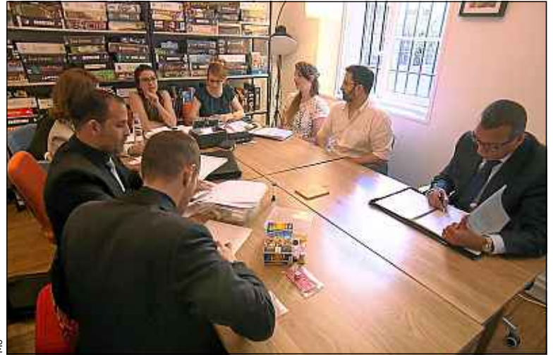
L'émission a réalisé une audience décevante lors de sa première diffusion.