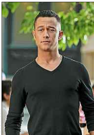
Dans le film Don Jon , Joseph Gordon-Levitt est accro au porno.