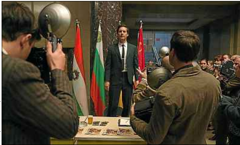
Metropolitan Film Export