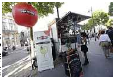
Ma Terrazza / Martini

Jusqu'au jeudi 24 septembre, les Piaggios Bars Ma Terrazza au look vintage investissent les terrasses parisiennes. Un air de trattoria à l'italienne vous fera revivre l'esprit de l'aperitivo. Les Bars seront installés pour apporter une touche d'Italie aux établissements à travers des cocktails à base de Martini à 5 €. Pour poursuivre la soirée, rendez-vous au Wanderlust, où la soirée Ma Terrazza battra aussi son plein, à coups de DJ sets : Get a Room à 18 h, Natas Loves You à 21 h, Yuksek à 22 h, Dimitri From Paris à minuit.