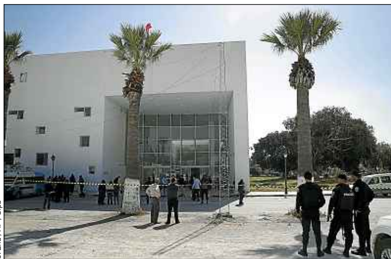
Le musée du Bardo, où a eu lieu l'attaque, est le plus prestigieux de Tunisie.

Le musée du Bardo à Tunis, visé par l'attentat, rouvrira mardi au plus tard, a annoncé jeudi le ministre de la Culture. Mitoyen du Parlement, le bâtiment abrite des collections couvrant la préhistoire et les époques phénicienne, punique, numide, romaine, chrétienne et arabo-islamique. Il est notamment connu pour son exceptionnelle collection de mosaïques, dont la pièce maîtresse est Le Triomphe de Neptune , œuvre monumentale du II e siècle.