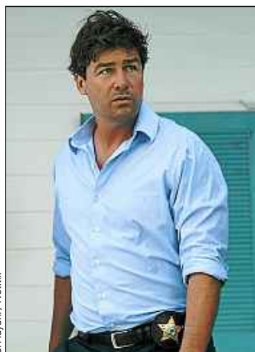
S. Aoyama / Netflix

C'est le second fils d'une famille de quatre enfants. Il a le sens du devoir et veut résoudre tous les problèmes entre frères et sœurs. Mais il commence à se demander qui il est et ce qu'il a envie de faire. Ce n'est pas forcément quelqu'un de bon au fond... Je suis très excité car mon personnage doit évoluer sur six saisons [déjà imaginées par les créateurs] pour devenir un personnage que je n'ai encore jamais joué.