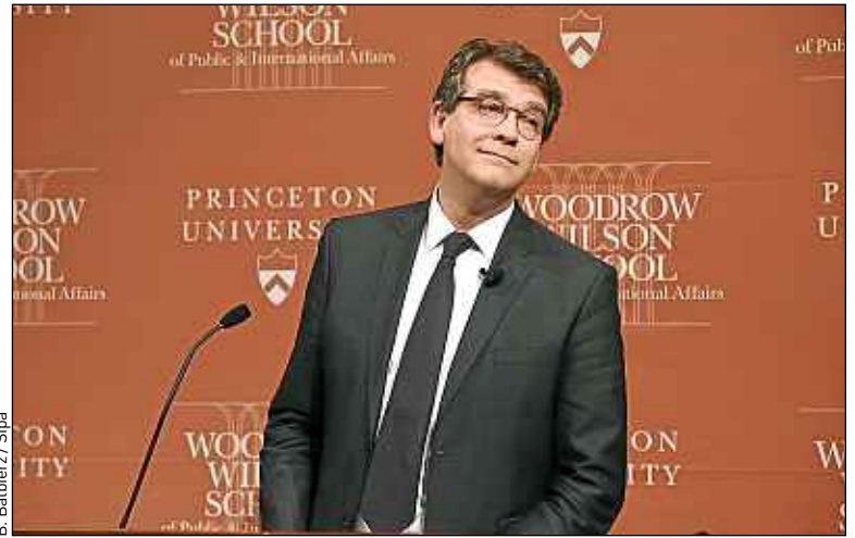
L'ex-ministre de l'Economie fin février lors d'une conférence à Princeton (Etats-Unis).

vous confirme [qu'il] arrive en tant que vice-président chez Habitat. A priori, cela prend effet dès [jeudi] », a indiqué un représentant de l'enseigne Habitat, confirmant une information du Monde . L'ancien ministre sera désormais en charge de l'innovation, a poursuivi Cafom, la maison mère d'Habitat. Cette stratégie vise à imposer durablement la marque comme un porte-drapeau de l'excellence française en matière de design. ■