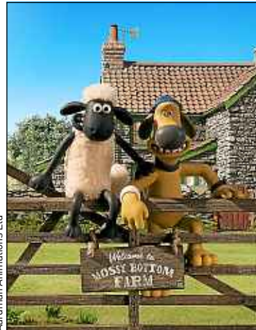
Aardman Animations Ltd