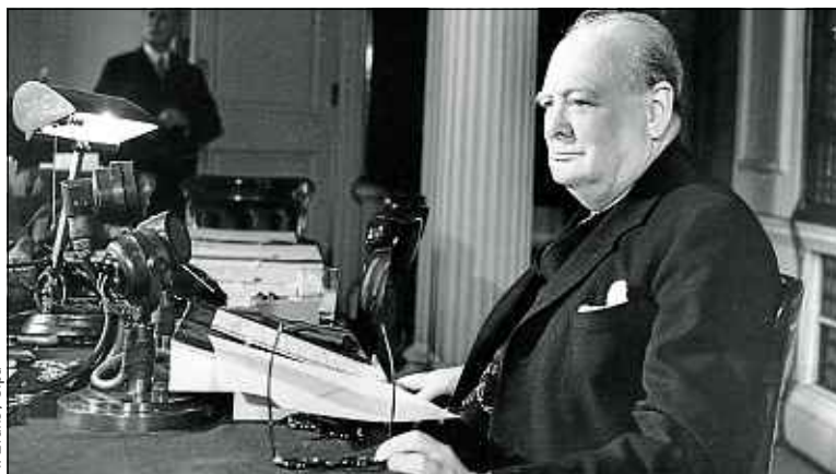
M. Evans / Sipa

A l'occasion du cinquantenaire de la mort de Winston Churchill, pourquoi ne pas se rendre en Grande-Bretagne sur les traces du célèbre homme politique ? On commence par Blenheim Palace, non loin d'Oxford, où naquit en 1874 ce descendant du duc de Marlborough (celui de la fameuse chanson). Le magnifique château abrite de nombreux souvenirs, dont ses dessins et ses tableaux, ainsi que l'ensemble de ses discours. Ne manquez pas de visiter les splendides jardins, parmi les plus beaux du pays.