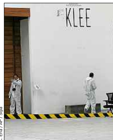
Des enquêteurs dans le musée.

► La revendication de Daesh. L'organisation de l'Etat islamique a revendiqué l'attentat, selon un message audio diffusé jeudi sur Internet. Le groupe djihadiste, qui sévit en Syrie, en Irak et en Libye, a menacé la Tunisie d'autres attaques, affirmant qu'il ne s'agissait que « du début ». ■ C. Q.