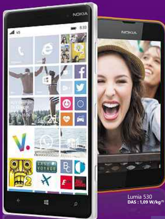
Lumia 830 DAS : 0,46 W/kg (1)

UN LUMIA 530 OFFERT* pour l'achat d'un Lumia 830