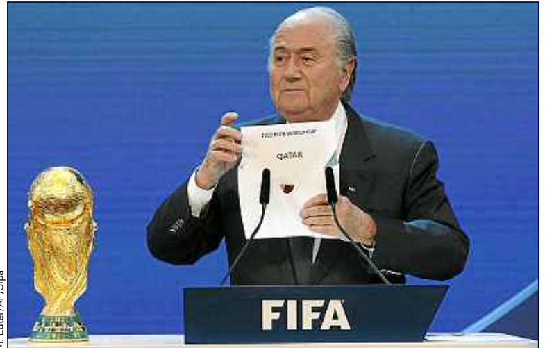
Sepp Blatter, le patron de la Fifa, lors de l'attribution du Mondial au Qatar.

La Fifa a donc suivi les recommandations du groupe de travail de l'instance du football mondial, qui militait pour que la compétition ait lieu en hiver, afin d'éviter les fortes chaleurs estivales, parfois supérieures à 50 °C. Mais ce n'est pas forcément la fin du feuilleton. Les clubs sont en effet très inquiets du calendrier qui va découler de ce Mondial, qui sera ramassé sur 28 jours et qui débutera le 21 novembre. Une période à laquelle les championnats eu-