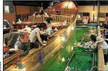
Le restaurant Zauo à Tokyo.

► Prenez la place de Jamie Oliver. Quand le cuisinier star de la télé anglaise décide d'ouvrir une épicerie, il se doute que les clients lui demanderont des conseils. D'où l'idée de proposer des ateliers dans la pièce d'à côté. Chez Recipease, à Londres, vous choisissez le plat ou le tour de main que vous souhaitez améliorer, du moment que les