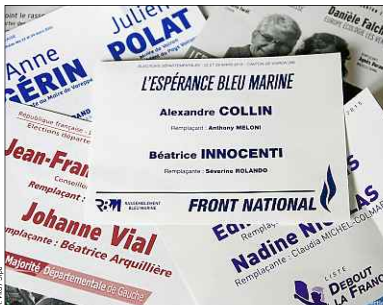
Des bulletins de vote pour le canton de Voiron, en Isère.

En cas de duel FN-PS ou FN-UMP au second tour, les sondés sont partagés. Si l'UMP est éliminée, ils attendent de ce parti, à 41 %, un appel à voter pour la gauche et, à 39 %, aucune consigne de vote. Si le PS est éliminé, 45 % des Français préféreraient un appel à voter pour la droite et 40 % aucune consigne.