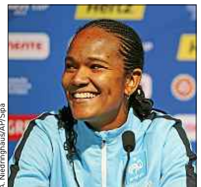
« C'est une immense joie », a réagi Wendie Renard, capitaine des Bleues.

Ce sera une première. La France organisera en 2019 le Mondial de football féminin , a annoncé jeudi la Fifa. Une compétition qui doit permettre de confirmer définitivement l'installation de la discipline dans le paysage sportif français. « C'est une immense joie et une fierté de pouvoir évoluer à la maison pendant une Coupe du monde, s'est félicitée Wendie Renard, capitaine et arrière centrale des Bleues. Bien sûr, ça rappelle des souvenirs, on pense forcément à France 98. »