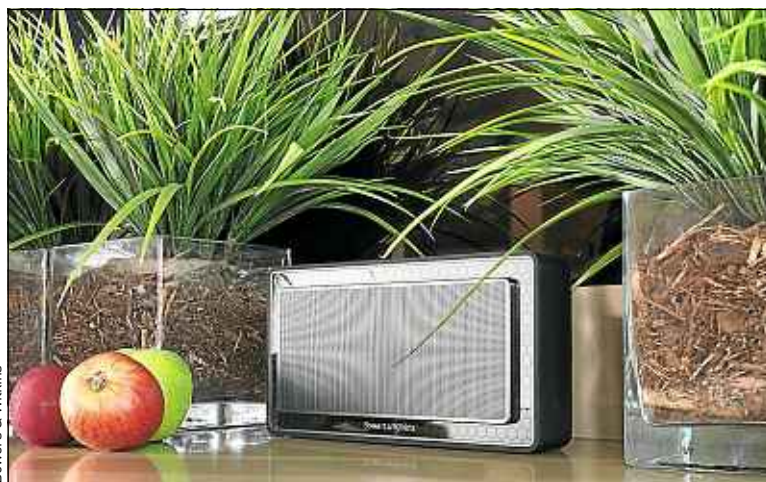
La construction en nids d'abeille de la T7 évite les distorsions, selon la marque.

la hi-fi en balade, la marque anglaise, dont les enceintes équipent les célèbres studios Abbey Road à Londres, réclame 349 € pour sa T7, ce qui nous semble pour le moins excessif. D'autant que la petite enceinte n'est pas exempte de lacunes : elle ne dispose notamment pas du NFC, ce qui, en 2015, fait un peu fausse note. ■