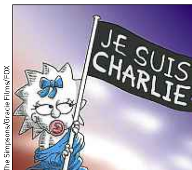
La petite Maggie Simpson (à g.) et le célèbre héros de BD Spirou.