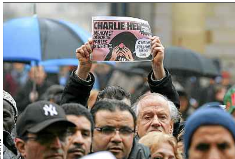
Un homme brandit une caricature à Bordeaux, vendredi.

Notre idée est de commencer par la France et d'essayer de propager ça. Certains Etats font des offensives régulières pour ajouter la diffamation des religions dans leur droit. Que les pensées aient le droit d'éteindre la critique, ce serait totalement funeste.