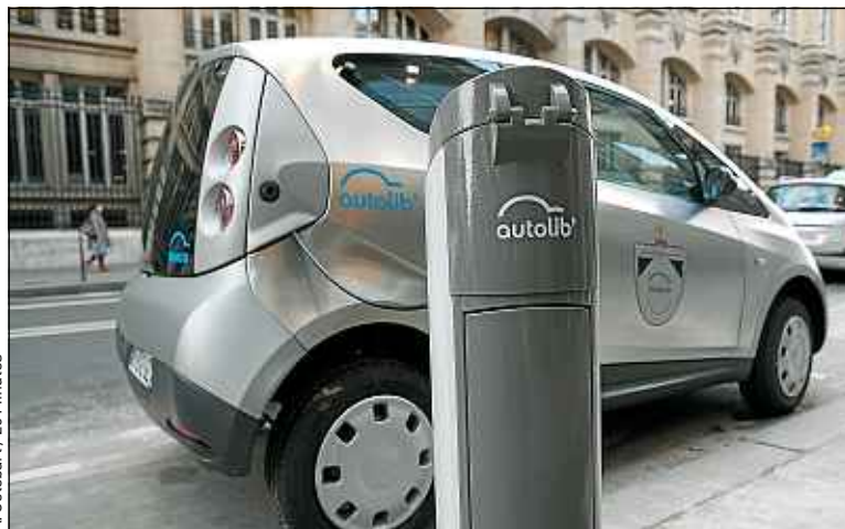
Les nouveaux titulaires du permis obtiendront un an d'abonnement à Autolib'.

► Emploi. Le budget va « soutenir les PME, artisans, commerçants et libérer