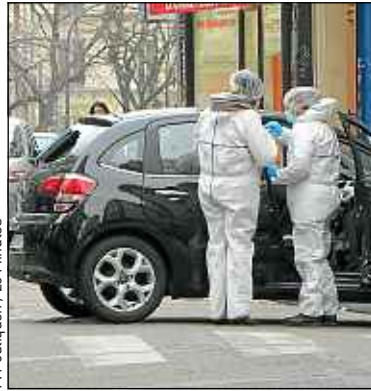
Les agresseurs ont abandonné leur voiture porte de Pantin.

11h30. Un appel à police-secours fait état de tirs au siège de Charlie Hebdo . Des policiers sont dépêchés sur place.