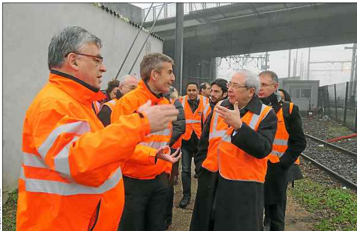
Jean-Paul Huchon (à droite) et plusieurs cadres de la SNCF sont venus assister au démarrage du chantier.

TRANSPORTS L'incendie de l'infrastructure a fortement perturbé le RER C