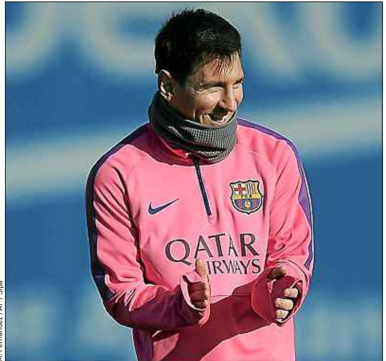
Lionel Messi n'a pas apprécié être remplaçant dimanche.

commencer un match sur le banc. C'est arrivé lundi. « Messi donne l'impression de ne pas avoir mûri. Il ne joue pas donc il fait la gueule, ce sont des colères infantiles. » Infantiles et insupportables, parfois, pour le vestiaire catalan. David Villa, Cristian Tello ou