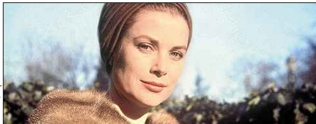
Grace Kelly avait appris à se maquiller à Hollywood.