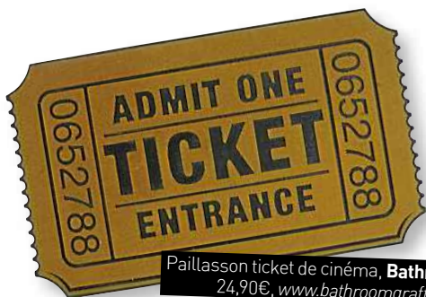
Paillason ticket de cinéma, Bathroom Graffiti , 24,90€, www.bathroomgraffiti.com .