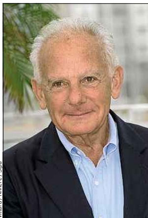
Marin Karmitz, en 2012.