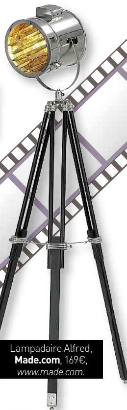
Lampadaire Alfred, Made.com , 169€, www.made.com .