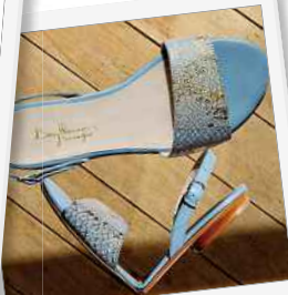
Etre belle partout et tout le temps, tel est le concept de cette marque française.