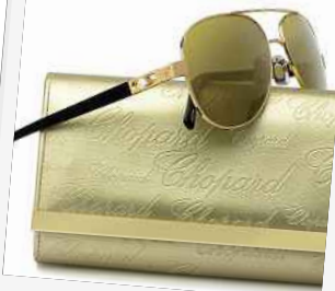
Chopard, partenaire officiel de Cannes, nous propose des bijoux à la hauteur du festival.

bronze. Pour le confort, direction le bateau Arte, ancré dans le port. Les stars s'y précipitent pour récupérer leurs nouvelles alliées : les sandales en cuir Summerfest de Baglierina, entièrement pliables. ■ A. D. www.chopard.fr www.baglierina.com