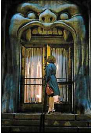
Lost River de Ryan Gosling.

Ryan Gosling attendu Si la critique a été unanimement sévère sur le film, les internautes, eux, ont été plus indulgents. En effet, 60 % des messages au sujet du film ont été neutres, et 7 % négatifs seulement. A la nuance près que les messages pouvaient aussi bien concerner la venue