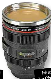
Mug design Paparazzi, La Chaise Longue , 19,90€, www.lachaiselongue.fr .