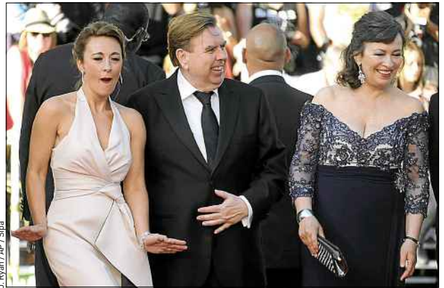
Dorothy Atkinson, Timothy Spall et Marion Bailey (de g. à dr.).

La seconde, Dorothy Atkinson, joue une servante difforme qui lui est restée fidèle pendant quarante ans. « William Turner leur en a fait voir de toutes les couleurs, mais elles l'ont toujours soutenu. Son œuvre