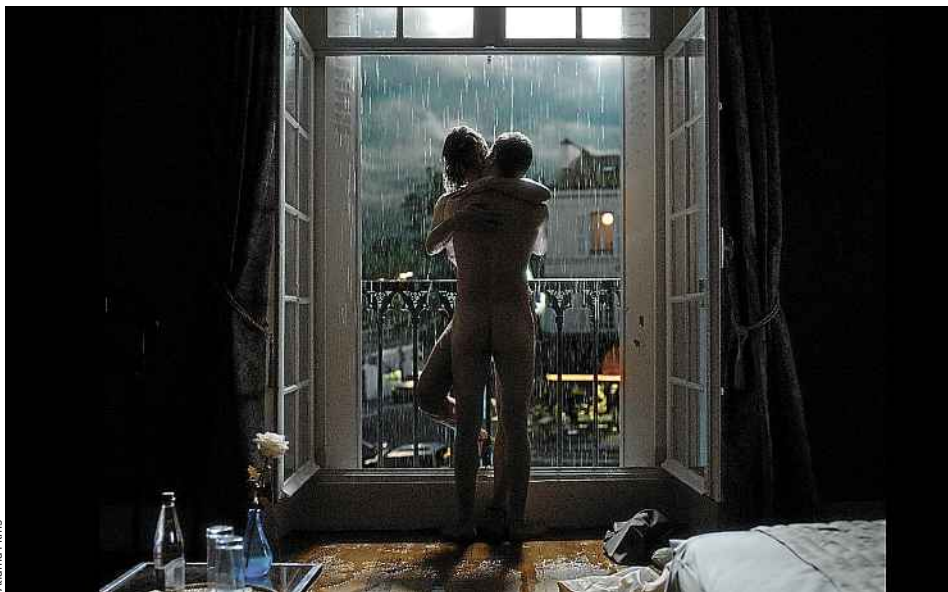
Couple à la ville, Mathieu Amalric et Stéphanie Cléau interprètent le mari et sa maîtresse.

« L'histoire est construite à rebours avec une intrigue im-