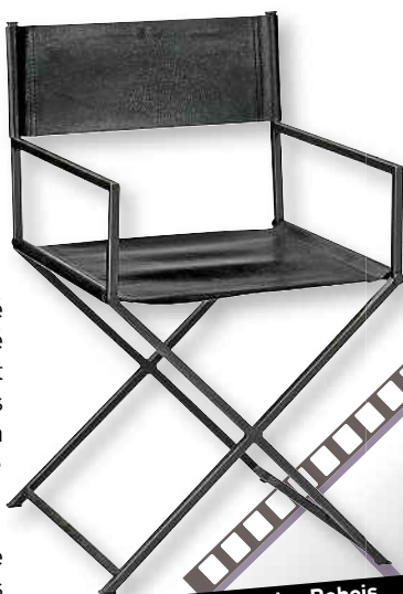
Fauteuil Syntaxe, Roche-Bobois , 680,20 €, www.roke-bobois.com

► Sans lumière, pas d'image. 99,9 % des spectateurs regardent dans un plan ce qui est éclairé. Les ombres projetées sont également importantes : pensez à l'apparition de Nosferatu dans le film de Murnau. Structurez votre espace avec des lampes projecteurs, effet garanti ! ■