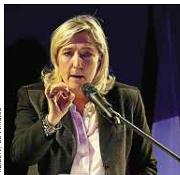
Marine Le Pen en mars 2014.

« Des attestations prouvent que c'était son chauffeur qui conduisait », soutient son avocat M e losca. Comme les amendes ont été réglées, les infrac-