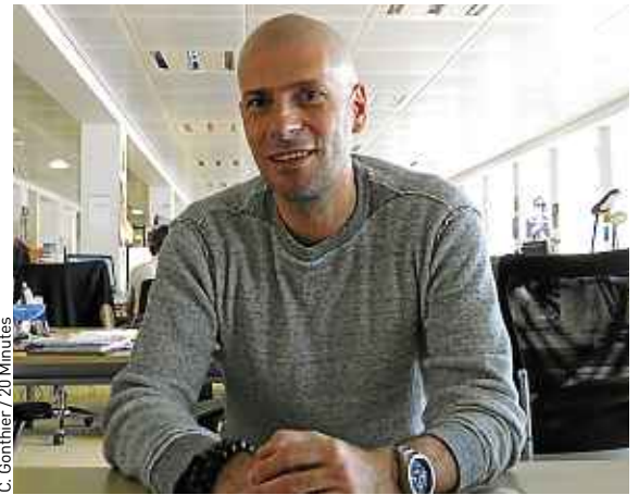
Il a chatté depuis la rédaction de « 20 Minutes », jeudi.