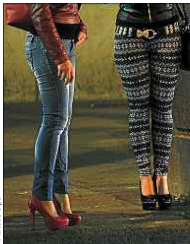
Il y aurait entre 5 000 et 8 000 mineurs concernés (illustration).

Pour les deux tiers, des étrangers originaires de Roumanie ou d'Afrique [Sierra Leone, Nigeria, Ghana, Cameroun...], âgés de 15 à 18 ans. Ils sont généralement embringués dans des réseaux et surveillés par des proxé-