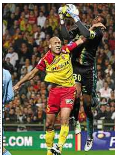
M. Libert / 20 Minutes

Dans l'immédiat, oui. Ils ont besoin de recrues. Après, sur le long terme, non, car Lens ne mourra jamais. Avec cet engouement, je suis persuadé que même si ça devait mal se passer avec Mammadov, le club trouverait des repreneurs. En plus, un stade neuf arrive dans un an. Celui qui a envie de reprendre Lens, il ne tombe pas n'importe où ! ■ Propos recueillis par N.C.