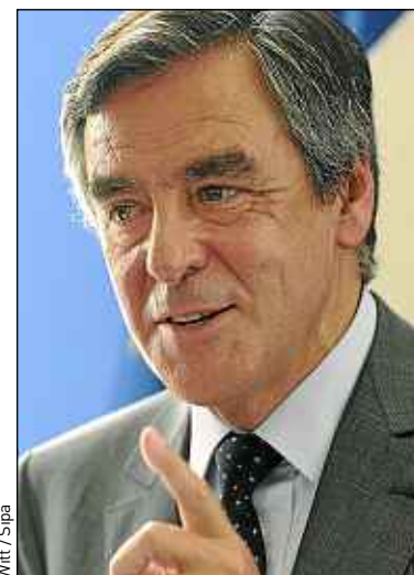
L'ancien Premier ministre s'inquiète du bon déroulement des primaires.