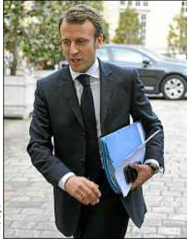
Le ministre Emmanuel Macron.

L'interview aurait été relue à Matignon et à l'Elysée, a expliqué l'entourage du Président au Parisien . Pas de dissonance, donc. « A chaque annonce de