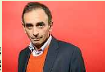
Battel / Sipa