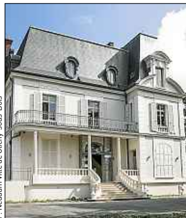
F. Neddiam Ville de Clichy-sous-Bois

taires médicales gèrent la prise de rendez-vous assurant ainsi un certain confort aux médecins. Trois millions d'euros, dont un tiers apporté par l'Union européenne au titre de la correction des déséquilibres régionaux, ont été nécessaires pour monter cette structure qui attend toujours l'arrivée de ses deux dentistes et d'un pédiatre. ■