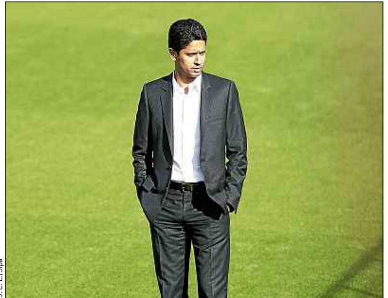
Le président du PSG Nasser Al-Khelaifi, le 26 septembre.

l'acheter à crédit : à partir du moment où vous remboursez, il n'y a pas de problème. C'est ici qu'apparaissent les différences entre certaines règles nationales et internationales. Le fair-play financier se concentre uniquement sur les résultats financiers, pas sur la dette. En France, la DNCG regarde au-delà de l'équilibre du compte de résultat. ■