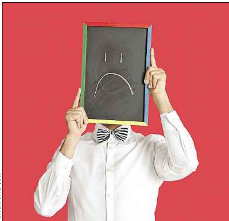
L'envie de certains Français de transformer le pays est réelle (illustration).