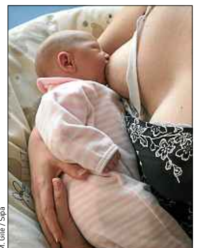
M. Gille / Sipa

Si 55 % des mamans de 25 à 34 ans ont déjà goûté leur lait, les papas ne sont pas en reste. En effet, selon cette étude, ils sont 35 % dans cette même tranche d'âge à avoir testé le lait maternel. A noter qu'ils sont 29 % chez les 35-44 ans et 27,4 % chez les 45-50 ans. Enfin, 67 % des papas goûteurs ont eux-mêmes