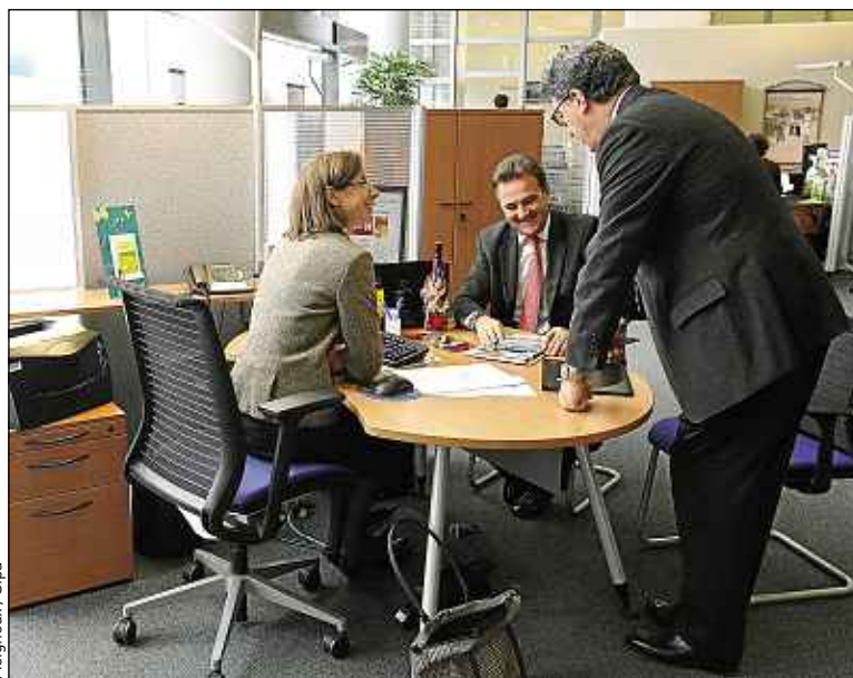
Le conseiller clientèle particuliers représente 19% des effectifs bancaires.