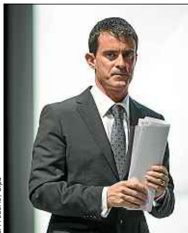
Le Premier ministre a étudié les propositions des élus locaux.

En plus de développer un projet de sous-marin pour explorer le canal de l'Ourcq, les primaires de l'école apprennent à communiquer sur leurs découvertes grâce à un profil Twitter (@savantures_17T). « C'est un fil conducteur et une trace collective pour des groupes amenés à évoluer chaque trimestre », explique Aurélien Brendel, l'instituteur.