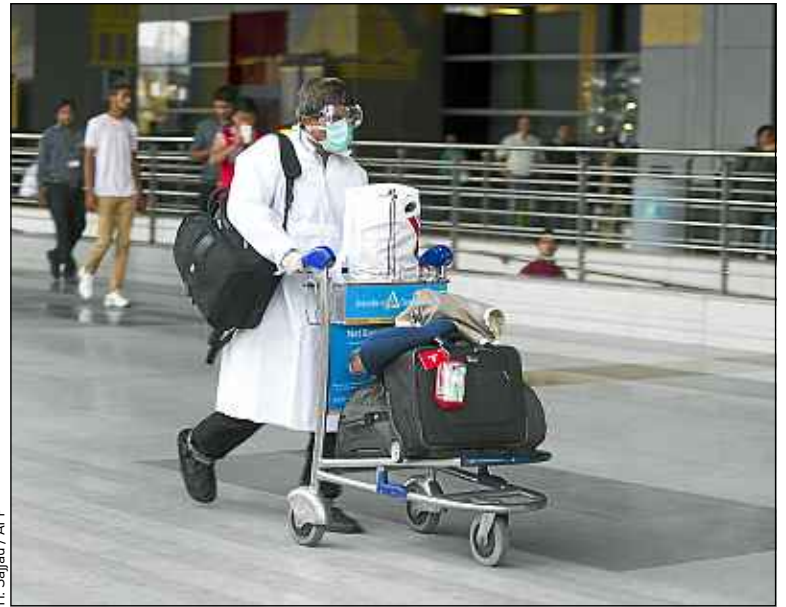
Des mesures ont été prises dans les aéroports (ci-dessus : un cas suspect).

Pour parer à cette éventualité, des mesures ont été prises dans tous les aéroports internationaux, a annoncé le gouvernement ces derniers mois. Mais ce qui inquiète Peter Piot, ce sont surtout les habitudes du personnel de santé indien. « En Inde, les médecins et les infirmières ne portent souvent pas de gants de protection. Ils seraient immédiatement infectés et propageraient le virus », prédit-il. Si une ligne d'appel nationale ouverte 24 heures sur 24 a été lancée, l'heure ne semble en outre pas à la grande mobilisation en Inde. Selon Les Echos , les grands hôpitaux assurent aujourd'hui encore ne pas avoir reçu d'instructions du ministère de la Santé sur la conduite à adopter en cas d'arri-