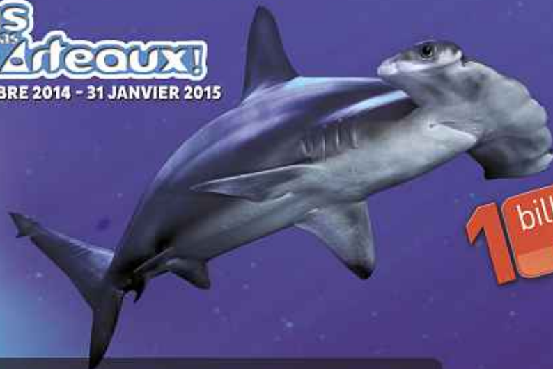
Illustration: © David White - www.davidwhite.com