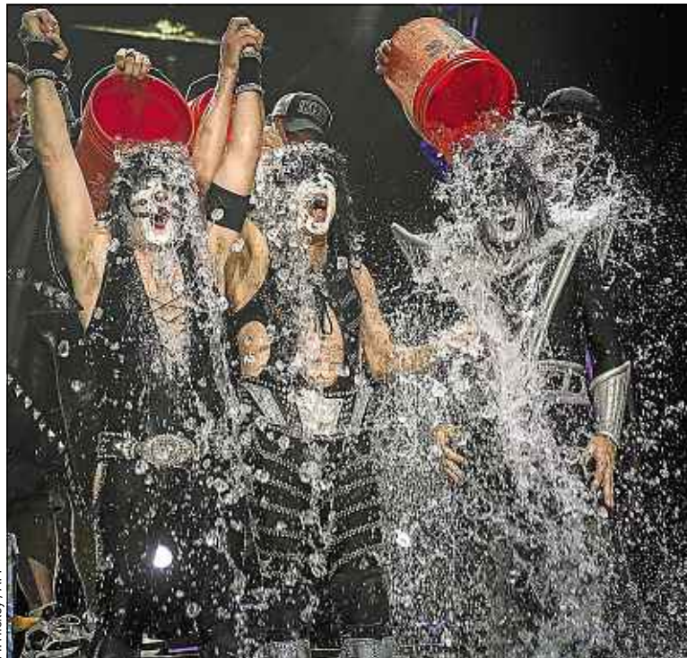
Les membres du groupe Kiss ont eux aussi relevé le défi du seau d'eau glacée.