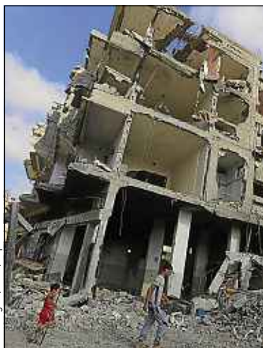
La trêve n'a pas été rompue à Gaza.

Environ 1 400 mineurs, dont les plus jeunes étaient âgés de 11 ans, ont été victimes d'abus sexuels entre 1997 et 2013 à Rotherham, dans le nord de l'Angleterre, alors que les services municipaux avaient été alertés, selon un rapport publié mardi.