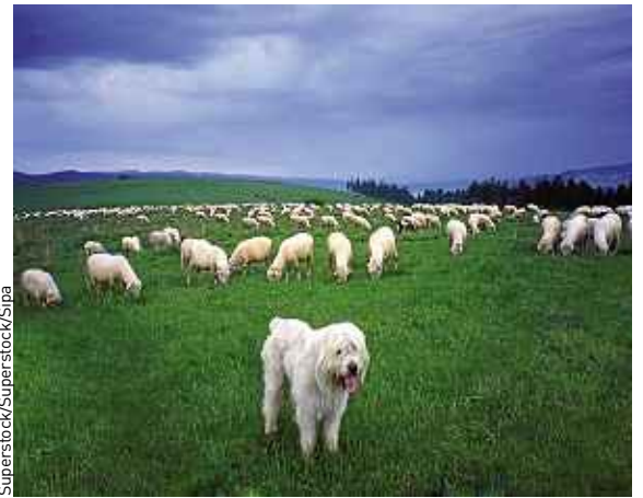
Son secret pour diriger les moutons est mis au jour.

suédoise d'Uppsala, et ses collègues ont alors analysé ces données pour établir l'algorithme (suite d'opérations permettant de résoudre un problème) régissant les décisions et les actions du chien de berger. Lequel, finalement très simple, se résume à rassembler les moutons lorsqu'ils se dispersent et les pousser vers l'avant lorsqu'ils sont de nouveau réunis. Cette découverte a été publiée mercredi dans la revue britannique Journal of the Royal Society Interface . ■