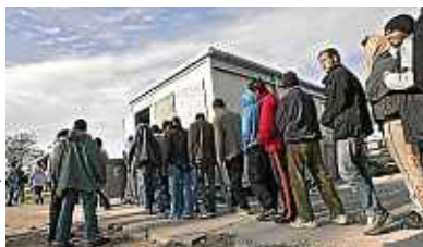
M. Libert / 20 Minutes

Comment éviter un nouveau Sangatte sur la côte P.2