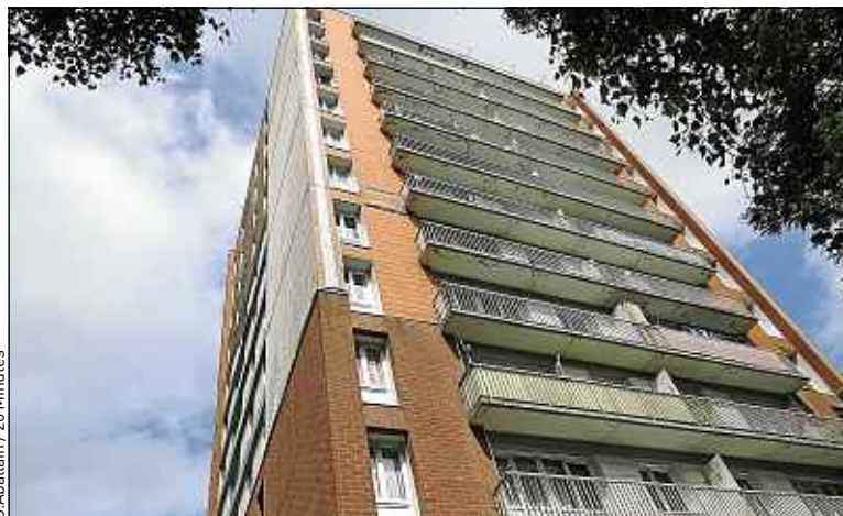
La tour du pavillon Alfred de Vigny, à Loos Oliveaux.

tion de Villeneuve-d'Ascq. Leur rôle : transporter, comme des sherpas, le paquetage de certains résidents jusqu'à leur étage. Seul le port des provisions est éligible à ce service pour des questions d'assurance. Le chemin de croix des habitants doit néanmoins se terminer le 9 septembre avec la mise en service d'équipements rénovés aux normes. ■ O. A.