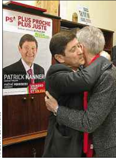
Patrick Kanner élu au département.

V ue de Paris, l'arrivée surprise de Patrick Kanner au ministère de la Ville, de la Jeunesse et des Sports passe pour un geste en direction de Martine Aubry. Pourtant, la réaction de la fédération du PS du Nord à cette nomination a tout de la douche froide. Tout en souhaitant poliment la réussite du gouvernement, le communiqué envoyé, dès mardi soir, par la fédération précise très vite que c'est « à titre personnel » que Patrick Kanner a accepté la proposition qui lui a été faite. Le genre de formule qu'un parti réserve à un camarade qui s'affranchit de la ligne officielle.