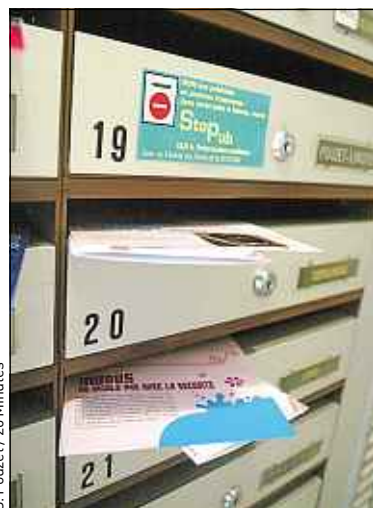
« Stop pub » a été lancé en 2004.

Résultat : « La pression des imprimés non adressés s'est fortement accrue, leur poids moyen sur un mois est passé de 2 kg par ménage en 2004 à