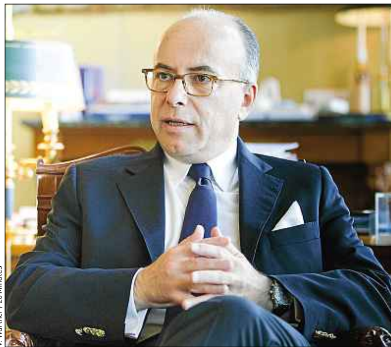
V. Wariner / 20 Minutes

Le ministre de l'Intérieur entend réduire le délai pour repasser le permis.