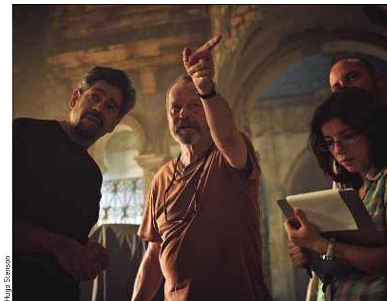
Le réalisateur Terry Gilliam sur le tournage de Zero Theorem .

Je joue des personnages grotesques, donc je ne stresse pas trop. C'est juste fatigant physiquement. Il est étrange de revenir avec les Monty Python. Je ne suis même pas certain que ce soit une bonne idée... ■