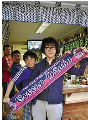
Les supporters japonais, mardi.