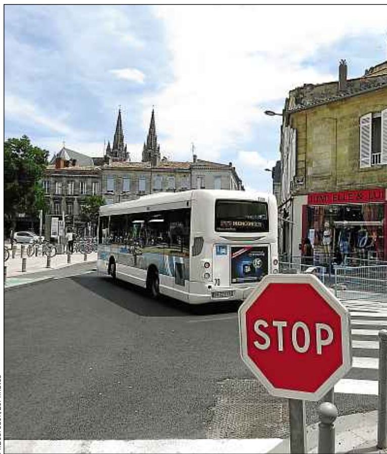
Les bus doivent emprunter notamment la rue de la Course

Maire-adjointe du quartier, Anne-Marie Cazalet assure que ce tracé « a toujours figuré parmi les options possibles. » Elle explique que « la mairie a trouvé plus équitable de n'effectuer qu'un seul passage de bus dans la rue d'Aviau, plutôt que d'y faire circuler les bus dans les deux sens. Nous allons cependant étudier la possibilité de dévier certaines lignes plus au sud, et d'autres plus au nord. Nous sommes conscients de la gêne occasionnée, mais nous avons l'obligation de maintenir la continuité du service public pendant les travaux. » ■