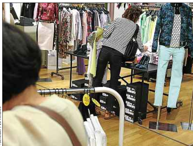
Selon un chercheur, les soldes s'apparentent à une « fête païenne ».

De plus, les produits soldés sont limités à la fois en nombre et sur la durée, les cinq semaines légales. « On crée une émotion différente, un stress, qui justifie qu'on se presse », poursuit le spécialiste des modes de consommation. Cette poussée d'adrénaline expliquerait des réactions démesurées par rapport au produit. On le voit, il pourrait être la