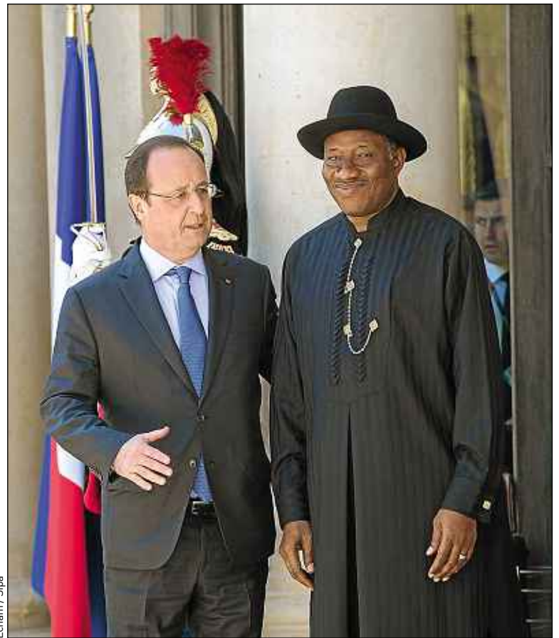
Le président Goodluck Jonathan avait rencontré François Hollande en mai.