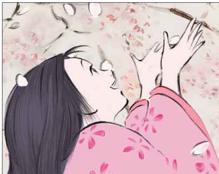
2014, Hayao Takahata, Studio Ghibli

Le diaporama des sorties ciné de la semaine sur 20minutes.fr