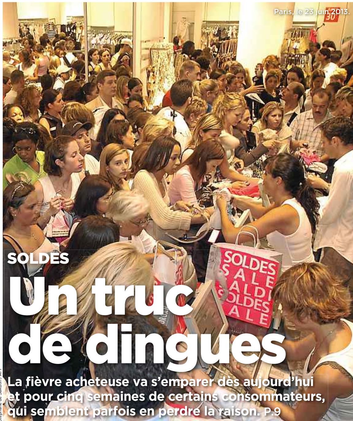
Paris, le 23 juin 2013.

La déprime réjouissante de Terry Gilliam P.12