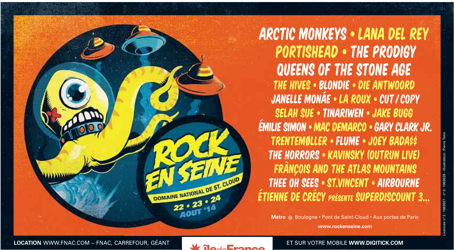
Licences n° 2 : 1063027 - n° 3 : 1063028 - Illustration : Pierre Tatin

Si aucun de ses joueurs n'y figure (à moins que Cabella...), le MHSC sera bien représenté à la Coupe du monde par son analyste vidéo, Nicolas Jover, qui apportera ses compétences pour la Croatie.