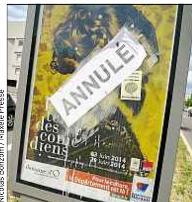
Les affiches du festival malmenées.