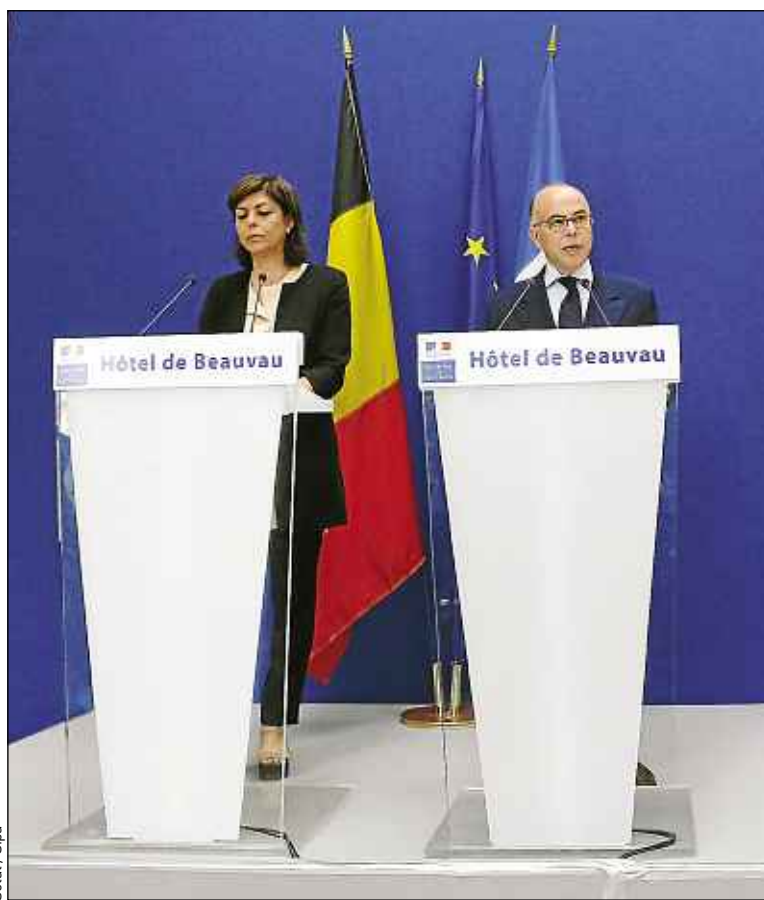
Bernard Cazeneuve et son homologue belge Joëlle Milquet.

La coopération est indispensable, mais il n'y aura jamais une sécurité à 100 % et des individus arriveront toujours à passer entre les mailles du filet. Il ne faut pas qu'un ou des pays européens partent dans le tout-sécuritaire, ce serait une victoire pour le terrorisme. ■