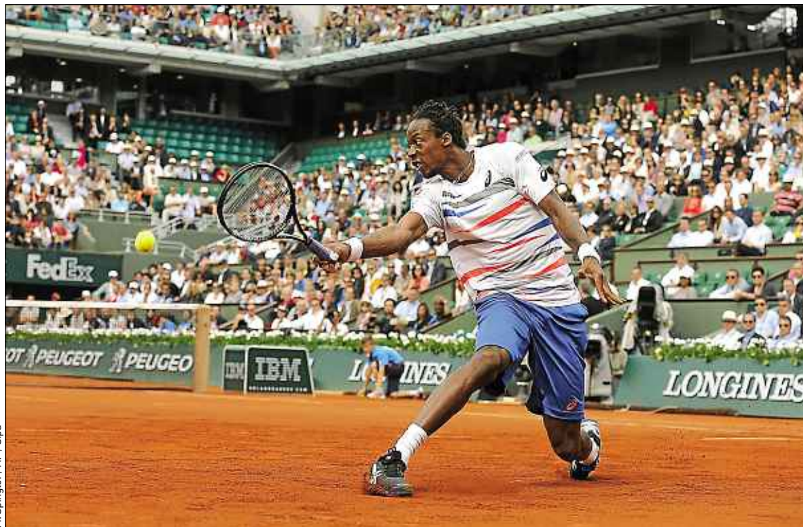
L'endurance et l'explosivité de Gaël Monfils ont impressionné Arnaud Di Pasquale et Jérémy Chardy.

► Jérémy Chardy, 42 e mondial : « La première fois que je l'ai affronté, on devait avoir 12 ans. Il n'avait fait