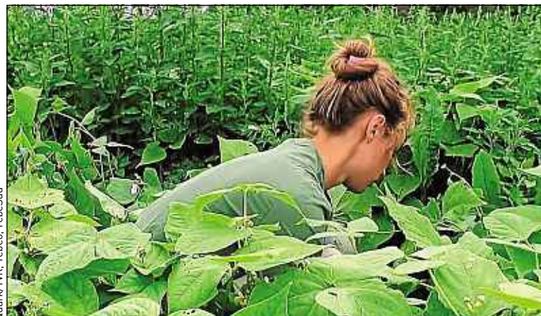
Quark/TVR, Trébéo, Trébésud

« Ça a pris d'un seul coup. Du fin fond de ma Bretagne, ça paraissait irréel », raconte la réalisatrice Marion Gervais, qui a filmé au plus près, sans commentaires, pendant deux ans. Au-delà