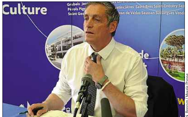
N. Bonzom / Maxèle Presse

Le maire divers gauche de Montpellier est favorable à la réforme.