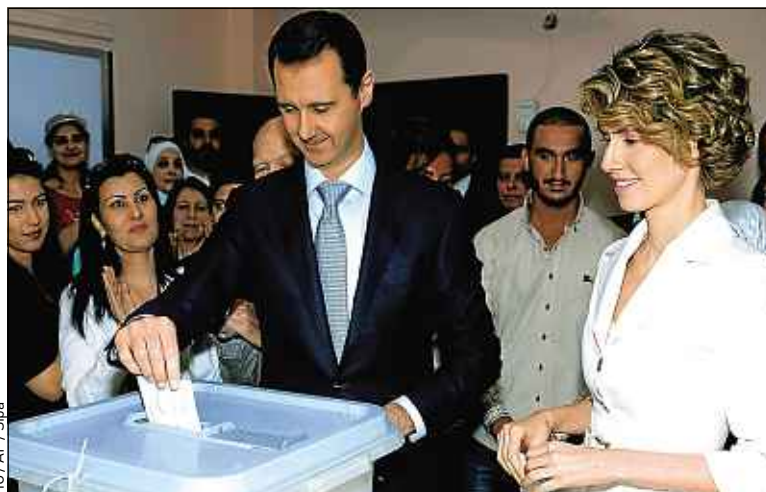
Bachar al-Assad et son épouse Asma ont voté en toute décontraction.

Plus de 15 millions de Syriens étaient appelés aux urnes dans un pays à feu et à sang après trois ans d'une guerre civile ayant fait plus de 162 000 morts et 9 millions de déplacés. ■