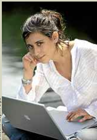
Closos / Isopix / Sipa