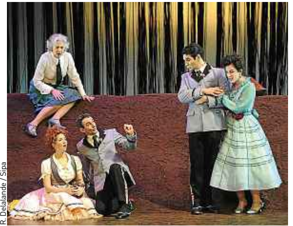
Lakmé de Léo Delibes à l'Opéra Comique de Paris.