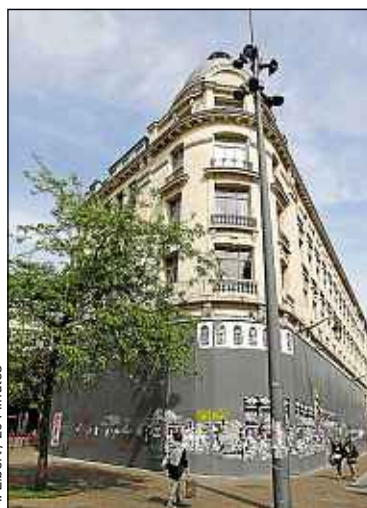
Le futur Store, rue Faidherbe.

Les arrêtés ont été pris le 25 avril au bénéfice de la société Ganter Interior Allemagne. La simple mention de ce prestataire, qui a déjà réalisé l'aménagement de plusieurs magasins Apple Store en France, vient confirmer, si besoin était, l'identité du commanditaire. Car, à ce jour, et malgré de fréquentes relances, Apple France