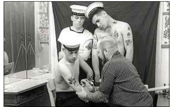
Schwarz-Weiß / Herbert Hoffmann and Galerie Gebr