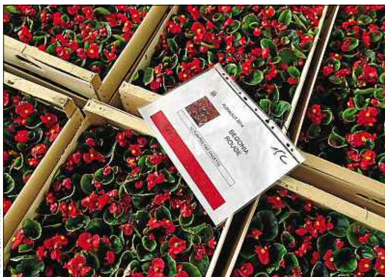
Plantations de bégonias et d'osteospermums au Grand Sud à Lille.

rement, elle tend ses caquettes à l'animatrice et explique : « Je les ai arrosées en rentrant de l'école. Ça me fait mal au cœur de les laisser, mais je les reprendrai après l'opération. Ça m'a donné envie d'en faire d'autres. » Jus-