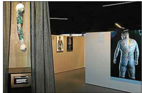
G. Deblondé / Musée du quai Branly

L'exposition se tiendra jusqu'au mois d'octobre 2015, ce qui en fait la plus longue de l'histoire du musée.