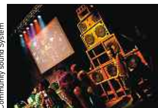
Community sound System

★ 10 € par soir, vendredi et samedi de 22 h à 4 h à la Maison Folie de Wazemmes, Lille.