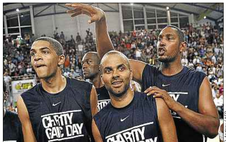
P. Andrieu / AFP