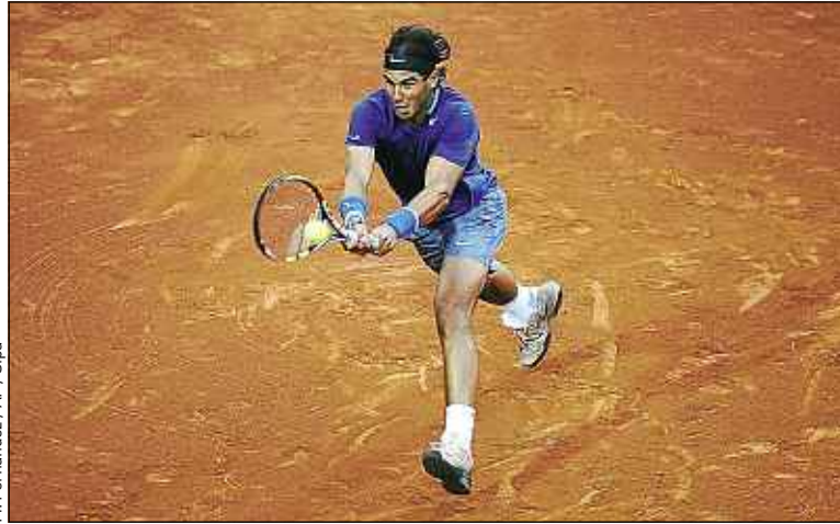
Rafael Nadal devra confirmer sa suprématie sur terre battue à Madrid.

Le coup de mou que rencontre actuellement le roi de la terre battue n'est pas anodin et vient après une année 2013 très chargée durant laquelle il a repris la tête du classement ATP avec dix titres. « Il ne faut pas oublier qu'il a retrouvé sa place alors qu'il a raté les deux premiers mois de la compétition (à cause d'une blessure au genou), rappelle Ju-