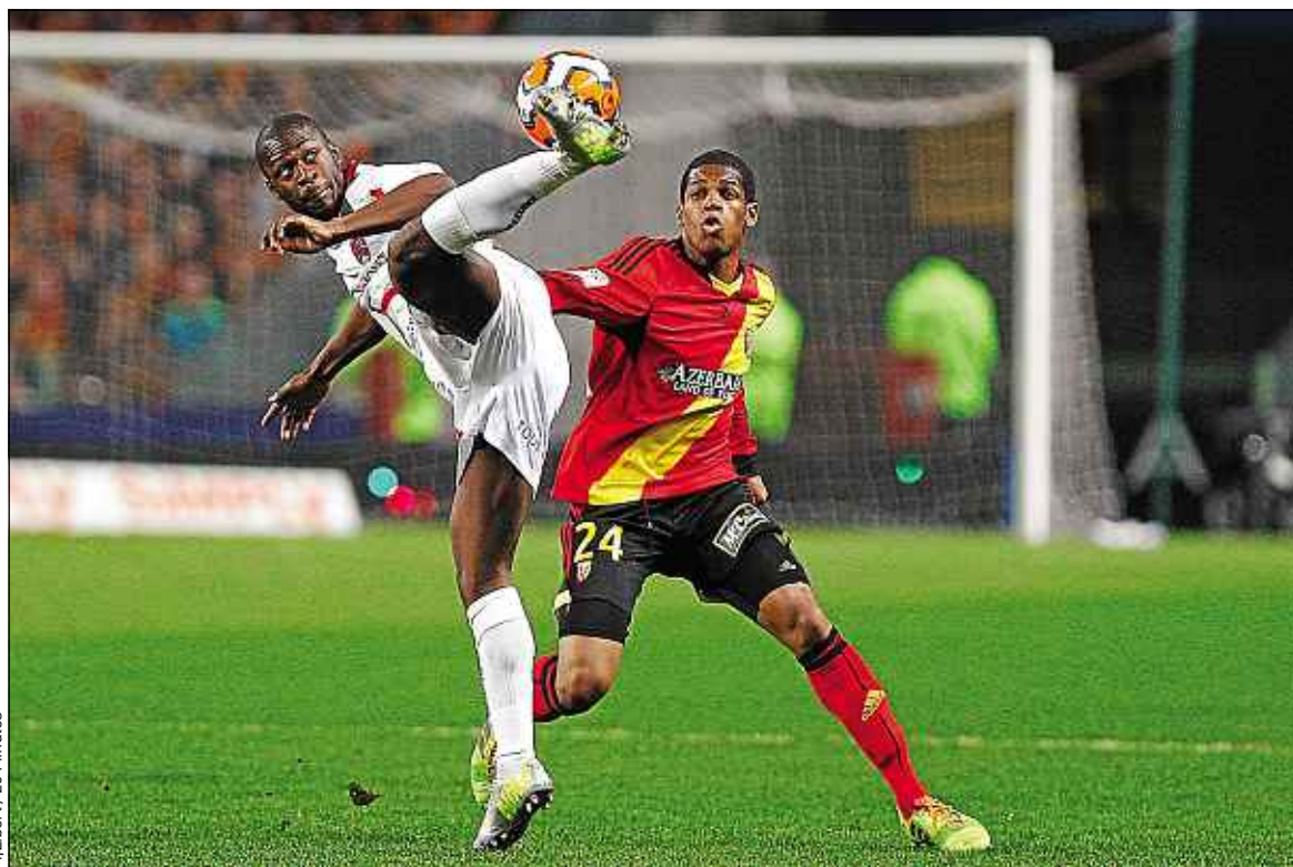
M. Libert / 20 Minutes

Tourcoing joue la montée en Ligue A jeudi contre Nice. Pour ce match qui se jouera à Paris, le TLM a décidé d'organiser un déplacement en bus (15 € avec la place) pour ses supporters. Réservation à l'adresse: communicationtlm@gmail.com .