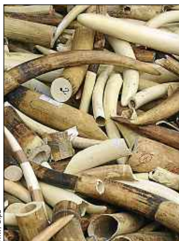
La France a détruit un stock d'ivoire.

En Chine, il existe un marché légal de l'ivoire. Ce pays doit mettre en place une stratégie de réduction de la demande. ■ Propos recueillis par A. Ch.