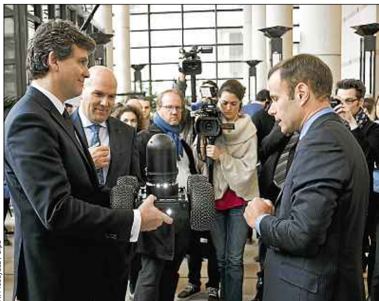
Arnaud Montebourg et Bruno Bonnell (tous les deux à gauche), mardi.

Le marché est en effet potentiellement immense. A l'heure actuelle, il représente près de 17 milliards d'euros dans le monde, mais il devrait atteindre les 100 milliards en 2018 et les 200 milliards en 2024. ■