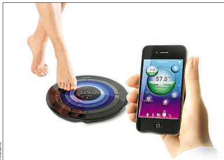
La Target Scale de Medisana a des allures de soucoupe volante.

► Smart Body Analyser de Withings. La firme française est devenue une sommité dans le mode de la pesée connectée. Lestée de son application iOS ou Android, cette balance permet de suivre son poids tout en se fixant un objectif à atteindre.