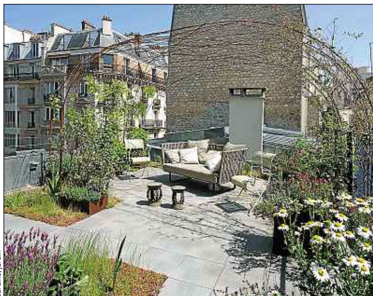
La structure Polypode peut être installée sur un toit ou sur une terrasse.

« Nous mettons en place des plantes assez rustiques, qui grimpent sur la structure. On peut également laisser la place à des plantes potagères. Une de nos plantes grimpantes est par exemple une vigne. » Le temps de création n'excède pas deux semaines pour un prix moyen de 3000 € pour une