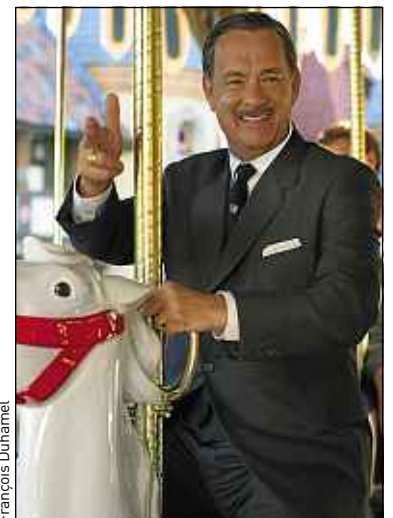
Tom Hanks incarne Walt Disney.