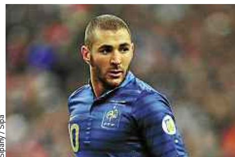
Sipany / Sipa