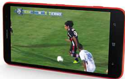
NOKIA LUMIA 1320 DAS : 0,46 W/kg (2)

RETROUVEZ TOUS LES MATCHS DE LA LIGUE 1 ® EN DIRECT VIDÉO (1)