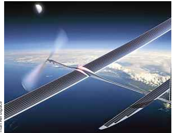
Titan Aerospace B.C. Le modèle Solara 50 de Titan Aerospace.

ans sans entretien. Facebook envisagerait de se porter acquéreur de Titan Aerospace pour 60 millions d'euros, une paille pour un géant comme l'entreprise de Mark Zuckerberg. Ces drones, dûment équipés en antennes-relais, pourraient permettre de se connecter à Internet depuis n'importe quel point du globe, y compris les plus isolés. Avec une armada de 11 000 drones, Facebook supprimerait toutes les « zones blanches » de la Terre. ■