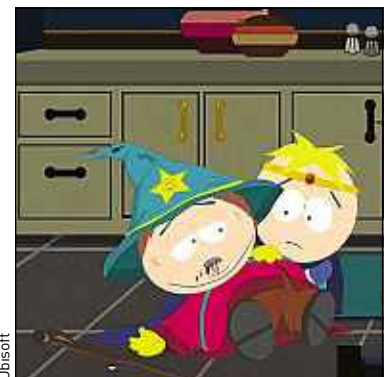
« Le Bâton de la vérité », sorti mardi.