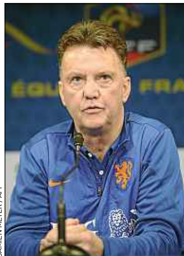
Le sélectionneur Louis Van Gaal.