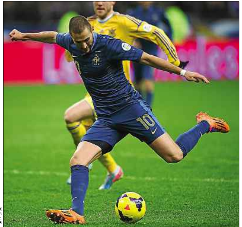
Karim Benzema avait été décisif lors des barrages face à l'Ukraine.

« Content dans [s]a vie, content de jouer au foot », Benzema tourne à près d'un but par match avec le Real Madrid. Parce qu'il a « continué à travailler » quand ça allait mal, mais sans doute aussi parce qu'il a créé une relation particulière avec Zinédine Zidane, devenu cette saison coach adjoint de Carlo Ancelotti. « Il est toujours avec moi à Madrid, on travaille beaucoup après les entraînements, notamment dans la gestuelle devant le but, raconte l'ancien Lyonnais. Il est comme un grand frère. Je sens qu'il a