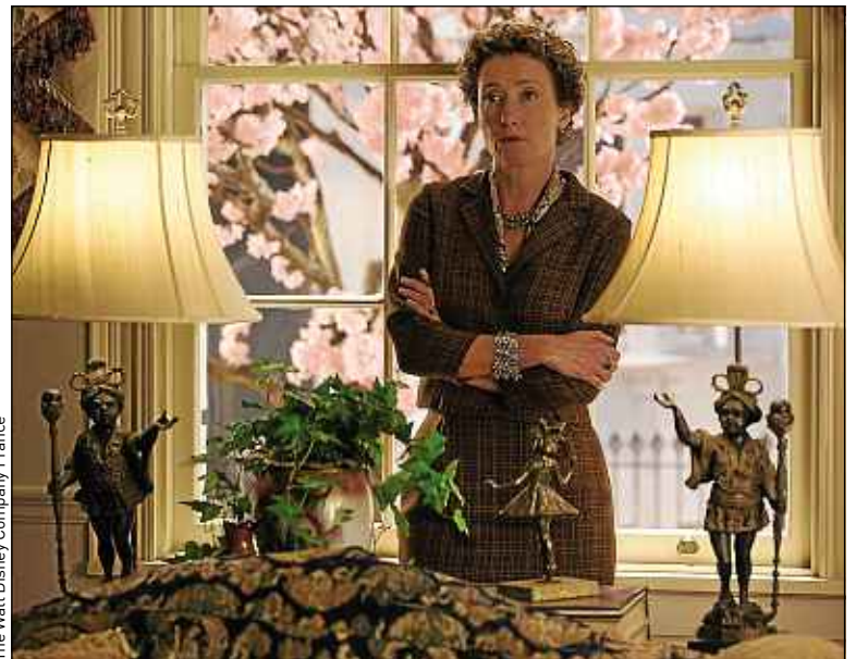
P. L. Travers (Emma Thompson) ne facilita pas l'adaptation de son roman.