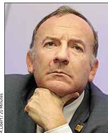
Pierre Gattaz, président du Medef.

Mais Force ouvrière a déjà prévenu qu'elle ne le signerait pas. La CFDT, qui était pourtant la plus ouverte aux négociations sur le pacte, a également immédiatement fait savoir que le texte ne lui convenait pas. La CGT a estimé que la lecture de ce texte confirmait « son opposition au pacte ». Et la CFE-CGC l'a qualifié de « provocation ». Ce projet d'accord propose notamment l'ouverture « de discussions sur des objectifs d'emploi » au niveau des branches professionnelles dans les