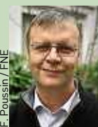
F. Pousin / FNE

Déjà 160 millions d'euros. C'est le manque à gagner lié au report de l'écotaxe depuis le 1 er janvier affiché par notre compteur