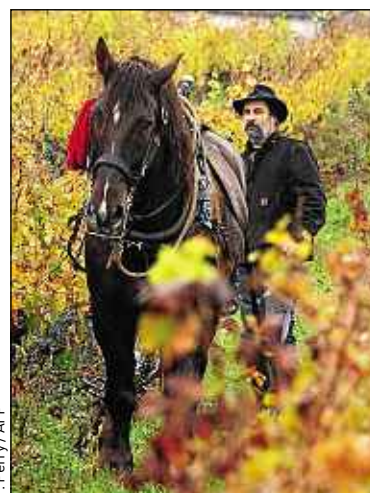
F. Perry / AFP