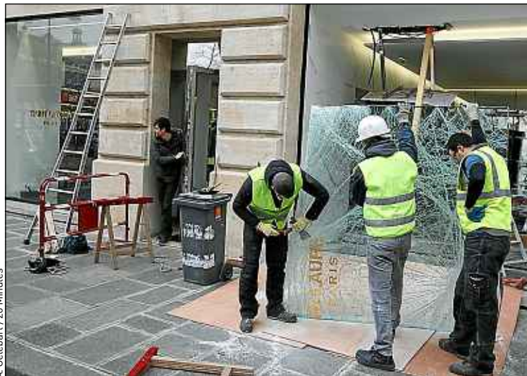
De la maroquinerie de luxe et des vêtements ont été dérobés.

Le 3 e district de la police judiciaire parisienne a été chargé de l'enquête. ■