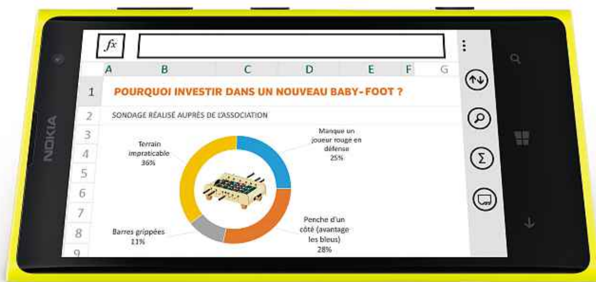
NOKIA LUMIA 1020