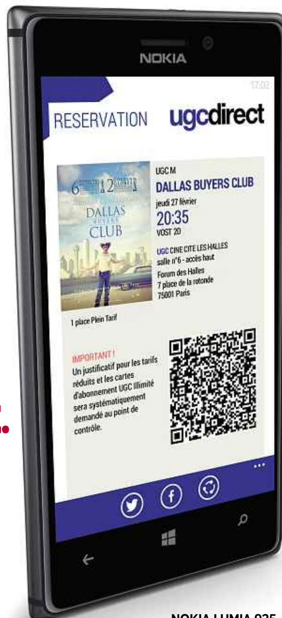
NOKIA LUMIA 925

UGC DIRECT : SIMPLIFIEZ-VOUS LA VIE EN RÉSERVANT VOTRE PLACE DEPUIS VOTRE LUMIA. #cachangetout