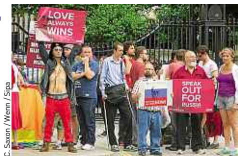
C. Saxon / Wiem / Sipa