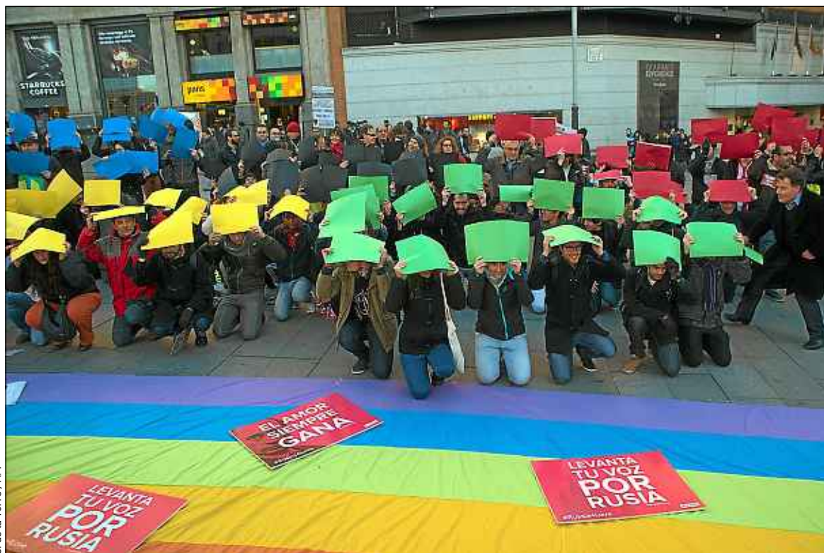
C. de la Torre / AFP

Gabriela Knaul, rapporteur spécial des Nations unies sur l'indépendance des magistrats et des avocats, a réclamé mercredi à Abou Dhabi une enquête indépendante sur des allégations de torture dans les prisons des Emirats arabes unis, qu'elle n'a pas été autorisée à visiter.