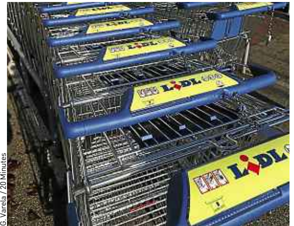
Les faits ont eu lieu dans un magasin Lidl.

2 000 € de provision à ma cliente en attendant de solder le préjudice », a-t-elle annoncé. Les faits remontent à avril 2012. La victime, aujourd'hui âgée de 40 ans s'était luxée le coccyx. Lidl considère que la feuille de salade n'était pas à l'origine de la chute, arguant qu'une vidéo de surveillance montrait la cliente tomber en avant. « Mais cette vidéo n'a jamais été produite au débat, et surtout, ça ne correspond pas avec une luxation du coccyx », a rétorqué M e Boyé. ■