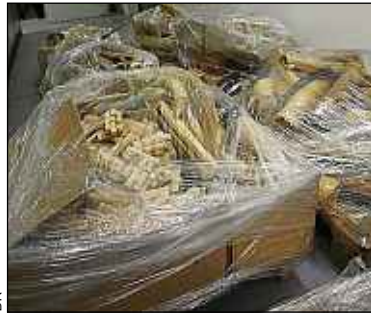
Une partie de l'ivoire saisi.

En agissant ainsi, la France « envoie un message aux trafiquants et illustre la volonté de destruction systématique des stocks saisis », se félicite Philippe Martin, le ministre de l'Ecologie. Alors que les éléphants d'Afrique de l'Ouest ont été victimes d'un taux de braconnage record en 2013, les accords internationaux de