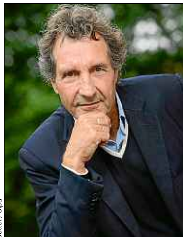
Ballet / Sipa

Je trouve qu'elles font plutôt bien leur travail. Elles n'ont pas vocation à ap-