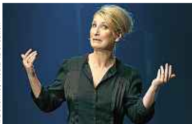
A. Delienne / Houla-La-Creation

Un concours pour révéler l'humour au féminin P.16