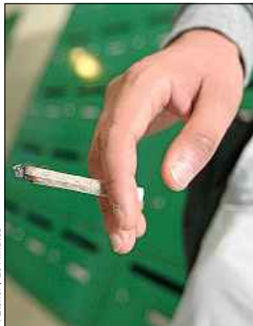
Le test est destiné aux particuliers.