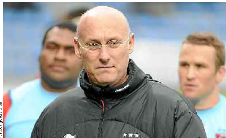
L'entraîneur toulonnais Bernard Laporte avait insulté un arbitre.

le 4 janvier en Top 14. « On a énoncé des propos clairs, pourquoi je les avais tenus [les propos]... Ma motivation, elle est simple, je veux que le rugby soit de plus en plus professionnel », a affirmé Laporte à sa sortie. L'entraîneur risque une sanction lourde. Il a déjà été interdit de banc et de vestiaire 60 jours en 2012 pour des propos injurieux envers l'arbitre Romain Poite. ■