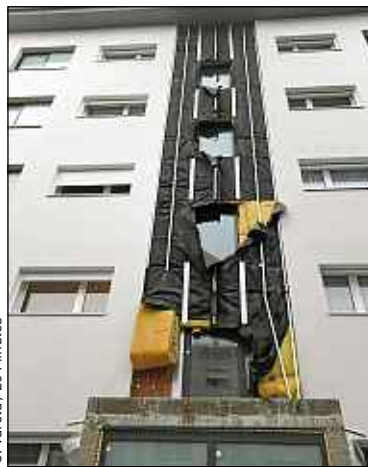
Trente mille logements alsaciens sont à traiter d'ici à 2020.

* Conseil général 68, agglomérations mulhousienne et strasbourgeoise, caisse des dépôts et association des organismes HLM d'Alsace.