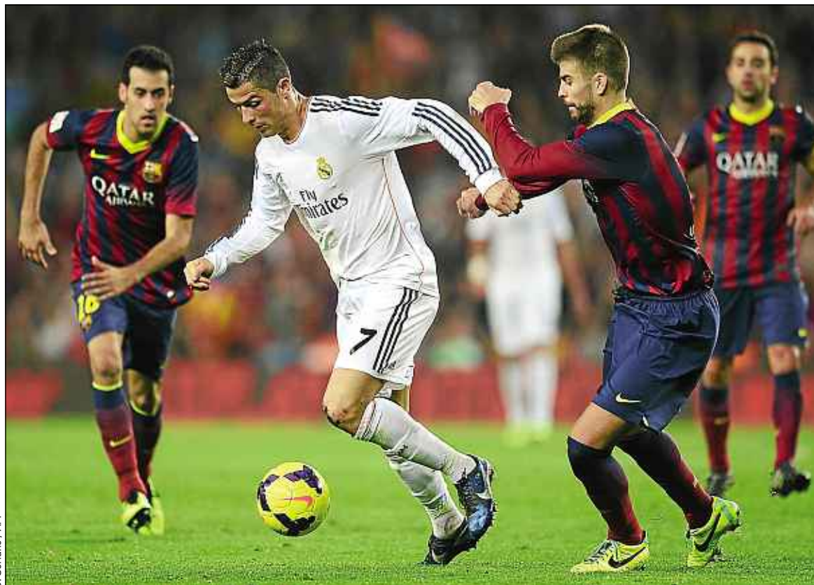
En 2013, que ce soit avec le Real Madrid ou avec le Portugal, Ronaldo a marqué 69 buts en 59 matchs !