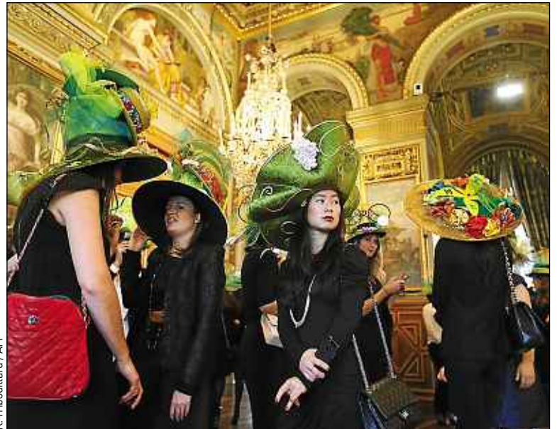
Des catherinettes coiffées de leur chapeau, lors d'un défilé à Paris en 2012.

Pourtant, célibataire ne rime pas toujours avec galère. Notamment pour les femmes, parmi lesquelles les célibataires sont statistiquement plus nombreuses dans les professions intellectuelles supérieures bénéficiant de revenus confortables. Dans les villes, les colocations entre célibataires de tous âges se multiplient et les vacances deviennent moins angoissantes pour les solos qui peuvent trouver sur Internet des compagnons de voyage. Et plus si affinités. ■