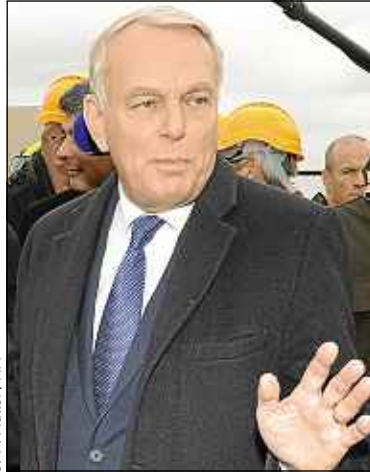
Jean-Marc Ayrault souhaite remettre à plat le système fiscal.

D epuis des mois, on le décrivait impuissant, démonétisé, débordé par son ministre de l'Intérieur, Manuel Valls. Ce lundi, c'est pourtant en patron de la majorité que le Premier ministre reçoit les principales organisations syndicales. Au menu de cette semaine de discussions qui s'achèvera par des entrevues avec les chefs de partis : les contours de la future réforme fiscale, sa proposition-choc. « Avec son idée de remise à plat du système, il s'est sorti de la nasse par le haut. Et il a surpris tout le monde », se félicite un conseiller.