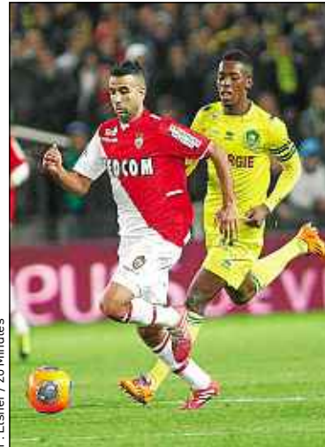
F. Elener / 20 Minutes

Le FCN a ainsi dû se résoudre à défendre, donnant à ce match des allures de partie d'échec pas toujours passionnante. Le gardien de but nantais Rémy Riou a sauvé les siens à plusieurs reprises, mais c'est surtout la mala-