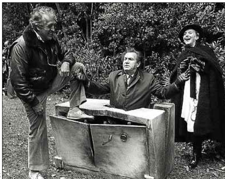
Lautner (à gauche), sa mère et Galabru en 1980 sur un tournage.