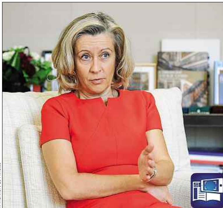
La ministre Hélène Conway-Mouret entend mieux protéger les victimes.

Mais une fois une victime identifiée, c'est aux associations de prendre le relais. « Le consulat n'a pas de moyens ni de structure pour les prendre en charge, voire les rapatrier », précise la ministre. Le ministère des Droits des Femmes, qui a présenté vendredi son quatrième plan de lutte contre les violences faites aux femmes, va d'ailleurs soutenir pendant trois ans le fonctionnement de l'association Voix de Femmes, qui aide les victimes de mariages forcés. Ce plan interministériel va aussi inciter le personnel